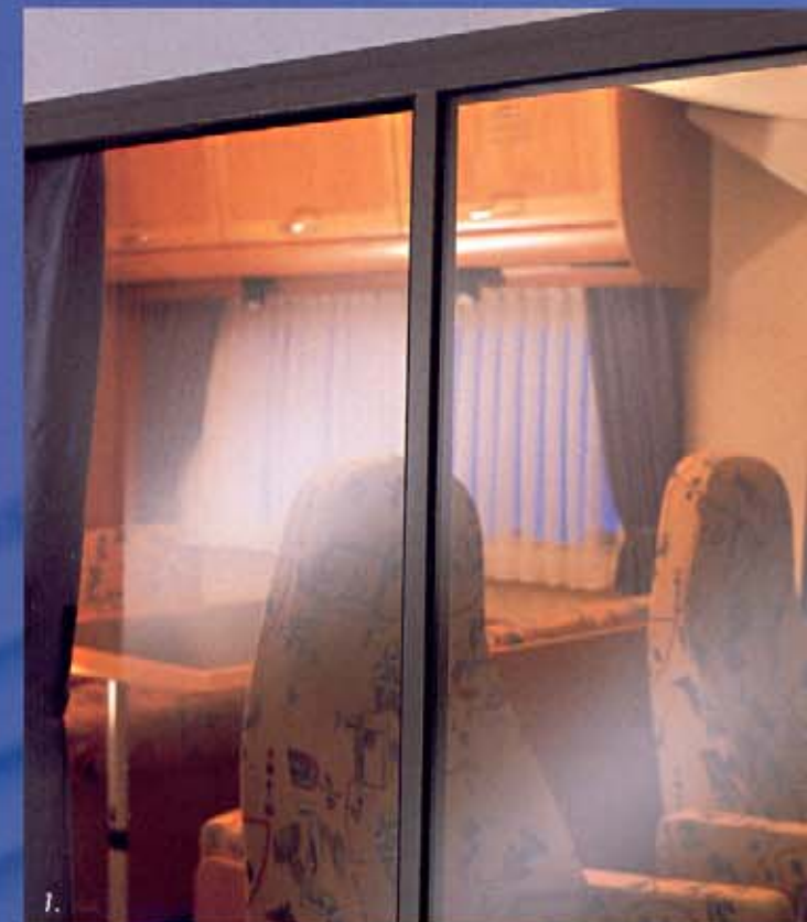
1. Die Fenster aus Doppel-Isol-Glas. 2. Der „Apotheker-Schrank“ in der Küche. 3. Getränke-Parkplatz im Cockpit. 4. Neuartige, leicht erhöhte Möbelkante.

Dazu kommt der neuartige Funktionsboden, in welchem die gesamte Versorgungstechnik sicher untergebracht ist. Auch beim großzügigen Raumangebot und den vielen fortschrittlichen Details der Komfortausstattung wird jedem klar vor Augen geführt, wie innovativ der neue Arto an den Start geht. Wenn Sie jetzt Gas geben, wird Ihnen der Arto dank seines 122 PS starken 2,8-l-Turbodieselmotors auch auf anstrengenden Wegen mit Freude folgen.