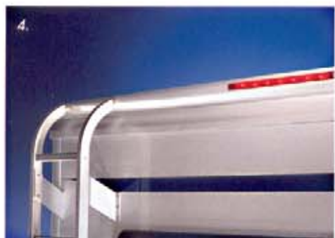
1. Führerhaus mit Klima-Rollo. 2. Die Heckleiter aus formstabiler Aluminiumlegierung. 3. Runde Zagato-Rückleuchten. 4. Dach Heckspoiler mit dritter Bremsleuchte. 5. Neue Kantechnik. 6. Sportlicher Doppelscheinwerfer. 7. Ladeklappe zur Garage.