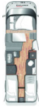
I 735 G