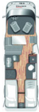
T 732 G