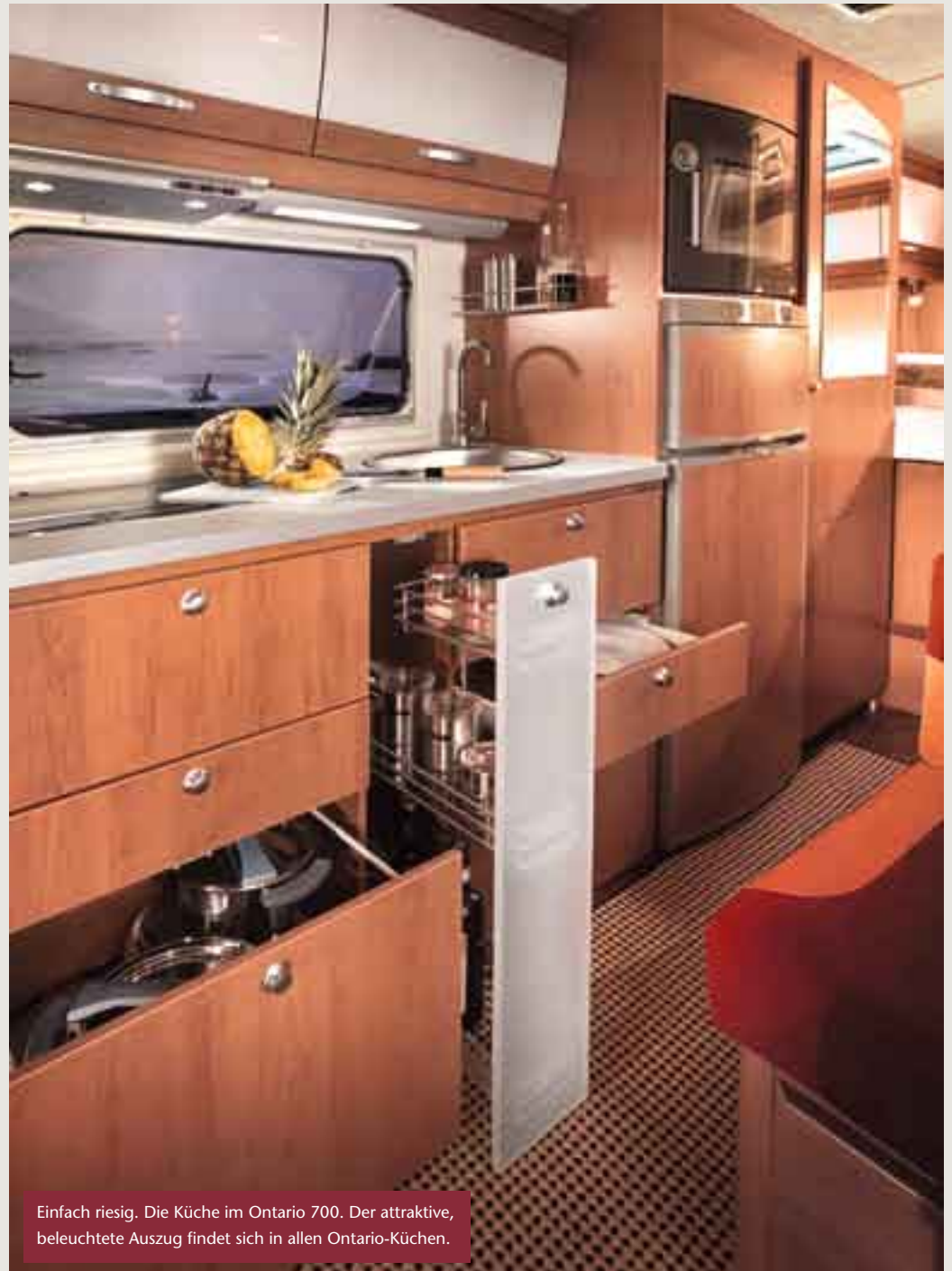
Einfach riesig. Die Küche im Ontario 700. Der attraktive, beleuchtete Auszug findet sich in allen Ontario-Küchen.