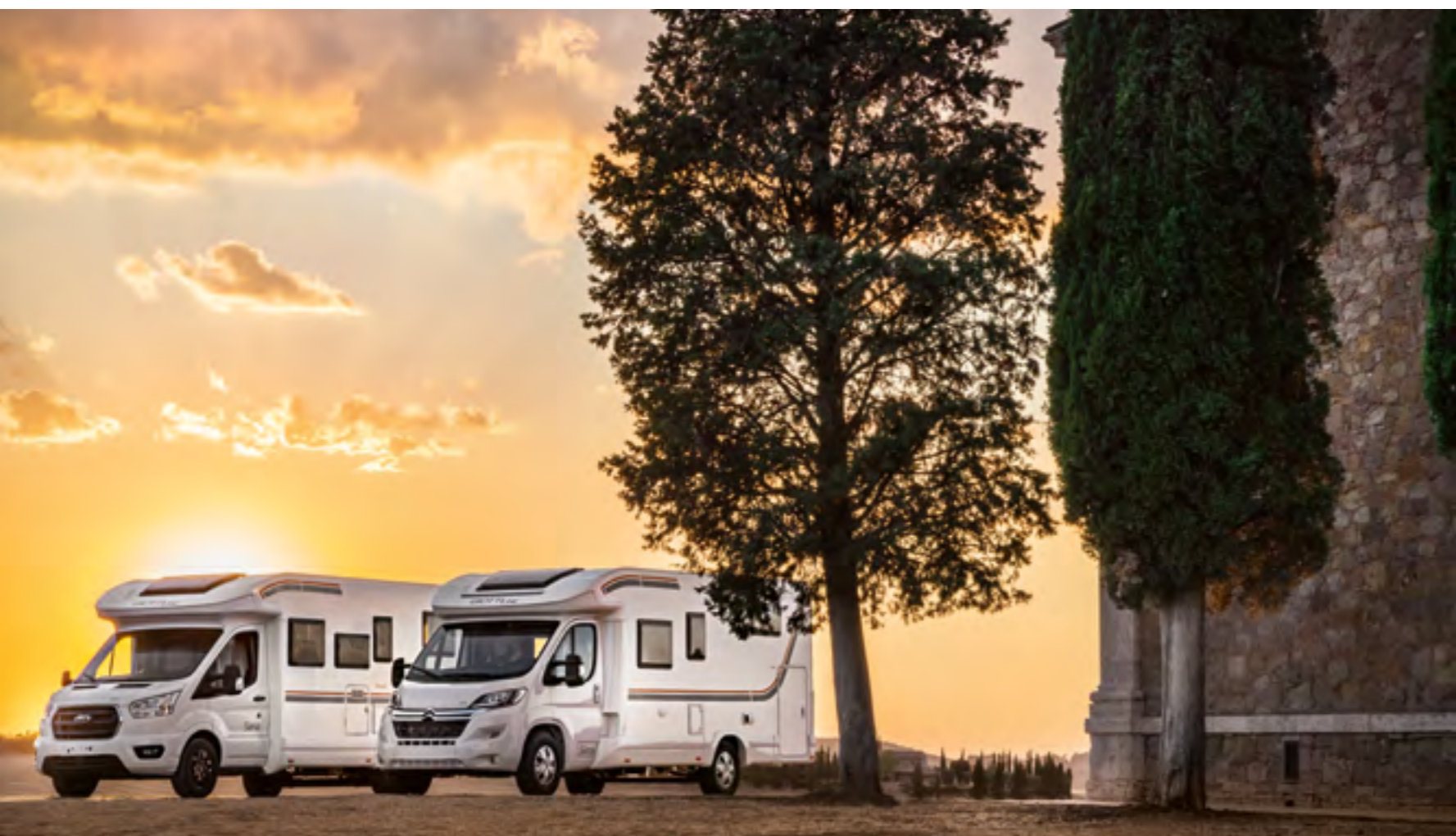
fotografia effettuata a San Quirico d'Orcia