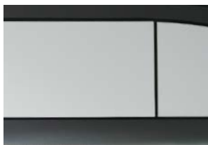
Décor de mobilier