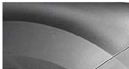
Gris magnétique métallisé