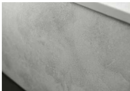
Décor de mobilier

Ambiance intérieure Renolit Makalu Pearl Grey