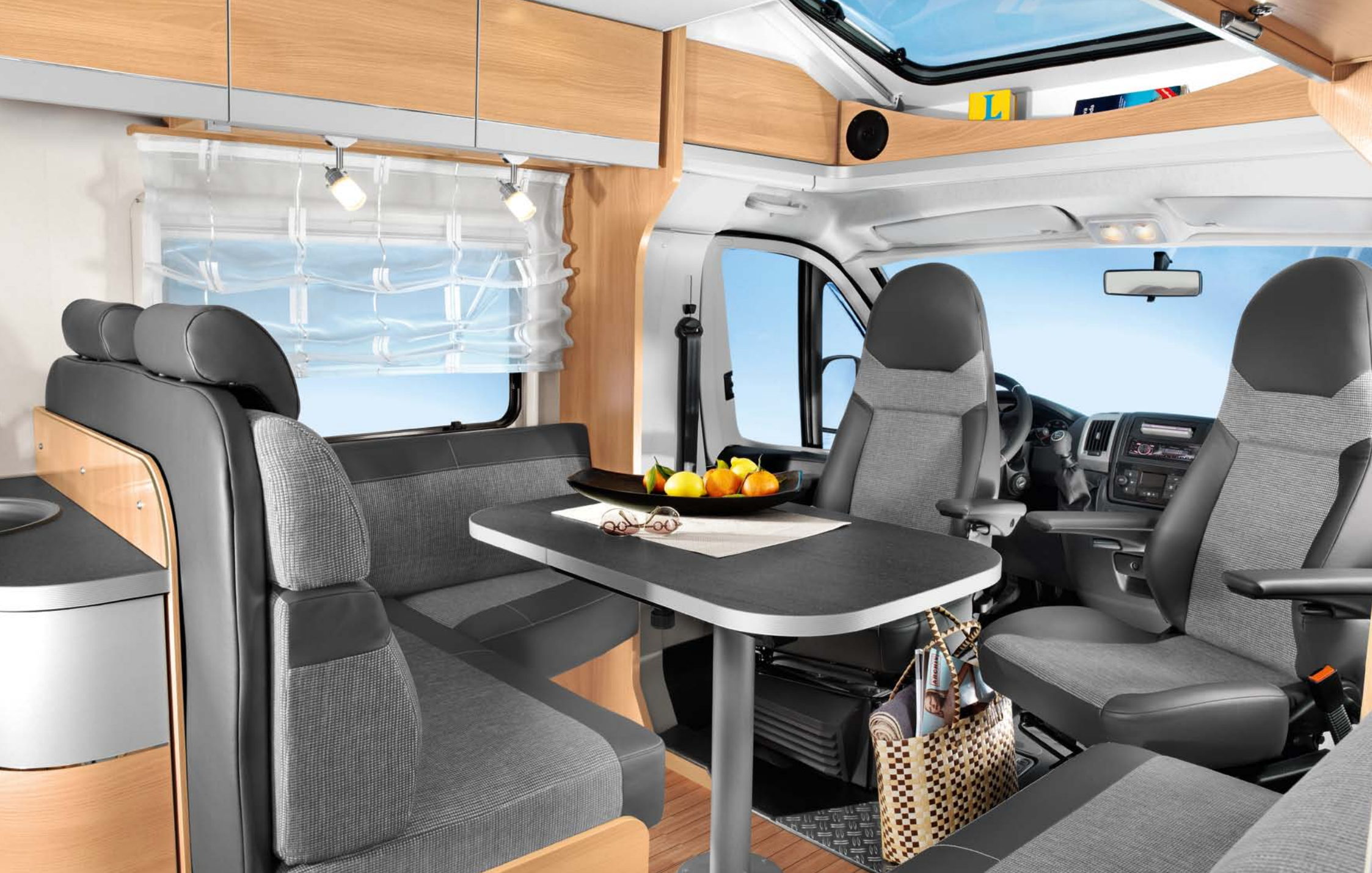
Cinq convives seront à leur aise dans l'espace salon en L, autour d'une table pourvu d'un pied central.