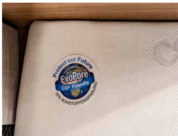
MEDICOOOL MEHRZONEN-KALTSCHAUMMATRATZE MIT SCHULTERENTLASTUNG