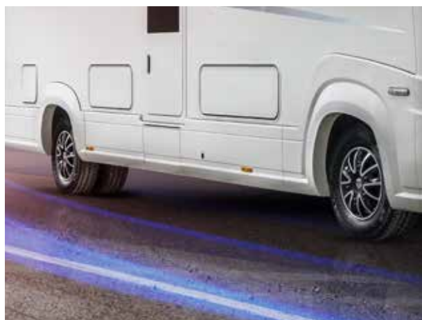
SPURVERBREITERUNG VORDER- UND HINTERACHSE