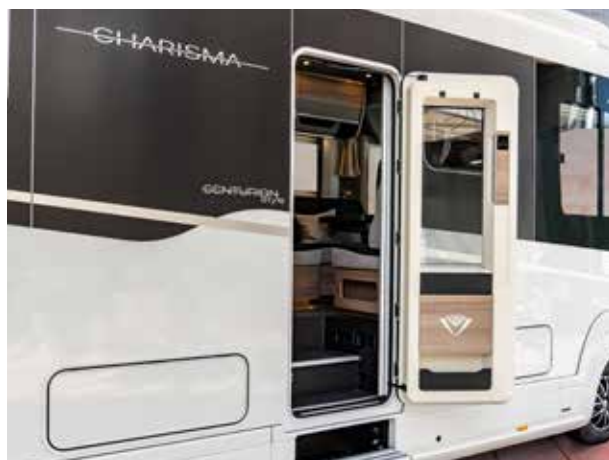
AUFBAUTÜR „DIAMOND GLANCE“ MIT ECHTGLAS EXTERIEUR

Die neue „Diamond Glance“-Eingangstür mit Echtglas sowie die Spurverbreiterung an Vorder- und Hinterachse unterstreichen den exklusiven Charakter der Graphite Edition, verleihen ihr noch mehr Präsenz auf der Straße und positionieren die Charisma-Modelle klar in der Oberklasse.