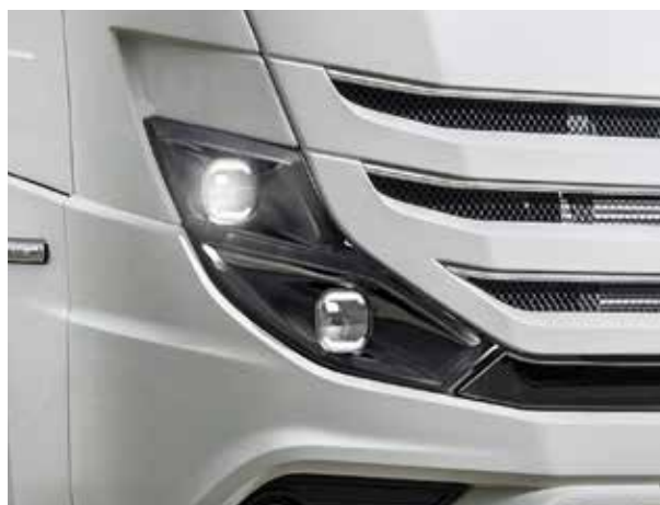
SHADOW LINE LED HAUPTSCHEINWERFER UND IM STOSSFÄNGER INTEGRIERTE LED-NEBELSCHEINWERFER