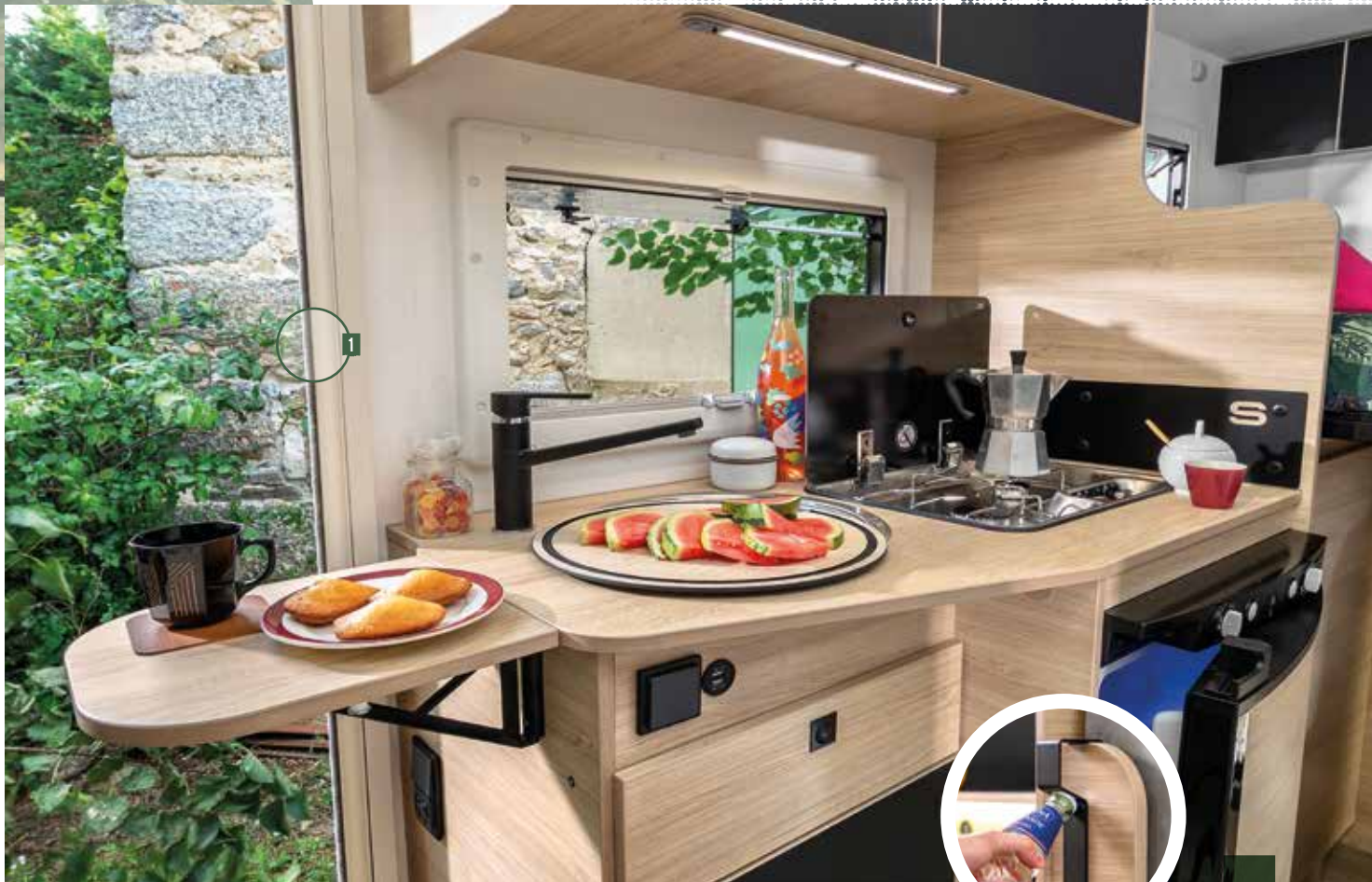
1 Moustiquaire de porte