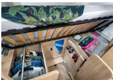
Lit relevable « papillon » pour accéder aux rangements ou augmenter le volume de son garage