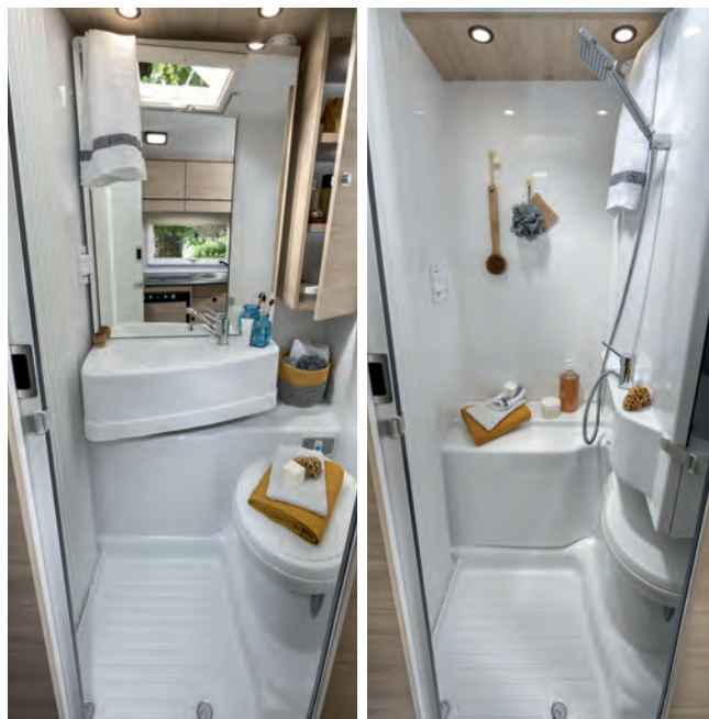
Nouvelle salle d'eau à cloison pivotante.