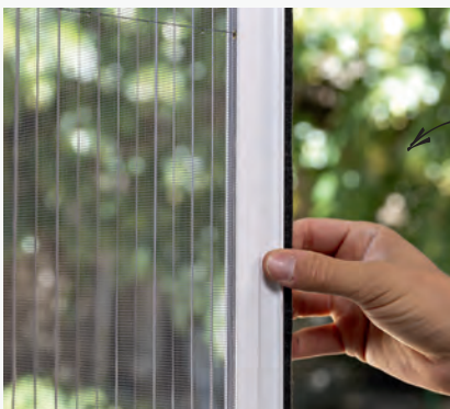
Moustiquaire de porte