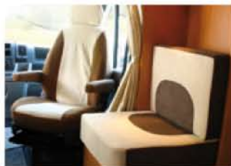
Housses de siège cabine