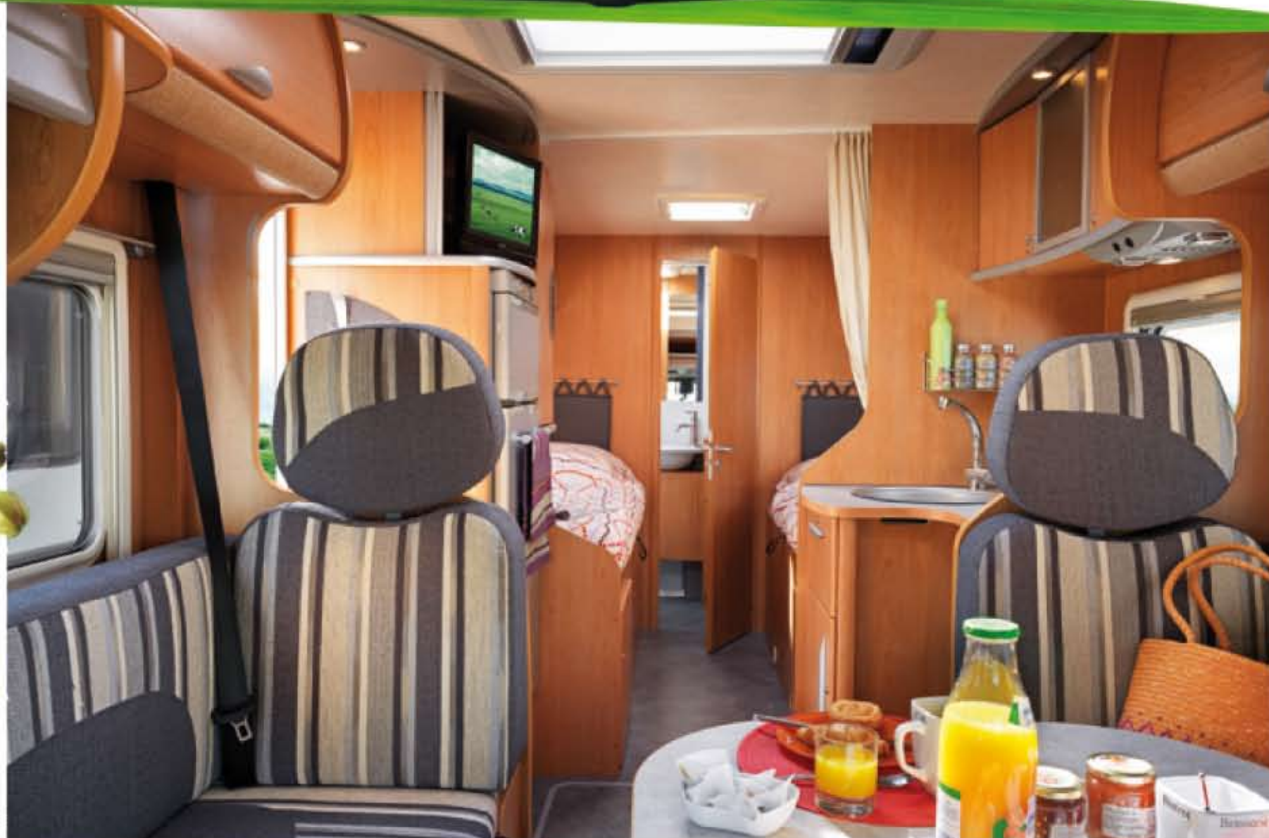
T730GTI Le luxe d'une chambre arrière avec lits indépendants et salle de bains transversale.

En offrant l'un des meilleurs niveaux de finition du marché, les trois Profilés Bavaria sur base Renault traduisent parfaitement l'exigence. La technologie Double Plancher Service est là pour en témoigner parmi d'autres points forts à découvrir ici.