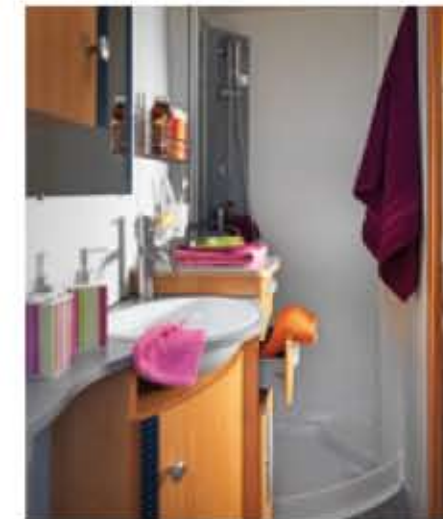
Nouveau cabinet de toilette transversal du T730GF.

En offrant l'un des meilleurs niveaux de finition du marché, les trois Profilés Bavaria sur base Renault traduisent parfaitement l'exigence. La technologie Double Plancher Service est là pour en témoigner parmi d'autres points forts à découvrir ici.