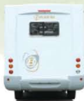
La carrosserie BAVARIA 2008 révèle la vraie nature et le degré d'exigences de la marque.

le Double Plancher Rangement sur les Intégraux sur châssis AL-KO vous permet de développer les espaces de rangement sans pénaliser l'espace de vie.