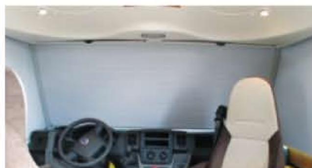
Rideau occultant isolant plissé