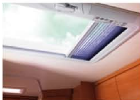
Toit ouvrant Heki 3