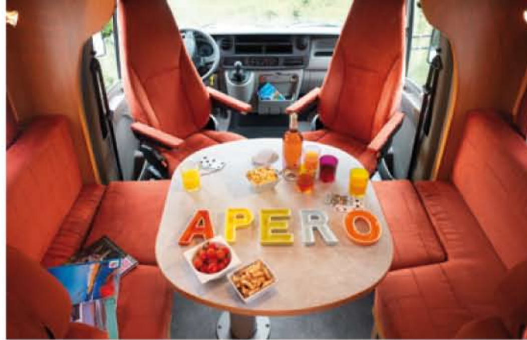
Confort du salon face/face avec deux ceintures de sécurité 3 points face route permettant l'obtention de 4 places carte grise.