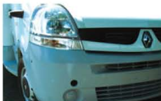
Pare-chocs avant gris