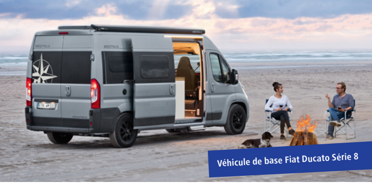
Véhicule de base Fiat Ducato Série 8