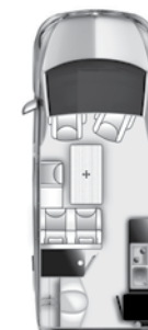
Kepler One Volkswagen Transporter