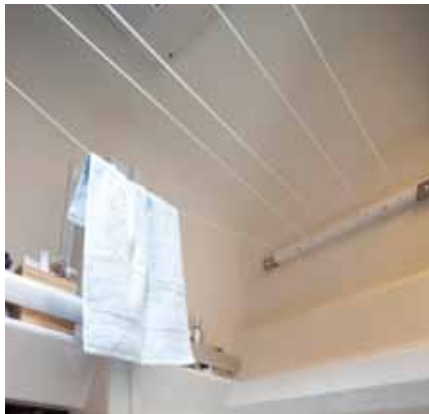
◀ ▼ Une conception simple mais réfléchie - les espaces de rangement dans le modèle Sven Hedin.