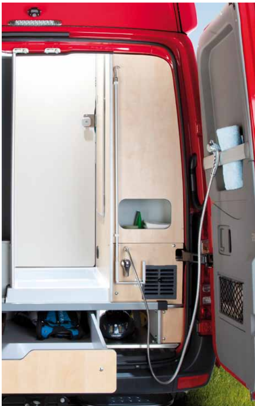
▲ Que ce soit la douche extérieure ou les tiroirs XXL – même l'arrière du modèle Sven Hedin propose des solutions de détail convaincantes.