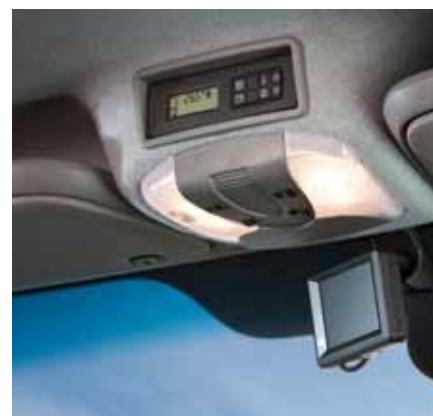
▲ Tout en une seule main – le panneau de commande pour l'électronique à bord du modèle Sven Hedin.