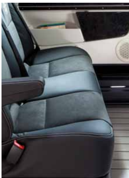
◀ Le signe d'un bon goût – le choix exclusif des matériaux est parfaitement assorti.