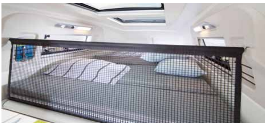
▲ Bien conçu jusqu'au moindre détail – le filet de sécurité du lit mezzanine.