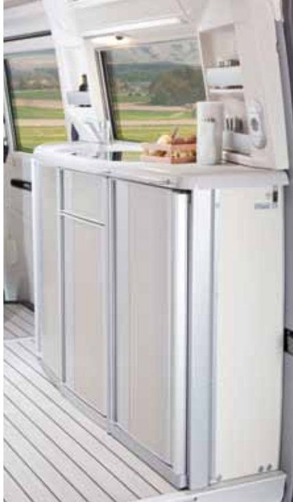
◀ Une combinaison épatante entre fonction et design – le bloc cuisine dans le modèle James Cook.