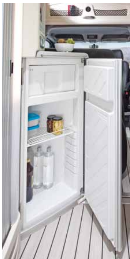
▲ Il n'y a pas de meilleure place: le frigo du modèle James Cook est facilement accessible aussi bien par la cuisine que par le séjour.