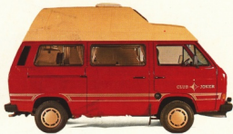
Club Joker 3

Bequemes Auto für Geschäftsreisen. Attraktiver Gästebus für Hotels und Ferienpensionen. Exklusives Wohnmobil. Mit Original Westfalia Aufstelldach und integrierter Dachgepäckwanne vorn.