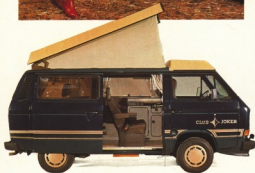
Club Joker 1

Bequemes Auto für Geschäftsreisen. Attraktiver Gästebus für Hotels und Ferienpensionen. Exklusives Wohnmobil. Mit Original Westfalia Aufstelldach und integrierter Dachgepäckwanne vorn.