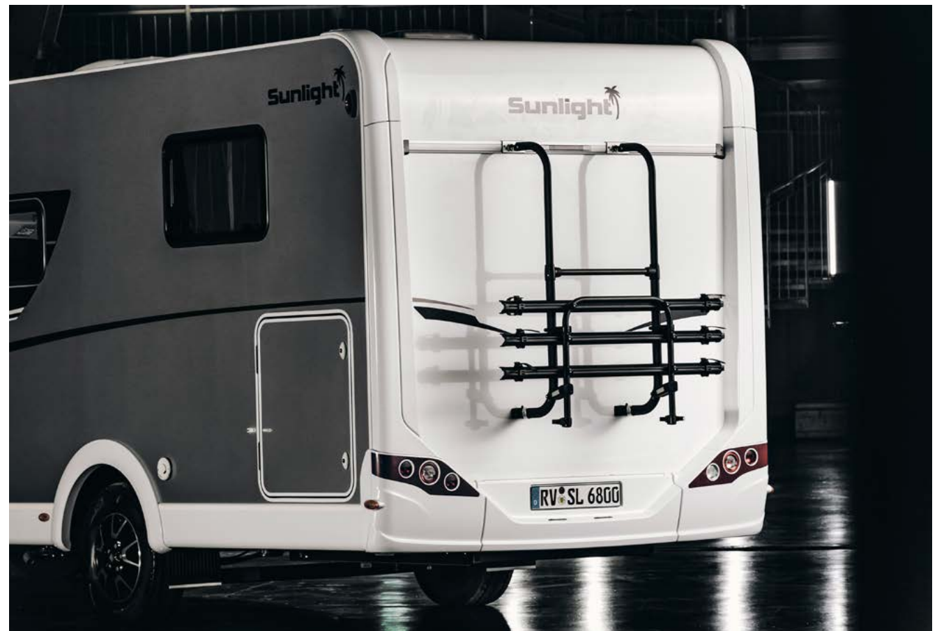
PARE-CHOCS ARRIERE AVEC PARTIES THERMOFORMÉES MONTANTES, PORTE-VÉLOS NOIR

Nous célébrons notre 15 ème anniversaire à notre manière : avec un véhicule qui est à la fois marquant, discret, moderne et classique. Le résultat est impressionnant : l'Édition XV est élégante dans son apparence, mûrement réfléchie dans la conception et de haute qualité jusque dans les moindres détails.