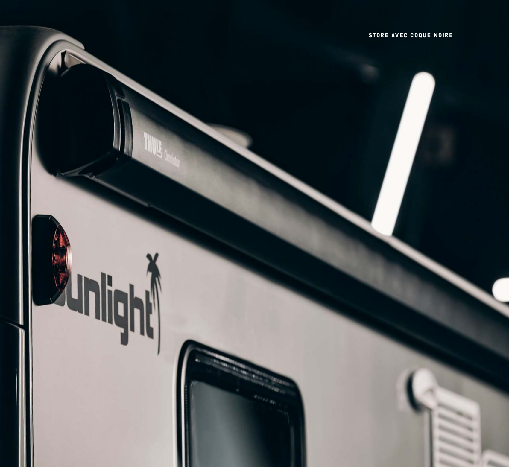
STORE AVEC COQUE NOIRE

TOUT EN UN : NOTRE MODÈLE ÉDITION XV INCARNE TOUT NOTRE SAVOIR-FAIRE QUE NOUS AVONS ACCUMULÉ AU COURS DES 15 ANNÉES PASSÉES. 15 ANNEES DURANT LESQUELLES NOUS AVONS DÉVELOPPÉ ET CONSTRUIT DES CAMPING-CARS DE QUALITE POUR DES VOYAGEURS EXIGEANTS ET AVENTUREUX.