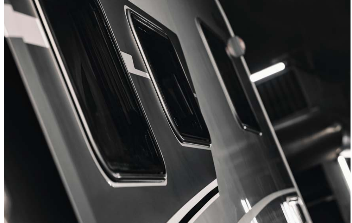
BAIES À CADRE ET TÔLES LATÉRALES GRIS MÉTALLISÉ