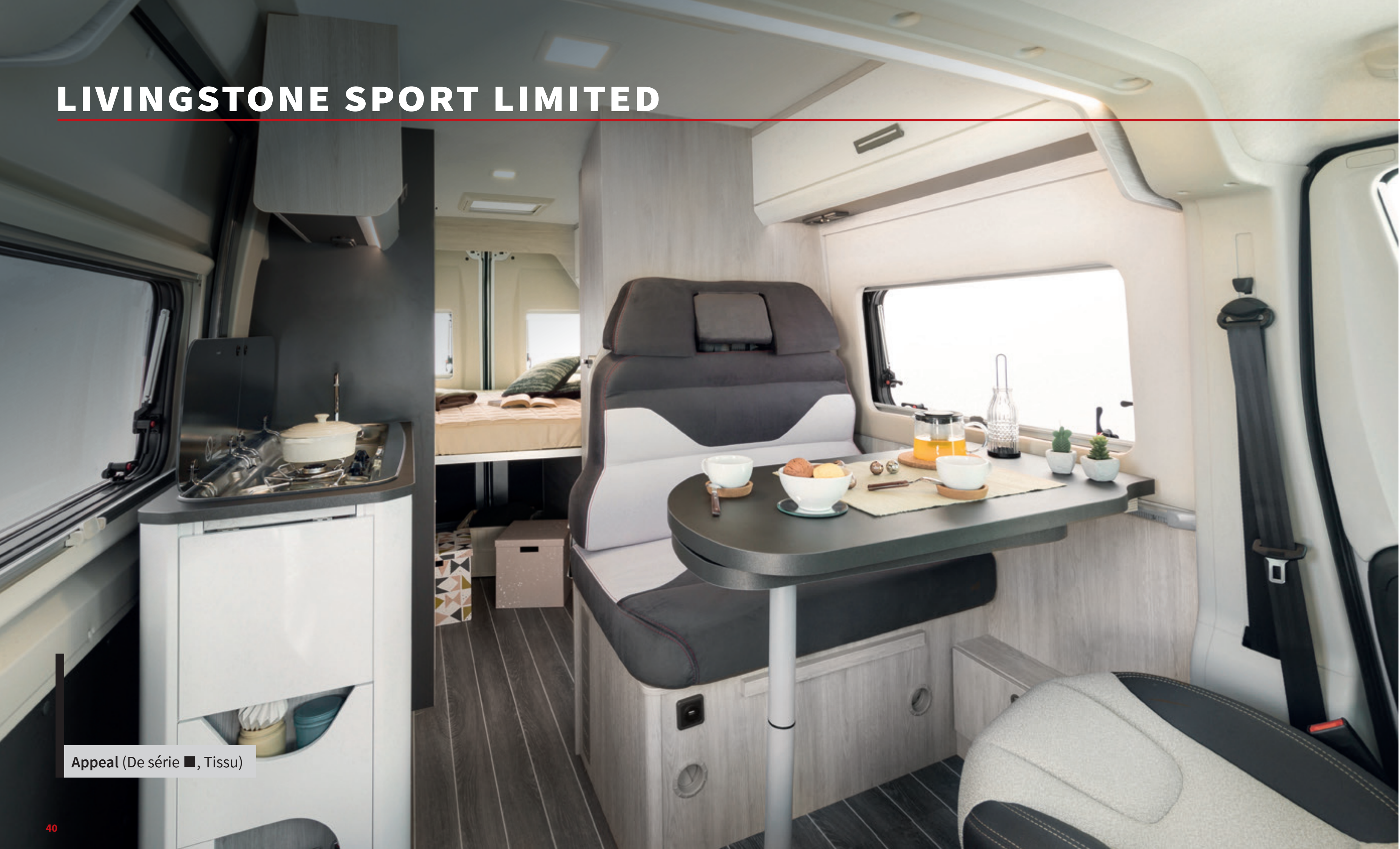
Appeal (De série ■, Tissu)