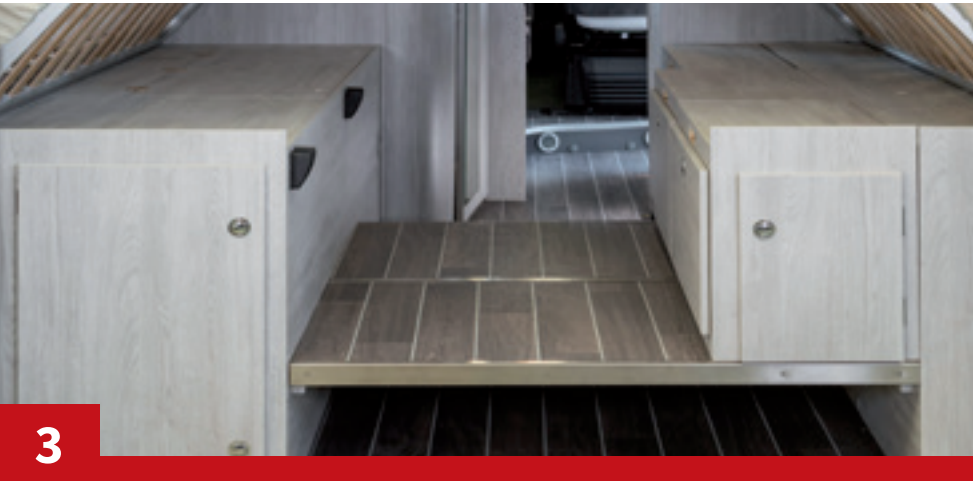
Double plancher amovible et à volume modulable