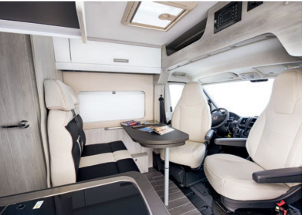
Laren (En option □, Simili-cuir)