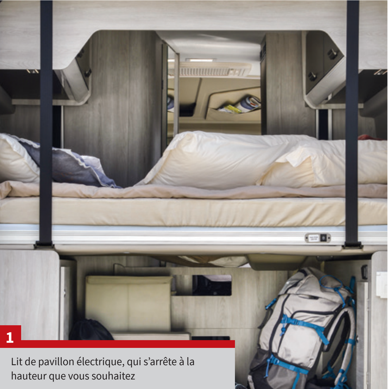
Lit de pavillon électrique, qui s'arrête à la hauteur que vous souhaitez

Garage modulable pour un chargement extra large 2 400 litres de volume de chargement, pour vous permettre de ranger tous vos équipements de sport.