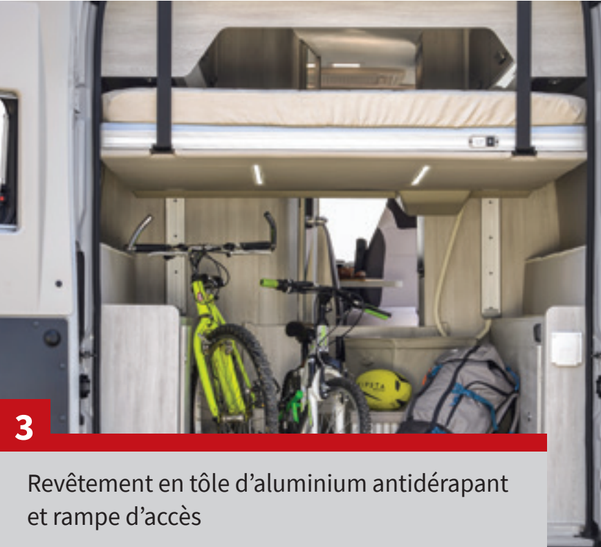
Revêtement en tôle d'aluminium antidérapant et rampe d'accès

Tous les sommiers de la gamme de fourgons sont relevables et/ou amovibles, partiellement ou entièrement, pour répondre à vos besoins de rangement, même les plus encombrants.