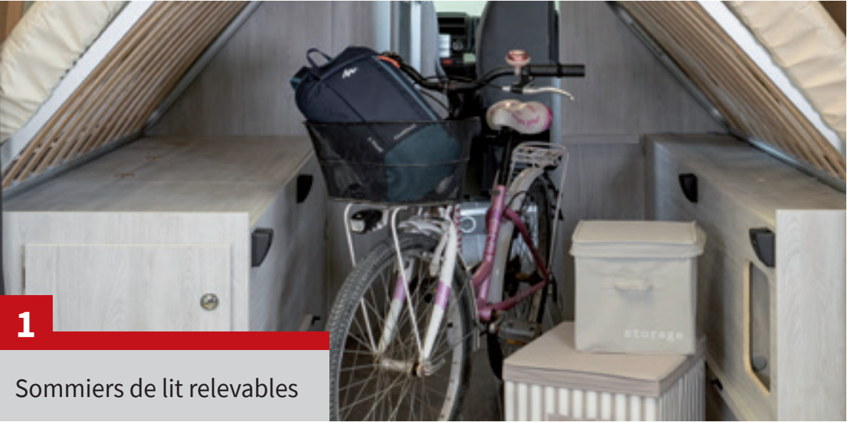
Sommiers de lit relevables