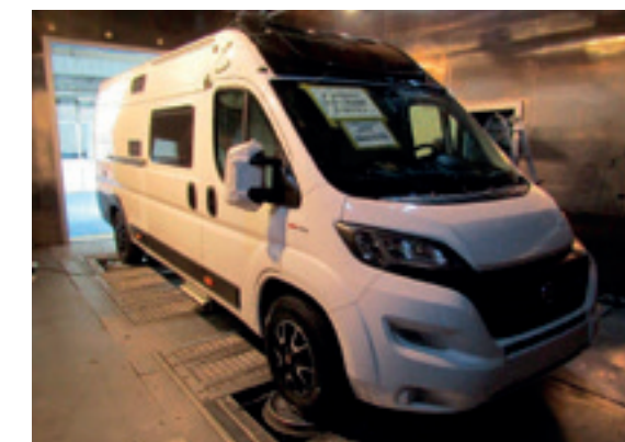
Véhicule en chambre climatique

Disponible sur la gamme Livingstone Sport.