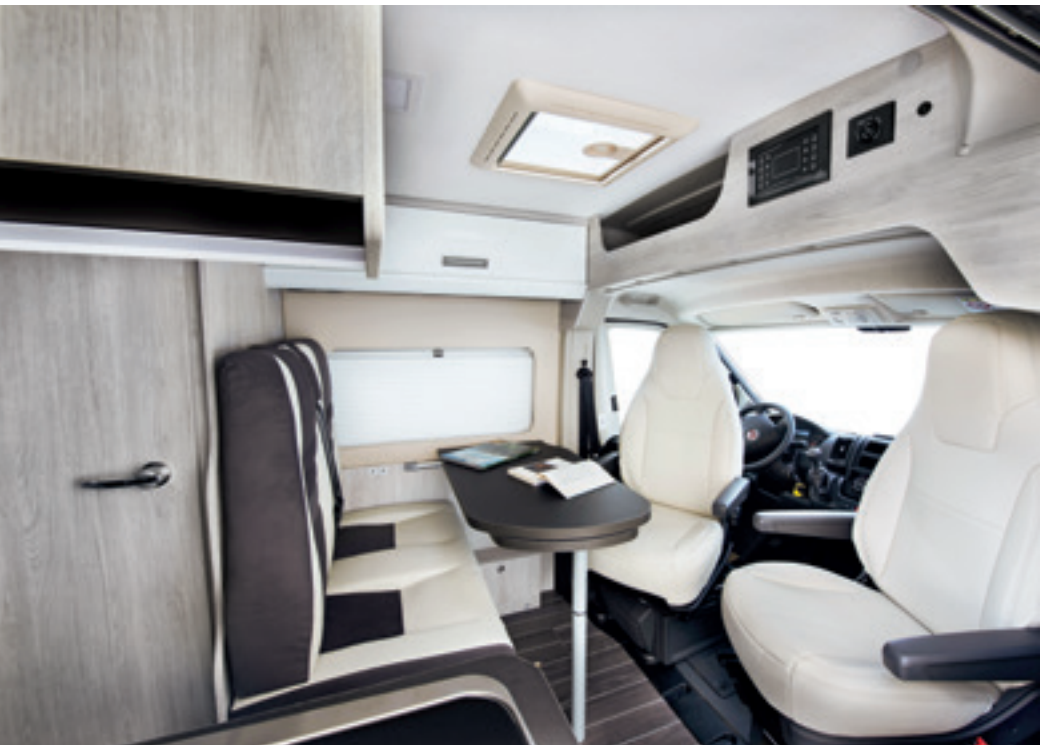
Martyn (En option □, Tissu/Simili-cuir)