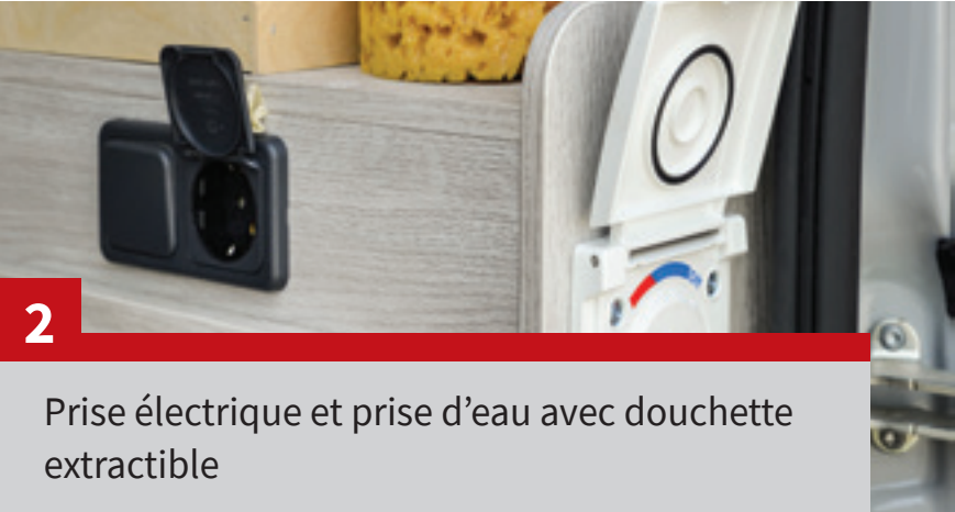
Prise électrique et prise d'eau avec douchette extractible