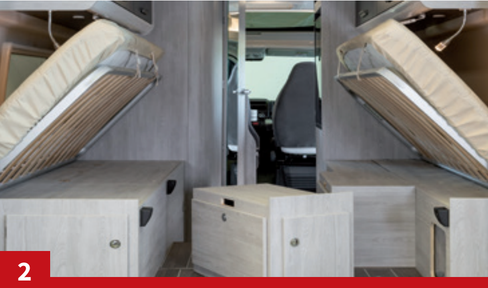
Trois armoires amovibles de façon séparée

Le super flexible. Des combinaisons gagnantes à tous les coups. La modularité de la partie arrière s'adapte à vos besoins.