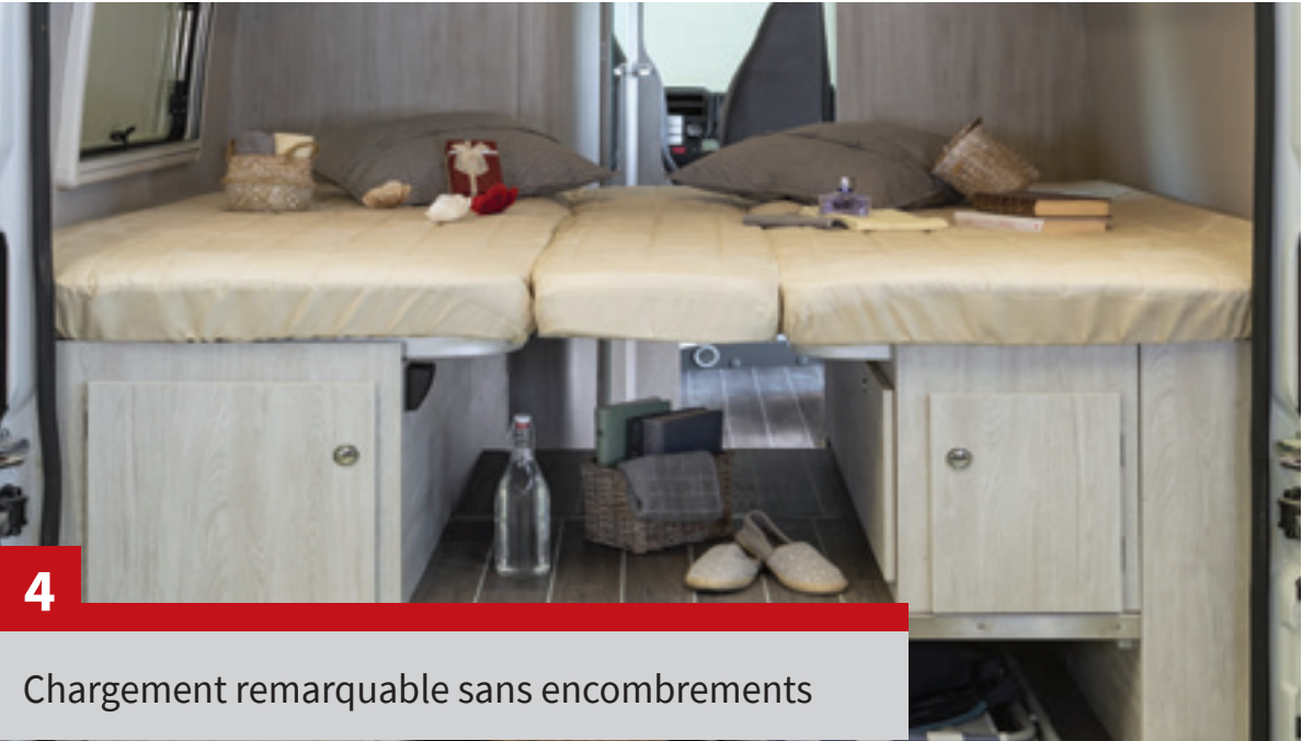
Chargement remarquable sans encombrements