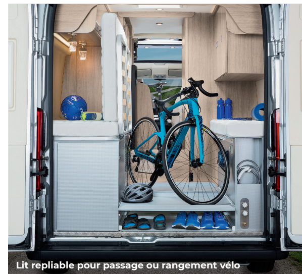
Lit repliable pour passage ou rangement vélo