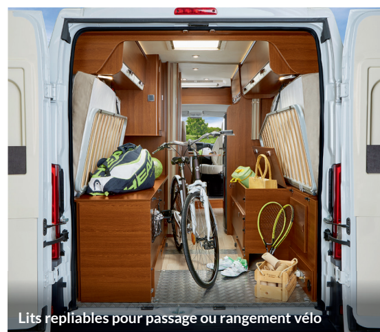
Lits repliables pour passage ou rangement vélo

Grande modularité des rangements arrière.