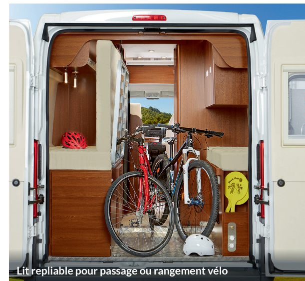
Lit repliable pour passage ou rangement vélo