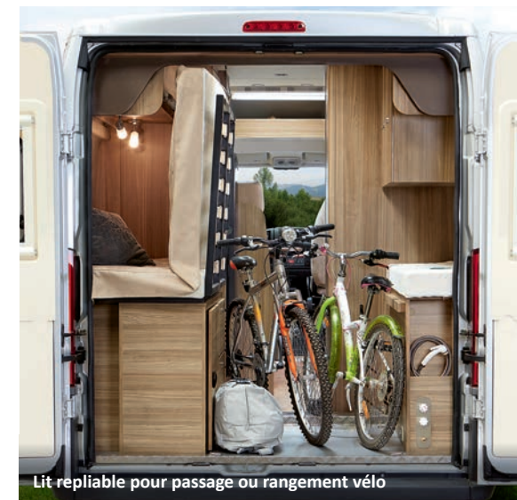
Lit repliable pour passage ou rangement vélo