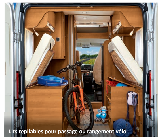
Lits repliables pour passage ou rangement vélo