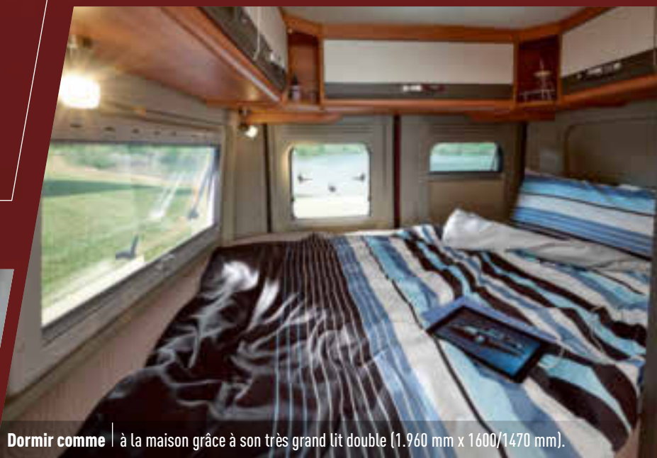
Dormir comme | à la maison grâce à son très grand lit double (1.960 mm x 1600/1470 mm).