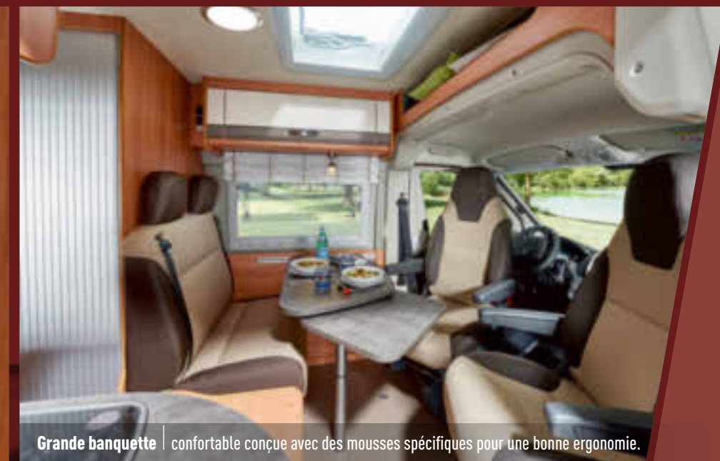
Grande banquette | confortable conçue avec des mousses spécifiques pour une bonne ergonomie.