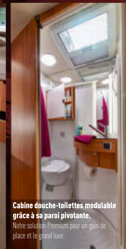
Cabine douche-toilettes modulable grâce à sa paroi pivotante.

Les placards et tiroirs permettent de ranger tous les ustensiles de cuisine.