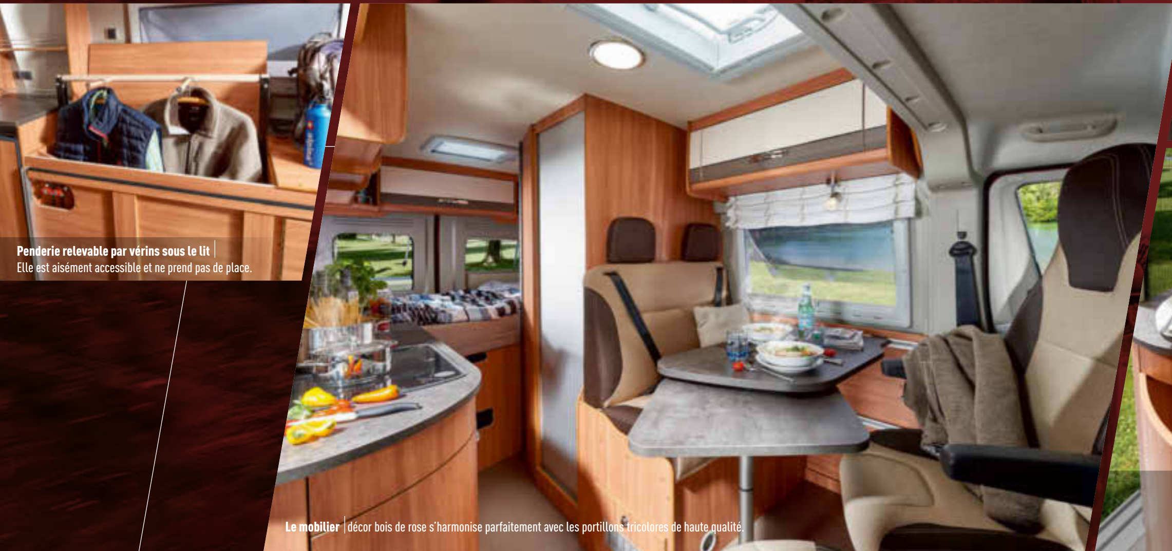
Penderie relevable par vérins sous le lit Elle est aisément accessible et ne prend pas de place.

Le Summit 600 Plus brille par ses nobles attributs, déjà connus dans la gamme H-Line de Pössl. Son équipement complet digne d'une gamme Premium est combiné à un prix défiant toute concurrence.