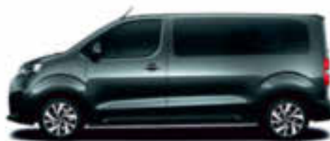
Gris Platiniium métallisé