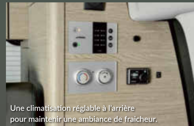
Une climatisation réglable à l'arrière pour maintenir une ambiance de fraîcheur.