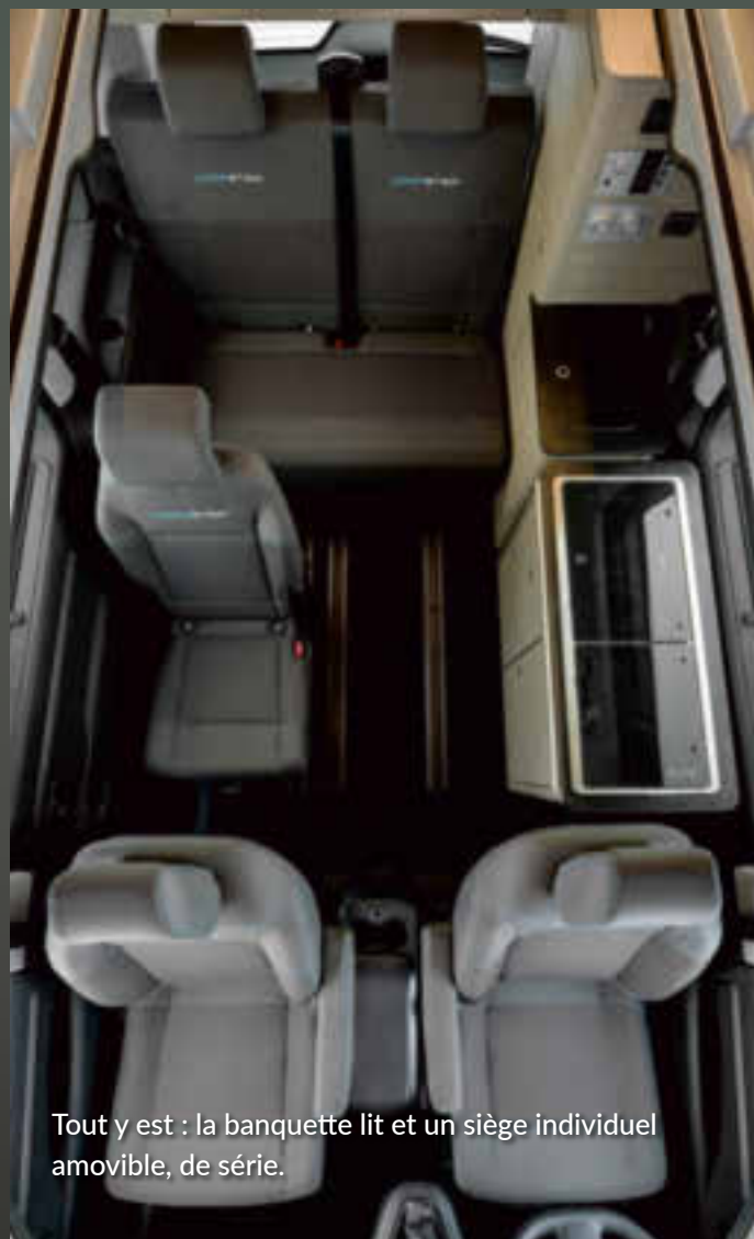
Tout y est : la banquette lit et un siège individuel amovible, de série.