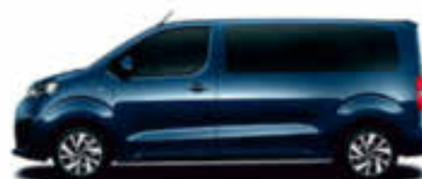
Bleu Impérial opaque (série)