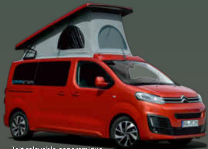
Toit relevable panoramique pour un sommeil au plus près des étoiles.

LE NOUVEAU CAMPSTER EST LE VÉHICULE POUR TOUS LES USAGES.