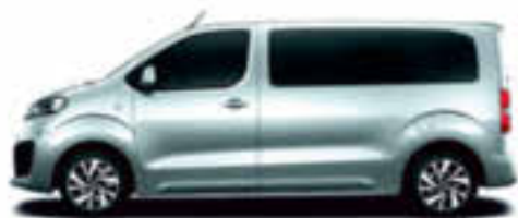
Gris Aluminium métallisé