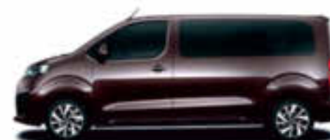
Brun Rich Oak nacré