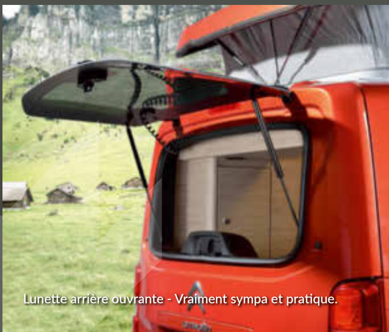
Lunette arrière ouvrante - Vraiment sympa et pratique.