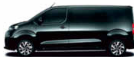
Noir Onyx opaque