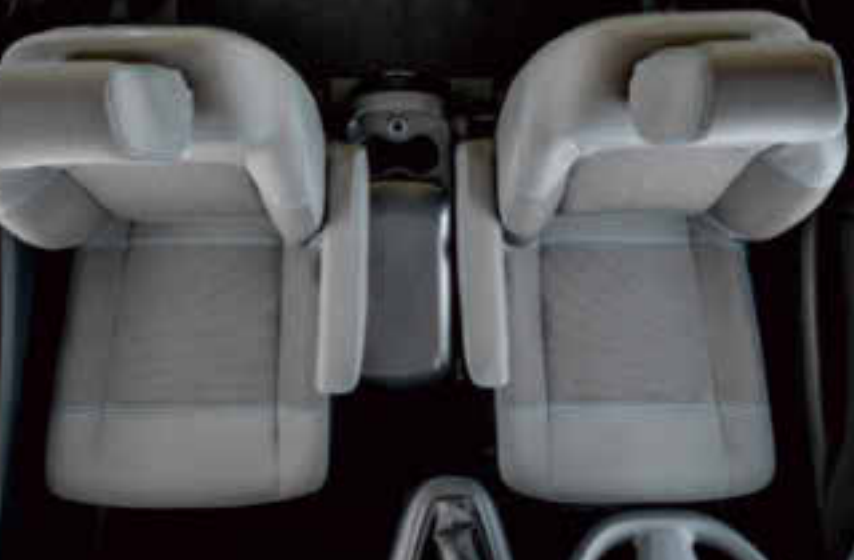
Option avec 7 places

► Etre matinal au bureau pour pouvoir partir plus tôt en week-end. Voilà pourquoi le Campster est votre compagnon idéal. Spacieux, fonctionnel et polyvalent. Adaptez ainsi votre véhicule à votre style de vie et non l'inverse.