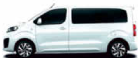
Blanc Banquise opaque (série)

Jante en alliage Citroën 17"-CURVE (option)