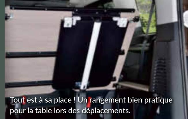
Tout est à sa place ! Un rangement bien pratique pour la table lors des déplacements.

GRÂCE À SES NOMBREUX ÉQUIPEMENTS DE SÉRIE, IL EST PRÊT POUR DE PETITES ESCAPADES OU DE GRANDS VOYAGES.