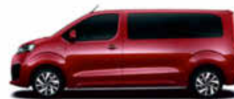
Orange Tourmaline nacré