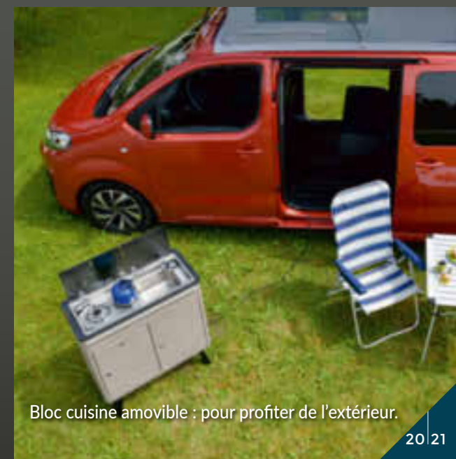
Bloc cuisine amovible : pour profiter de l'extérieur.