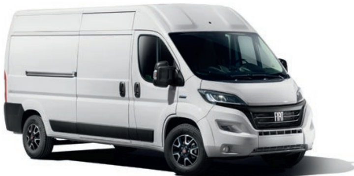
BLANC DE SÉRIE