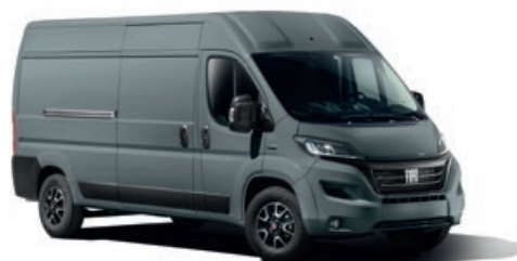
GRIS LANZAROTE OPTION