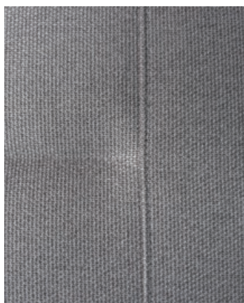
COTTAGE Tissu de série