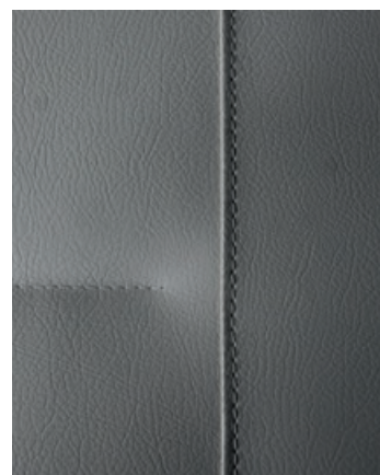
NOIR Simili cuir (incluse dans le pack Premium)