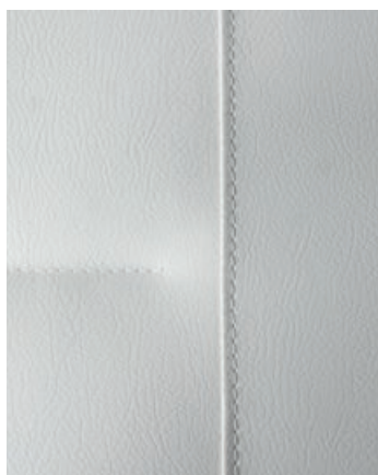
CLAY Simili cuir (Option)