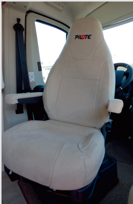
Housses de sièges cabine