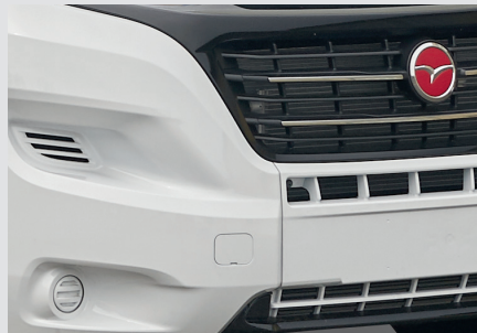
Pare-chocs avant peint (couleur carrosserie)