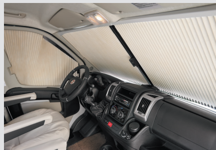
Occultations cabine coulissantes frontale et latérales