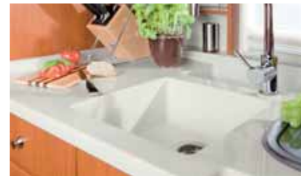
Surface blanche 9016

Le plan de travail de la cuisine revêtu en série d'une matière minérale grande qualité. Il est extrêmement résistant et formé en un seul bloc, sans joint ni arêtes, d'où son confort et sa facilité de nettoyage. Le plan de travail de la cuisine et de la table du salon peuvent être harmonisés en termes de couleurs.