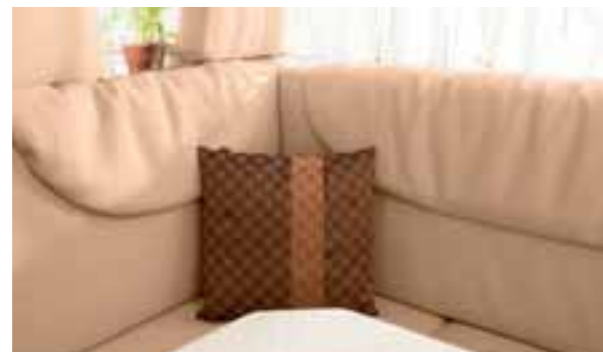
Coussin Denver 146