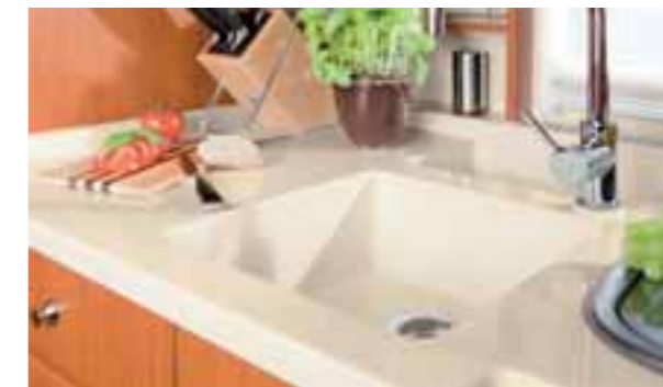
Surface beige 9001