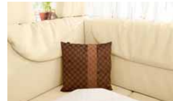
Cuir Crema 3588