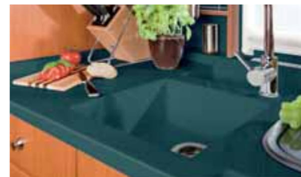
Surface verte 635