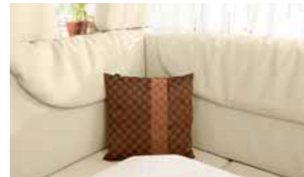
Cuir crème 3819

Cuir de vachette doux et résistant avec une structure de surface élégante. Tanné de façon écologique et entièrement teinté selon un procédé complexe. La surface résiste à la saleté et peut être facilement nettoyée avec un tissu humide au besoin. Coussin de qualité en structure multicouche.