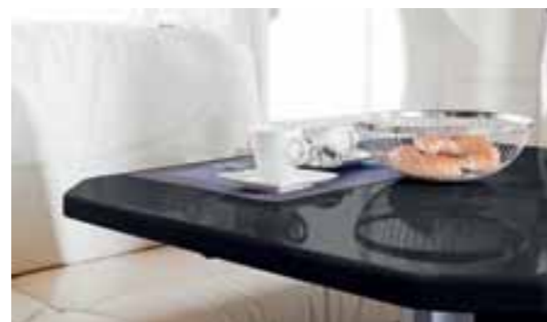
Surface noire 420