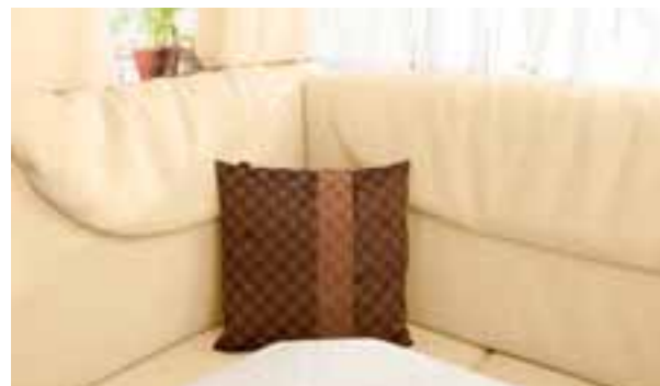
Coussin Denver 149