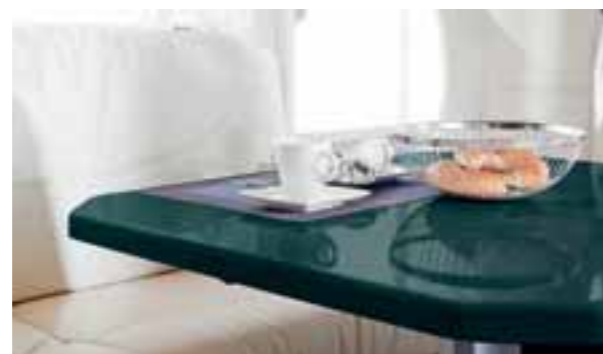
Surface verte 635