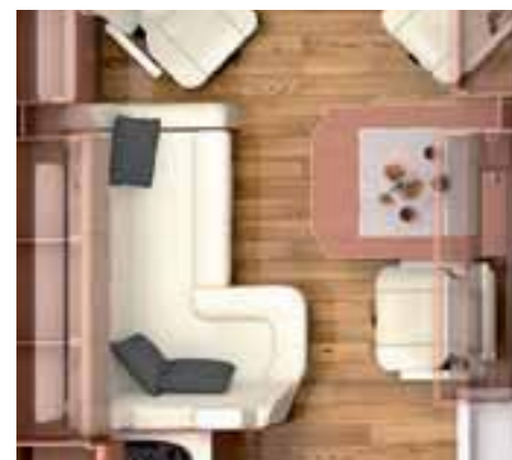
ÉQUIPEMENTS EN OPTION SALON BAR

Les conducteurs de camping-car sont des individualistes. Les camping-cars MORELO le sont aussi. Confort inimitable, technique excellente, qualité supérieure et look de choix caractérisent tous les modèles. Sans oublier les options variées telles que le salon bar ou la salle de bain Premium qui confèrent au Palace sa singularité. Neuf modèles de base Palace, multipliés par les possibilités des équipements optionnels : La variété du luxe pour les individualistes. Vous avez le choix.