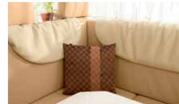
Cuir Bicolor Crema 3588 · Naturel 2813