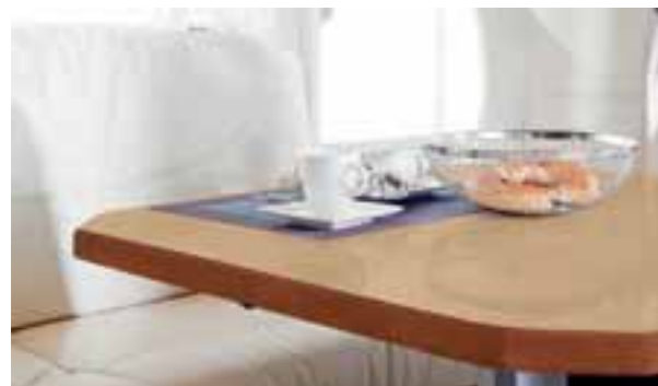
Surface bois clair 0001

La table du salon possède un cadre en bois massif avec une surface en stratifié résistante aux coups et aux rayures disponible en deux coloris au choix. La table est disponible en équipement spécial avec une surface en matière minérale façon pierre en quatre différents coloris.