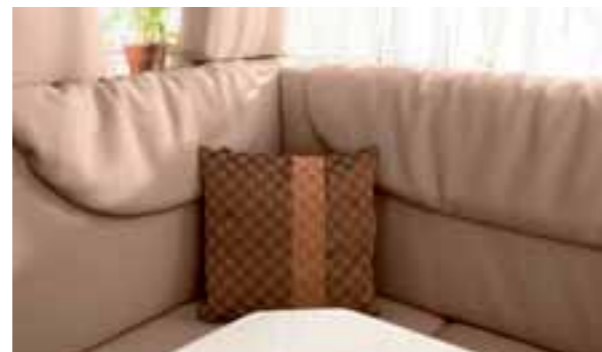
Coussin Denver 169