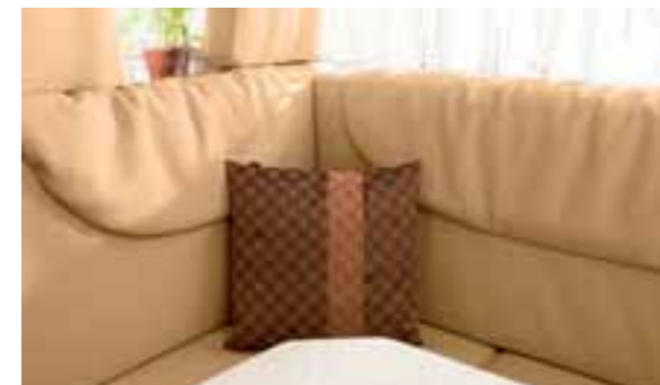
Cuir naturel 2813