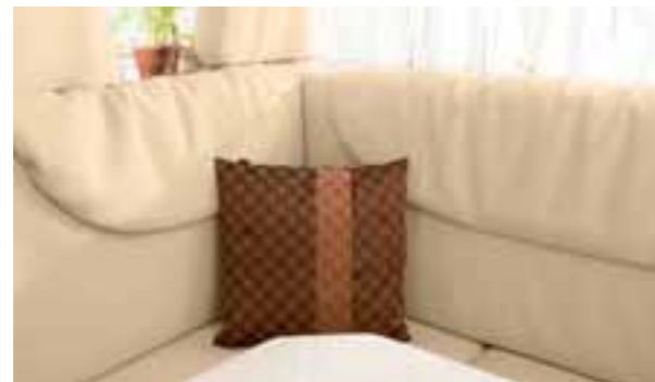
Coussin Denver 102