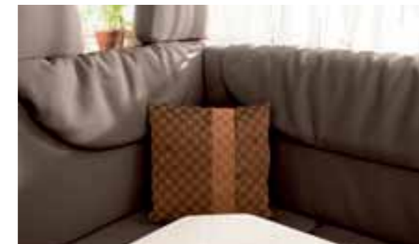
Cuir café 2262