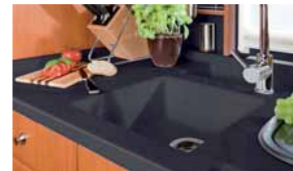
Surface noire 420