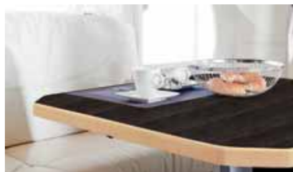
Surface bois foncé 0002