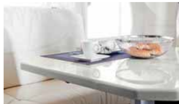
Surface blanche 9016