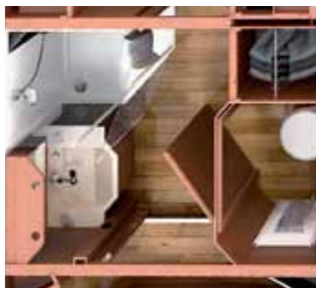
ÉQUIPEMENTS EN OPTION SALLE DE BAIN LUXE