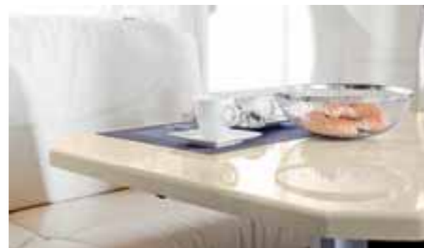
Surface beige 9001