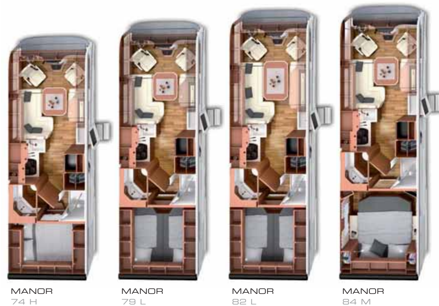
MANOR 74 H

Nous vous épargnerions volontiers l'embarras du choix lors de la sélection de votre camping-car Manor. D'un autre côté, avoir la possibilité de choisir entre quatre variantes d'un même modèle, est un luxe appréciable, non ? À cela s'ajoute la grande variété des équipements spéciaux grâce auxquels vous pouvez customiser votre camping-car Manor. Vous disposez ainsi d'un camping-car véritablement unique, adapté à toutes vos exigences et attentes en matière de confort, de fonctionnalités et d'équipement de luxe. Ainsi, l'embarras du choix est un vrai plaisir.