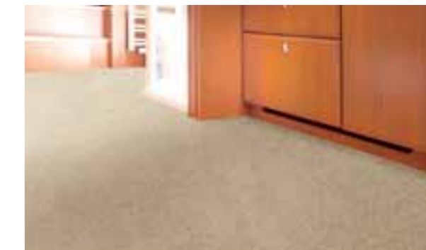
Moquette sable 001

Les moquettes en options sont disponibles en deux coloris. Leur surface satisfait aux exigences extrêmes en matière de résistance.