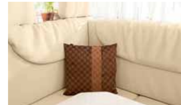
Cuir Crema beige 3753