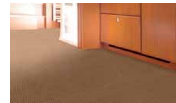
Moquette Sisal 002