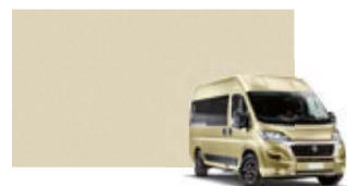
506 Blanc doré