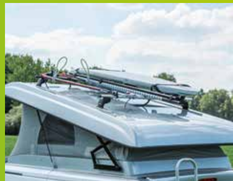
Planche de surf, kayak ou bateau pneumatique – ce qui ne rentre plus à l'intérieur trouve place sur la galerie. (Art. en fonction du modèle)

L'ouverture des deux portes arrière est également possible lorsque des vélos sont chargés sur le porte-vélos arrière Atera fixé sur l'attelage. (N° d'art. 2497197)