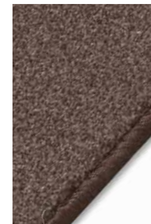
Moquette « Roma »