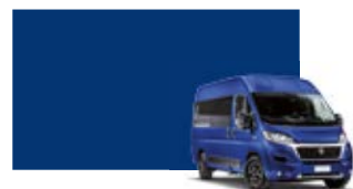
479 Bleu line