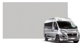
611 Gris alumino