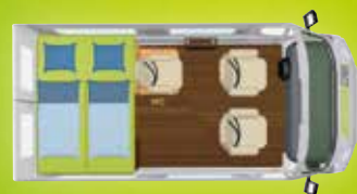
Véhicules : 4,96 × 2,05 m / 3 000 – 3 500 kg Variante d'implantation : lit arrière Sydney

L'HYMERCAR Sydney vous offre encore plus de flexibilité, avec encore plus de place. Il convainc non seulement par sa hauteur sous plafond (jusqu'à 2,65 mètres), mais aussi par ses dimensions compactes dignes d'une voiture particulière. En ville comme en voyage, le Sydney est un compagnon fiable et confortable. L'espace de rangement de conception judicieuse permet de plus d'emporter skis, vélos et planches de surf. Il en est de même pour le modèle Sydney Drive avec encore plus de possibilités de rangement à l'arrière – le véhicule idéal pour les voyages et le transport de tous types d'objets.