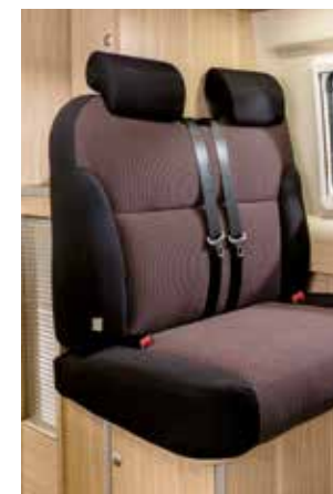
Tissu « Turin »