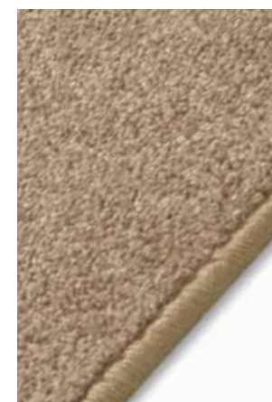
Moquette « Samara »