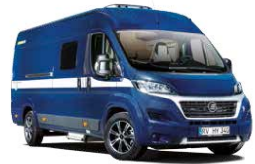
Décor autocollant « Aluline »