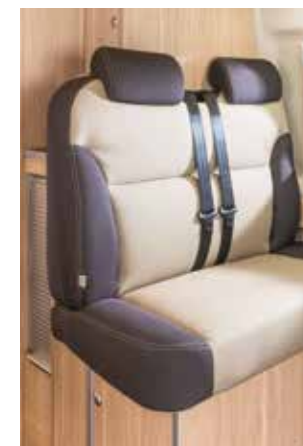
Tissu « Castano »