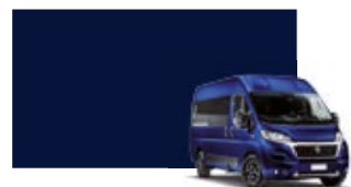
455 Bleu impérial