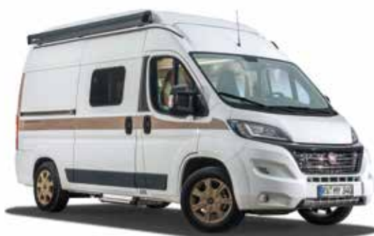
Décor autocollant « Woodline »