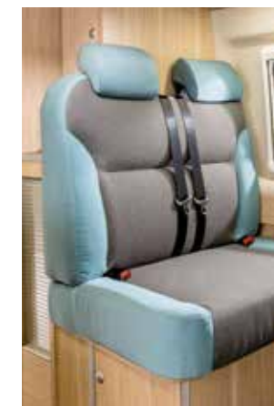
Tissu « Salinas »