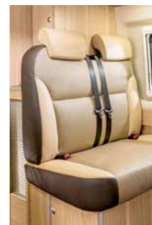
Design de tissu « Nobile » (cuir partiel)