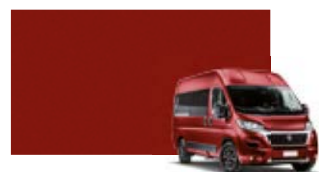
255 Rouge profondo