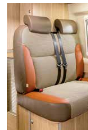
Design de tissu « Athletico » (cuir partiel)