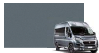
691 Gris fer