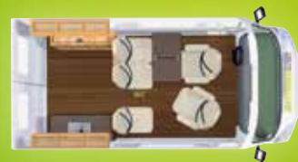
Variante d'implantation : Sydney Drive