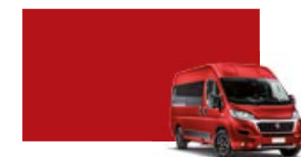
199 Rouge Tiziano