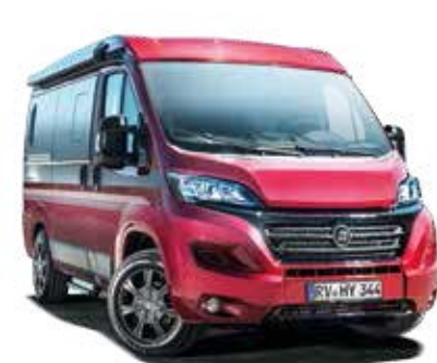
Décor autocollant « Carbonline »