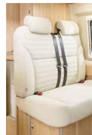
Tissu « Garbo »