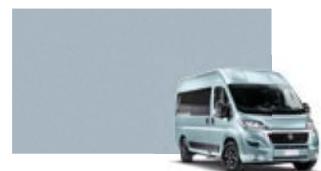
453 Bleu lagon