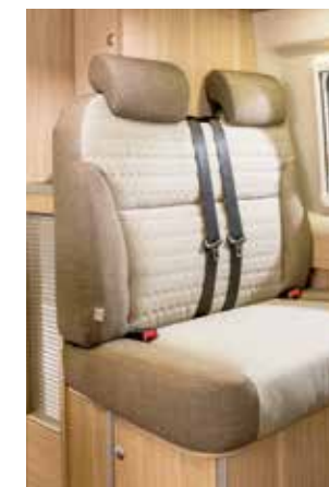
Tissu « Albero »