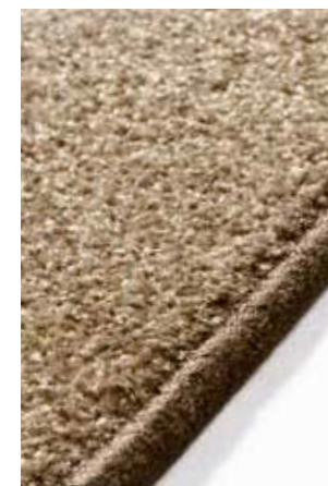
Moquette « Havanna »