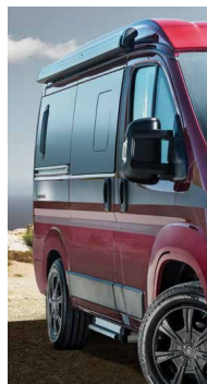
Séigraphie design « Carbonline »

Modèles : Sydney, Rio, Grand Canyon, Yellowstone et Sierra Nevada