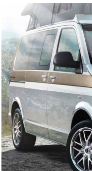
Séigraphie design « Woodline »