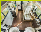
De série, en version 3 places avec siège individuel, accoudoirs inclus.