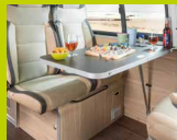
La table pliante s'utilise de différentes façons. Il suffit d'un « tour de main » : petite table d'une surface de 50 x 45,5 cm ou de grande table avec 50 x 88 cm. Si vous n'en avez pas besoin, rabotez-la simplement contre la paroi.