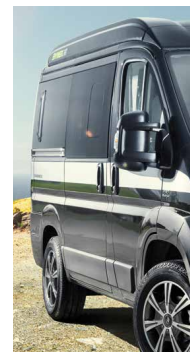
Séigraphie design « Aluline »