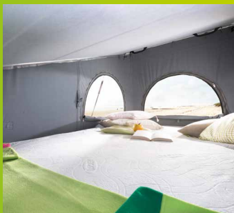
Un sommeil reposant dans le lit de toit – panorama splendide inclus.

L'HYMERCAR Cape Town dispose de suffisamment de couchages pour permettre à quatre personnes de se reposer confortablement. Grâce au toit relevable avec lit de pavillon intégré, le Cape Town offre deux espaces séparés, ce qui est particulièrement avantageux lorsque les habitudes de sommeil sont différentes. Il offre de plus, dans la zone inférieure, une hauteur sous plafond de 1,80 à 2,40 mètres.