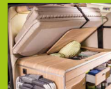
Les compartiments de rangement dans la structure du lit peuvent aussi être utilisés en combinaison avec des matelas.