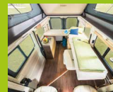
Grâce à l'insertion axiale d'un étrier de support au-dessous de la table rabattue, un lit longitudinal d'une longueur de 2,4 mètres peut être monté. Ainsi, HYMERCAR est une fois de plus le garant du confort de sommeil des personnes mesurant plus de deux mètres.