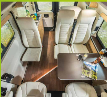
En version cinq places variable, avec siège conducteur et siège passager, banquette double et cinqième siège repliable.

Concept d'assise flexible : une modularité maximale sur un espace extrêmement réduit, grâce à la combinaison de solutions variables. Siège individuel ou banquette double, vous pouvez choisir en toute liberté. Jusqu'à cinq sièges auto à part entière offrent un excellent confort durant la conduite. Le siège individuel suspendu peut être retiré facilement si un espace de rangement supplémentaire est requis. Pour une modularité sans limite.