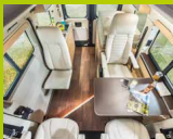
En version 4 places avec sièges individuels.