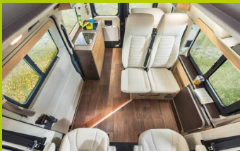
En version 4 places avec banquette double.