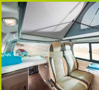
Le lit enfant de 1,67 x 1,30 mètres est également rapide à mettre en place.