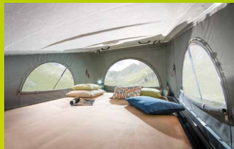
Secondes chambre : le toit relevable (en option sur le Rio) et intégré (2 x 1,35 mètres) permet de créer une chambre séparée, accessible à tout moment à l'aide d'une échelle. La zone est séparée visuellement par l'obstruction de l'accès vers le haut.