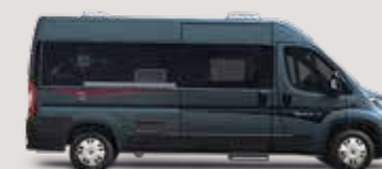
◦ Gris fer