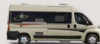
◦ Golden White