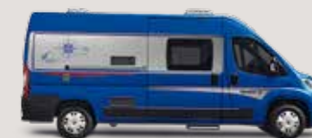
◦ Line Blue