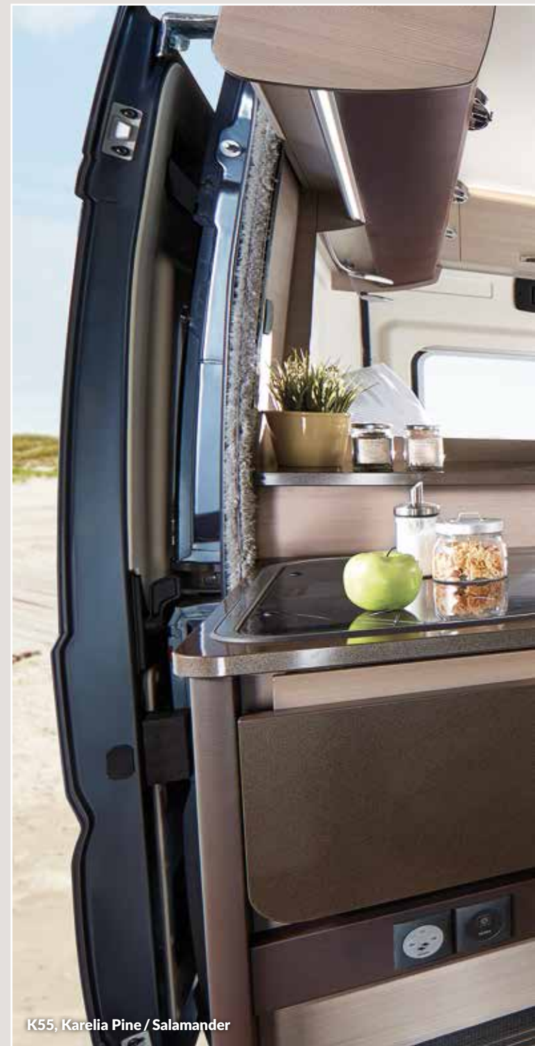
K55, Karelia Pine / Salamander

Le nouveau VANTANA représente une toute nouvelle catégorie parmi les camping-cars. Il est compact en ville et agile sur les routes de campagne étroites. C'est une vraie joie de le conduire et un véritable plaisir de l'habiter. Son design intérieur fixe de nouveaux critères dans le domaine du confort avec de nombreuses solutions étonnantes d'utilisation intelligente d'espace.