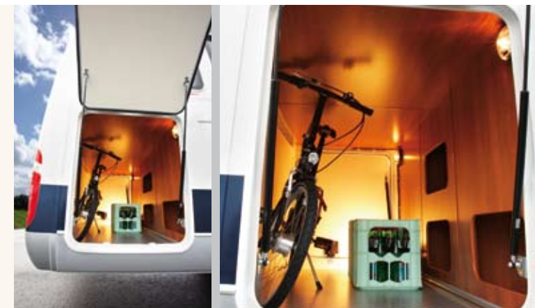
Mitte oben: Cockpit Mitte unten: Totale Rechts: Garage