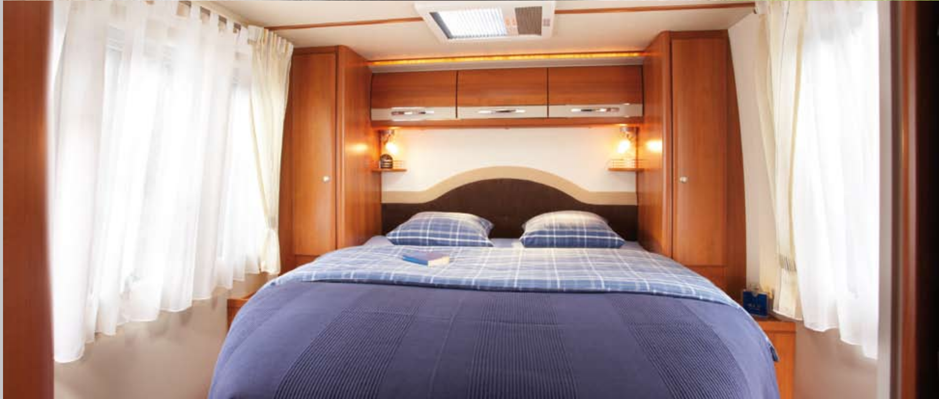
Oben: Außenansicht Unten: Queensbett