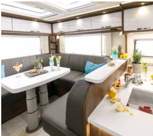
↑ Typique FRANKIA : se sentir à l'aise dans le grand coin salon !