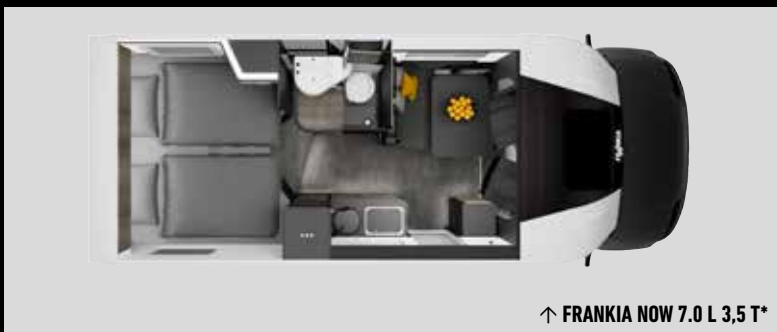
↑ FRANKIA NOW 7.0 L 3,5 T*