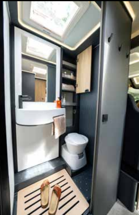
↑ Parfait pour se rafraîchir : la salle de bains variable