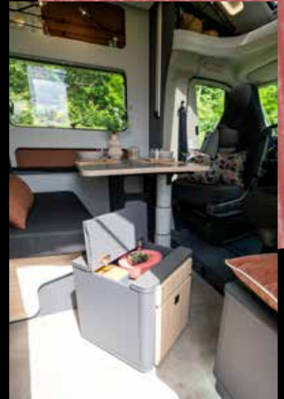
↑ Un accessoire intelligent : la box multifonctionnelle