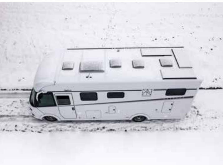
↑ Rester indépendant même en hiver – grâce à une technique exclusive