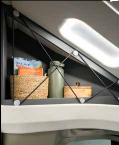
↑ WAOUH : chaque centimètre est bien pensé !