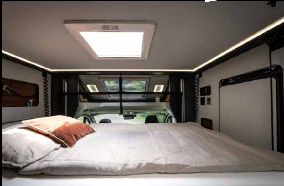
↑ Même le lit pavillon électrique en option au-dessus du coin salon est inondé de lumière.