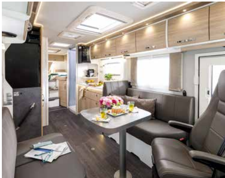
↑ La liberté avec un grand L : le nouveau FRANKIA TITAN GDW