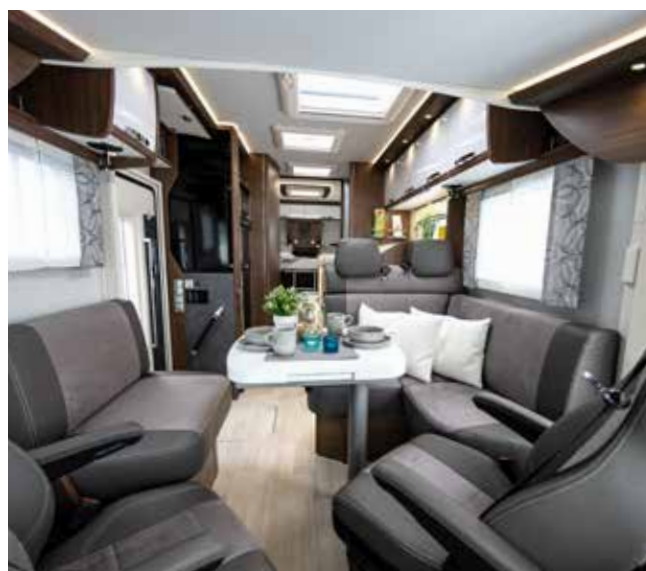
↑ Point fort de l'espace de vie : une sellerie exclusive en cuir et microfibrés