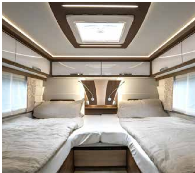
↑ Se détendre au max dans la chambre avec lits jumeaux