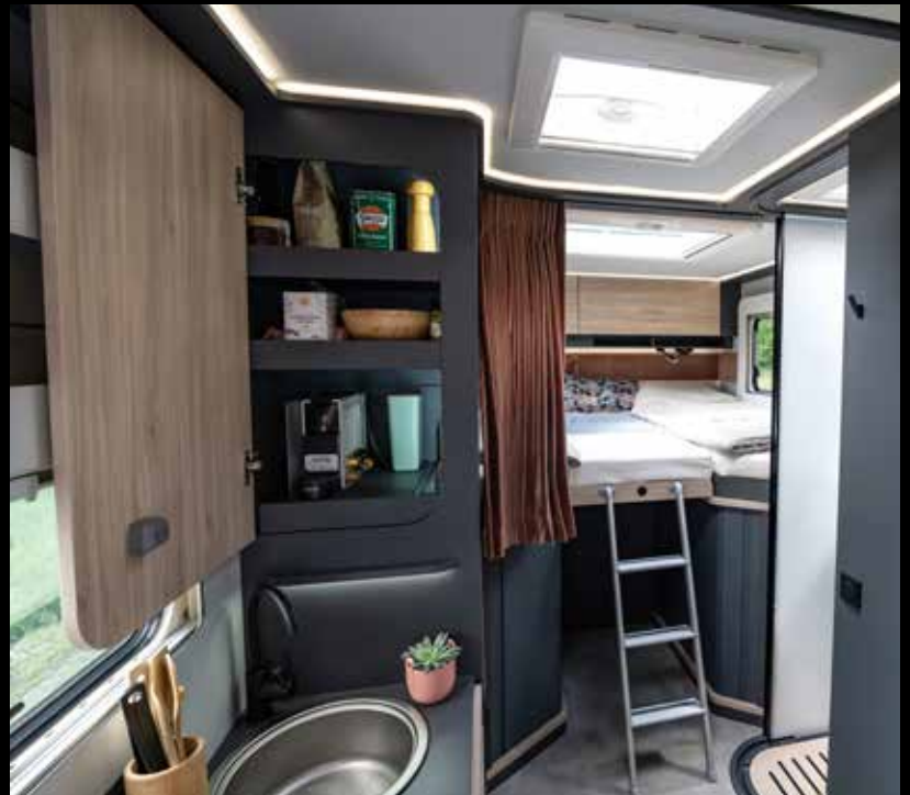
↑ La tour NOW à 3 côtés avec rangements accessibles depuis la cuisine ou le lit.