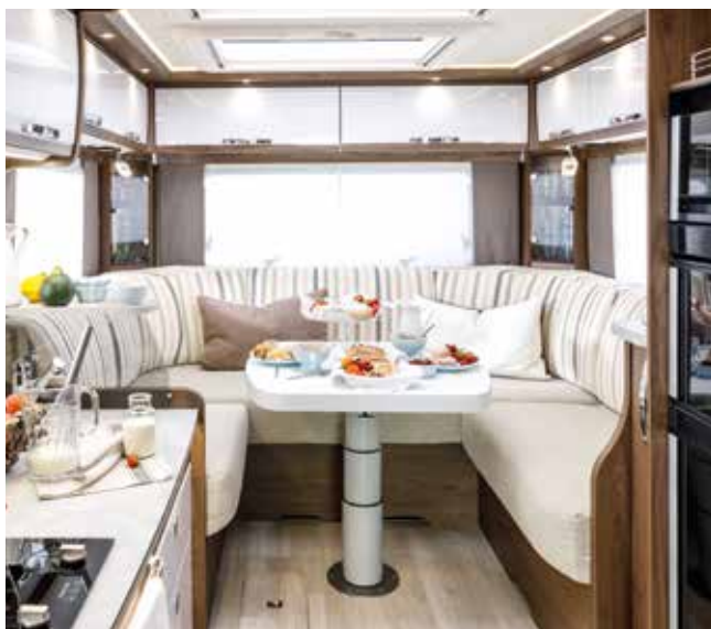
↑ C'est beau la vie dans le grand coin salon cosy

Intérieur sans marche, hauteur sous plafond de plus de 2 m