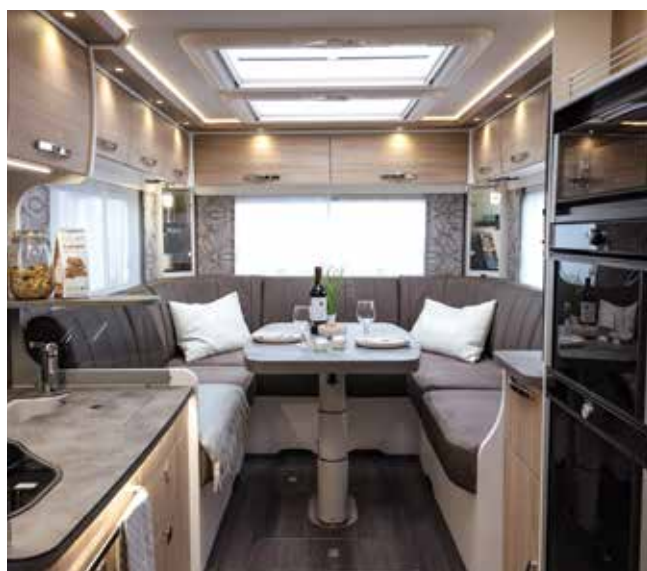
↑ Le classique aussi dans le PURE : le salon en U typique du PLATIN !

Un design extérieur unique – beaucoup d'espace à l'intérieur