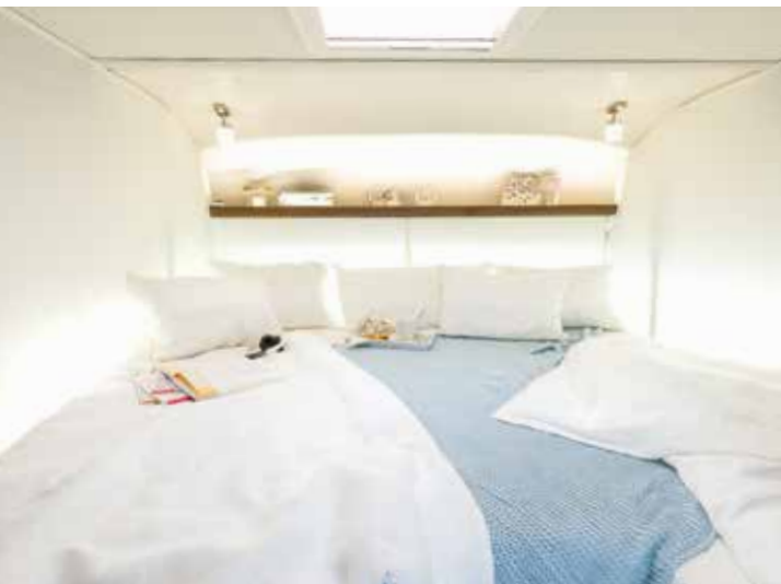
↑ Dormir, lire, streamer – idéal dans le lit pavillon.