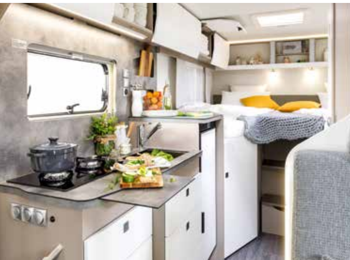
↑ Point fort dans la cuisine : le réfrigérateur de jusqu'à 138 litres