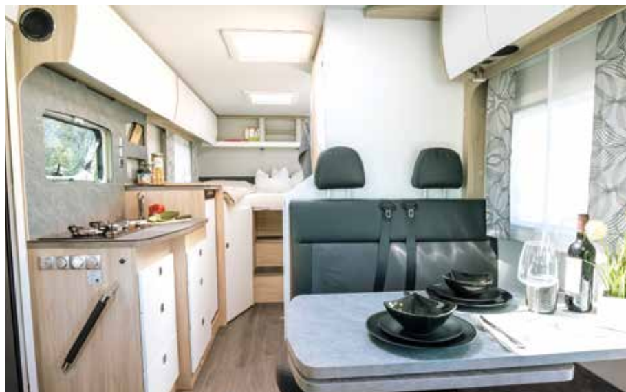
↑ Ça, c'est la vraie liberté : hauteur sous-plafond de 2 m dans tous les FRANKIA NEO intégraux

NOUVEAU : FRANKIA MI 7 NEO dans l'édition BLACK LINE, design spécifique et suréquipement inclus