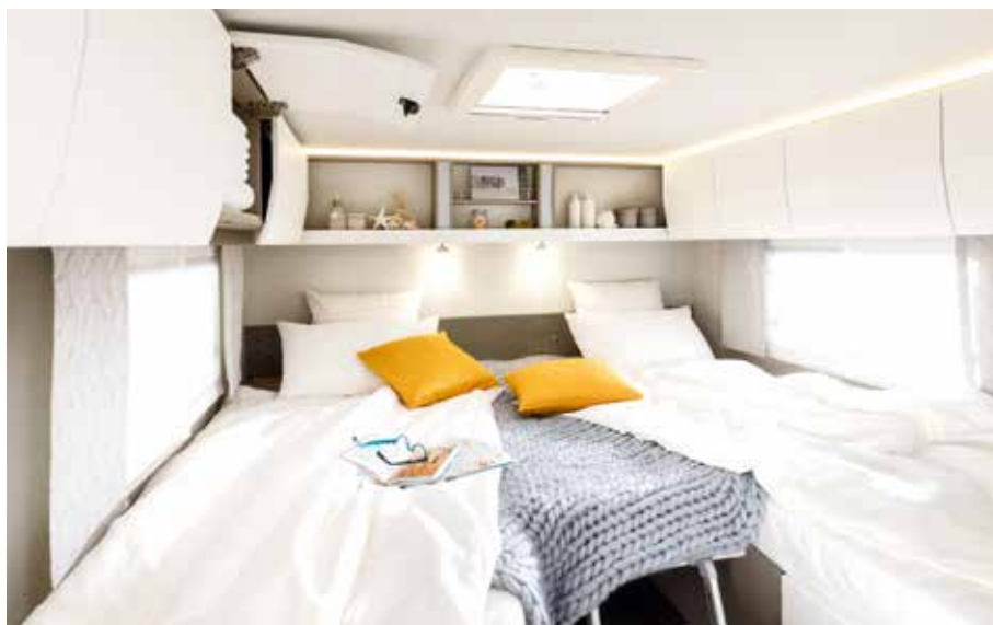
↑ Drôlement spacieux pour un poids plume : les lits jumeaux à l'arrière.