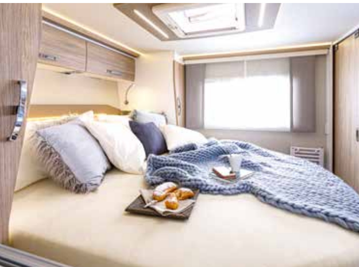
↑ Il en rajoute ! Lit central XL de 1,60 m de large