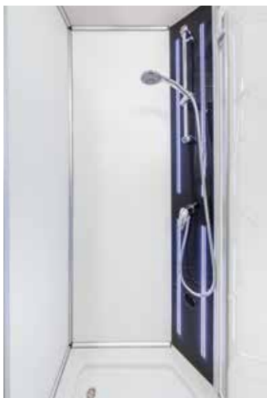
↑ Douche rafraîchissante