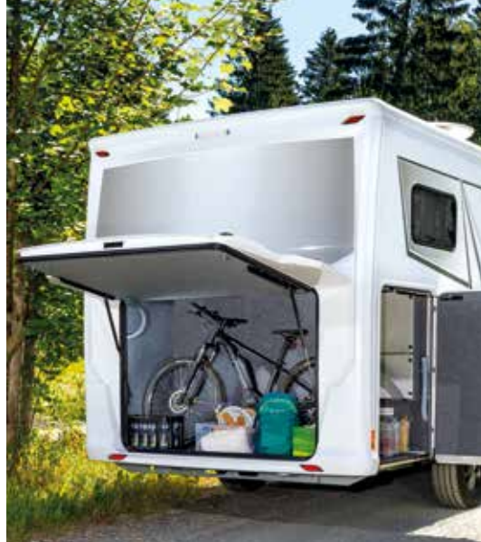
↑ Bien pensé pour charger et décharger : le système FRANKIA Smart-Load

Upgrade : le FRANKIA MT 7 NEO dans l'édition BLACK LINE, y compris design spécifique et suréquipement