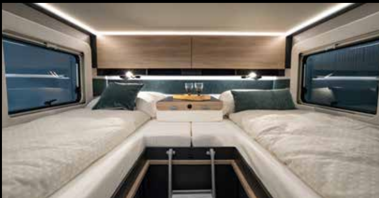
↑ Dormir comme dans un hôtel première classe : lumière, ambiance, espace, détails