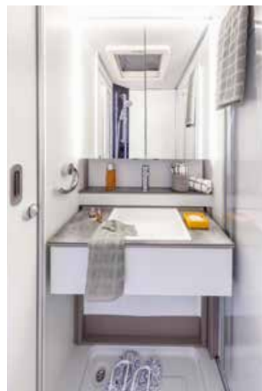
↑ Rafraîchissante : la salle de bains fûtée