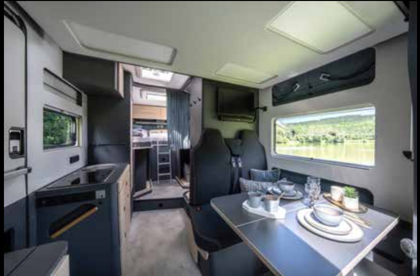
↑ Le NOW ne s'impose pas, il mise sur la clarté et vous laisse de la place.