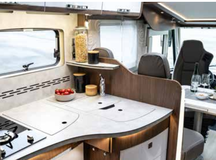
↑ Des rangements pour tout dans la cuisine MaxiFlex.