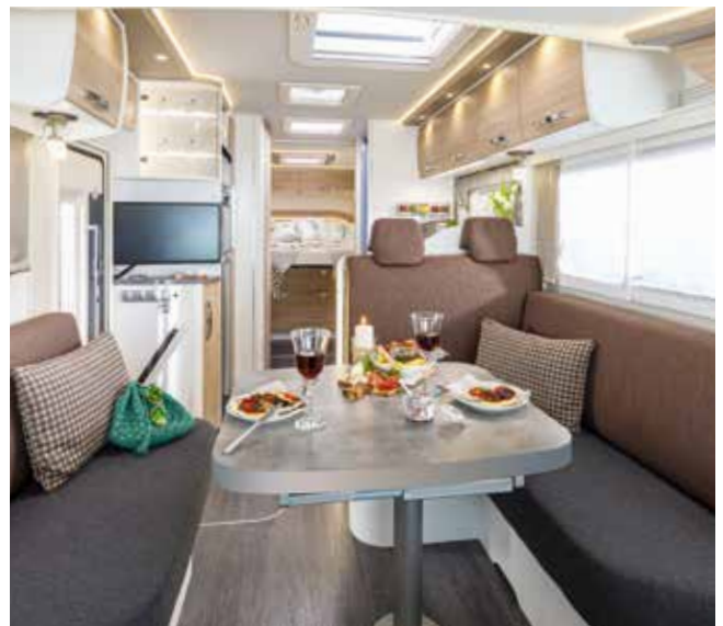
↑ Chaque FRANKIA PLATIN est un génie en matière d'espaces.