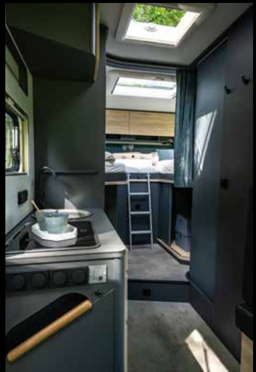
↑ Légèreté et bien-être des grands espaces libres

* Voir des informations importantes sur les caractéristiques techniques à la page 02.