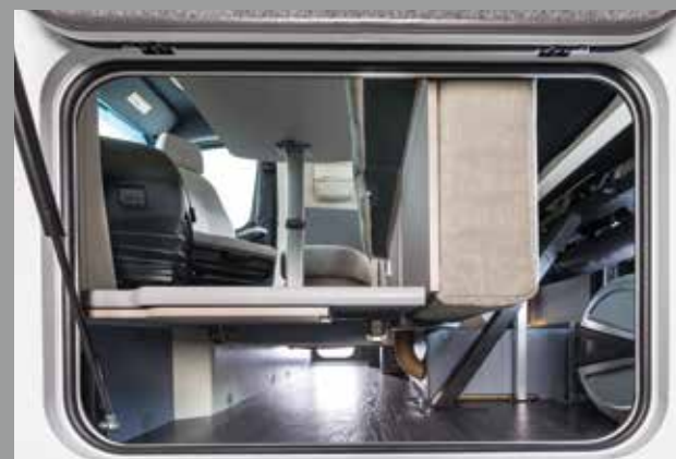
Beaucoup de place dans le double-plancher FRANKIA

Nouvelle solution intelligente : coffre de rangement sous la banquette du salon (GDK)