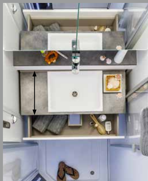
Ouverture par pression : le lavabo se déploie et disparaît facilement