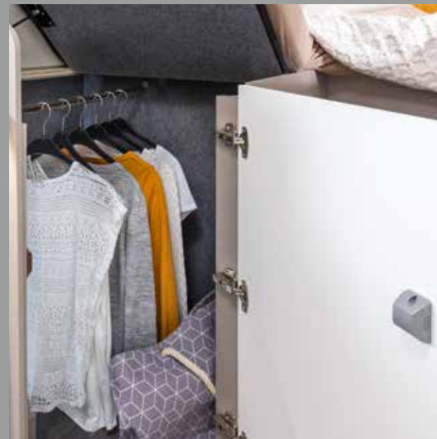
Malin : la penderie sous le lit