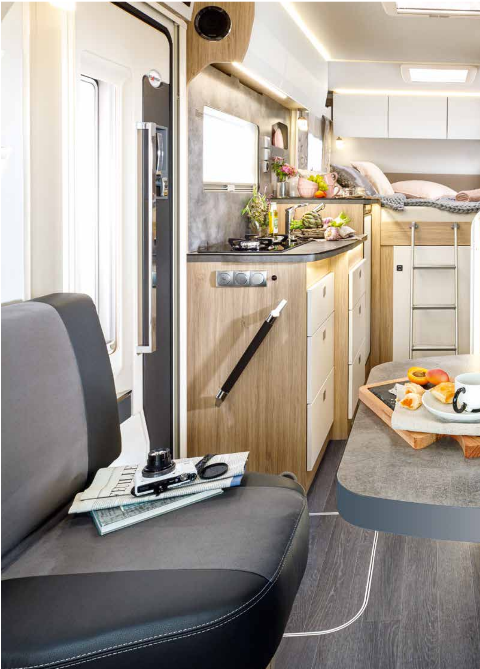
18 FRANKIA MT 7 BD NEO BLACK LINE (exemple de modèle)