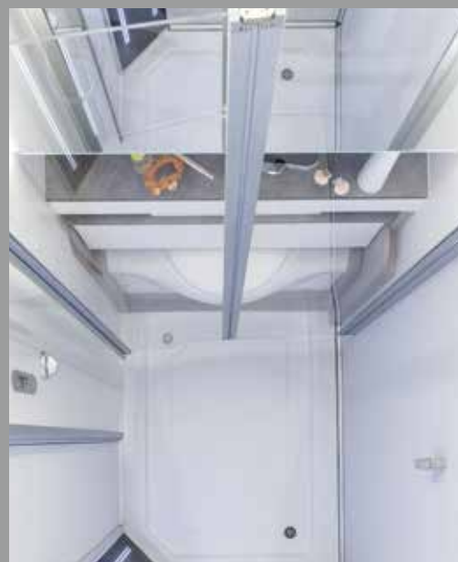
Douche wellness avec bac spacieux