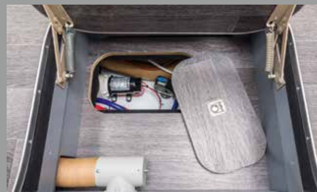
L'essentiel est accessible depuis la cellule