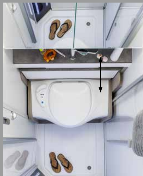
Les WC escamotables se cachent sous le lavabo