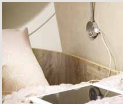
Dans tous les camping-cars FRANKIA : prises USB