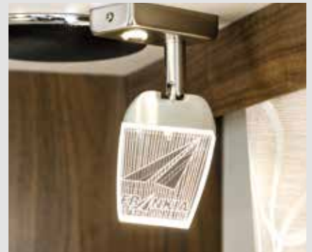
Liseuses dimmables FRANKIA avec fonction de veilleuse