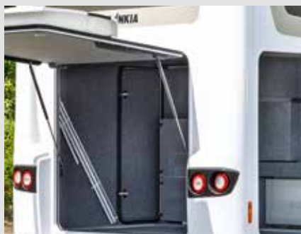
Accès confortable à la soute garage grâce à des portes arrière et latérale ajustables