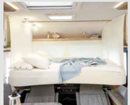
Lit pavillon électrique dans les intégraux