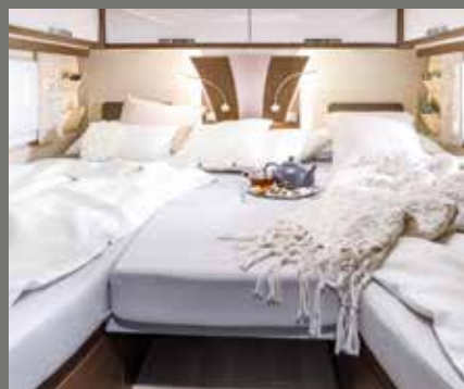
Encore plus de place ! Extension centrale pour les lits jumeaux (GD)