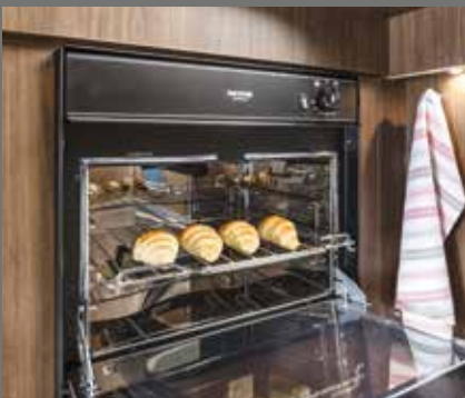
Four Thetford intégré