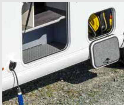
Enrouleur automatique avec câble de 15 m et compartiment de service