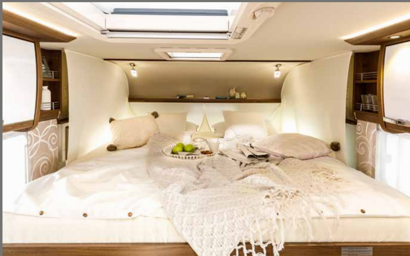
Parfait pour ceux qui dorment en long ou en large : le lit Duo FRANKIA est extensible à 2 x 2 m

Les équipements FRANKIA M-Line optionnels (sélection)