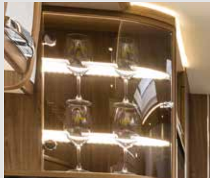
Élégante vitrine pour vos verres à vin FRANKIA