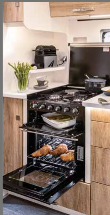
Cuisinière combinée (grill, four à gaz, réchaud 3 feux)