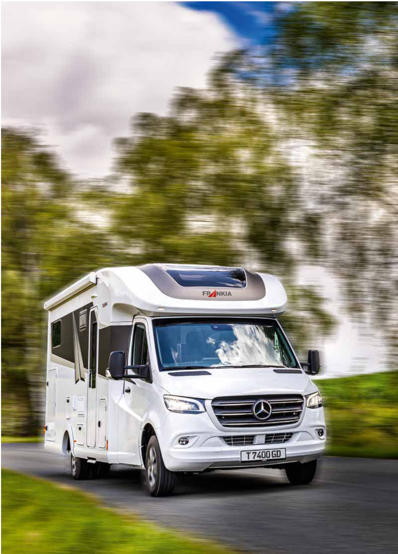
4 FRANKIA T 7400 GD (exemple de modèle)