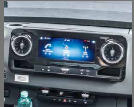
Système multimédia MBUX avec radio DAB+ de Mercedes-Benz