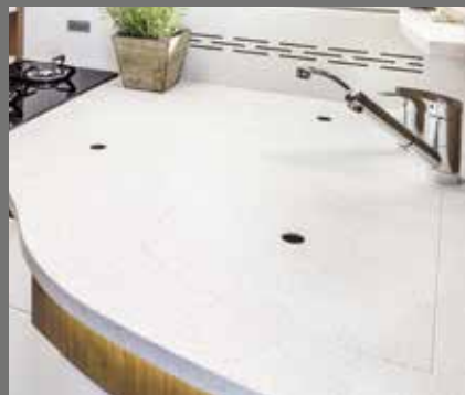
Plan de travail esthétique et résistant, p. ex. en pierre de synthèse