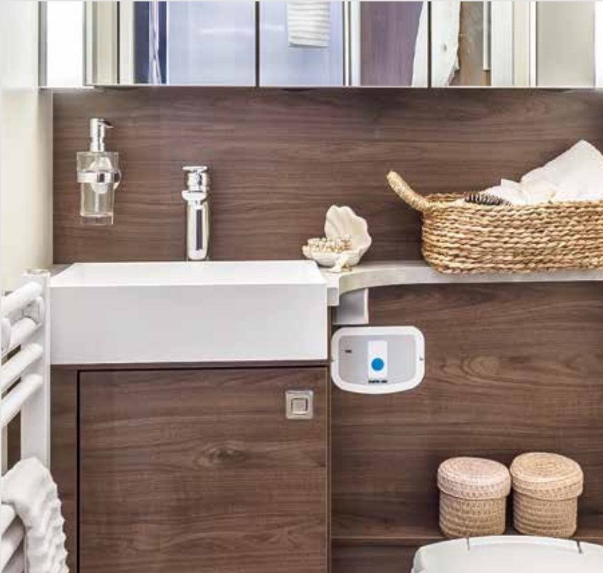
Tout en raffinement : la robinetterie de la salle d'eau FRANKIA