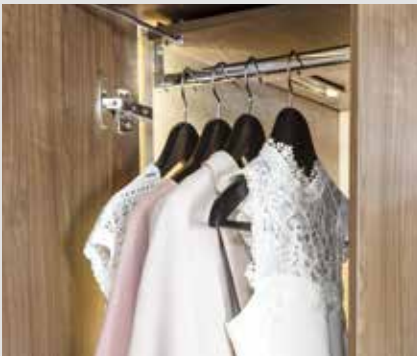
Des penderies spacieuses avec éclairage intérieur