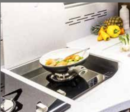
Puissant réchaud à gaz