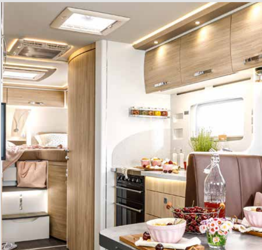
Pour une ambiance agréable : éclairage LED dimmable