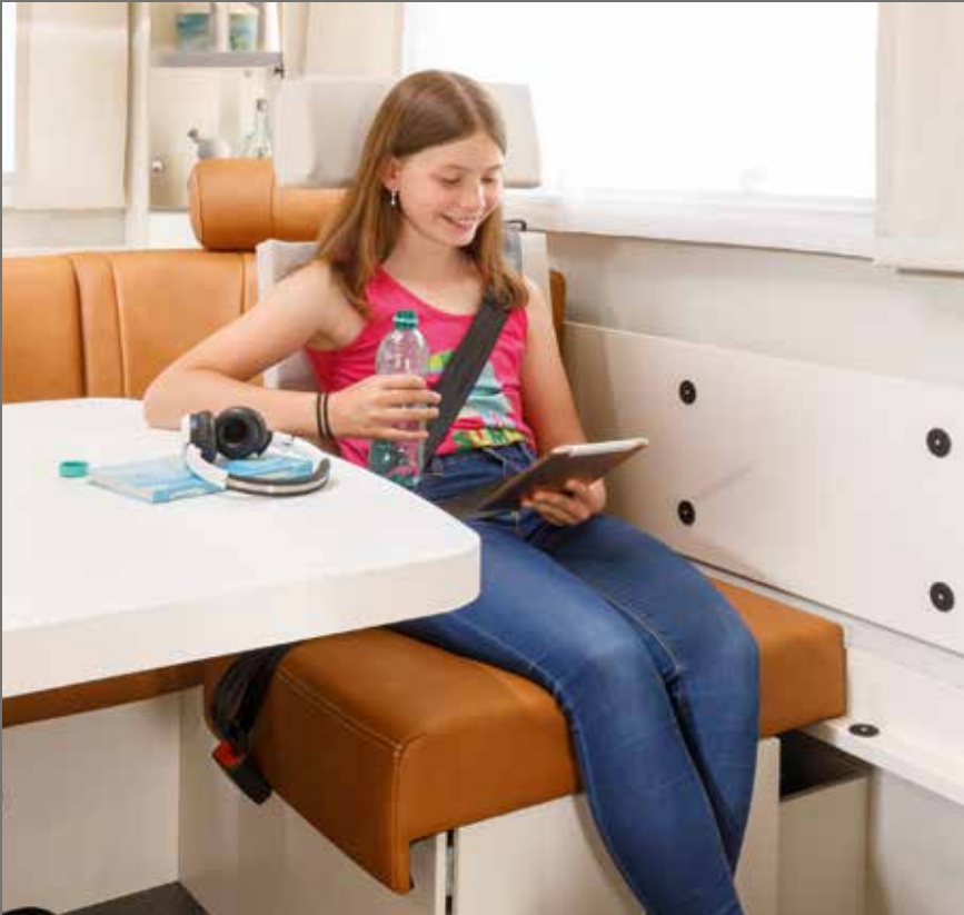
Places CG supplémentaires dans toutes les implantations FRANKIA PLUS