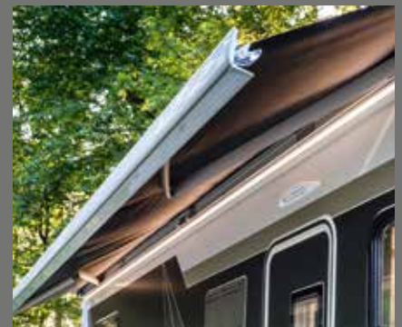
Store, en option avec éclairage LED intégré