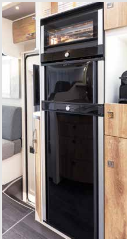
Le réfrigérateur et le congélateur de la TecTower s'ouvrent maintenant des deux côtés

Les équipements FRANKIA M-Line standards (sélection)