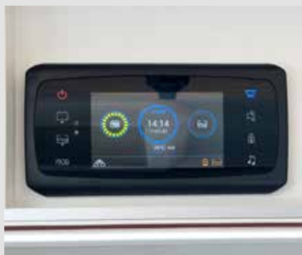
Panneau de commande central bien visible et intuitif