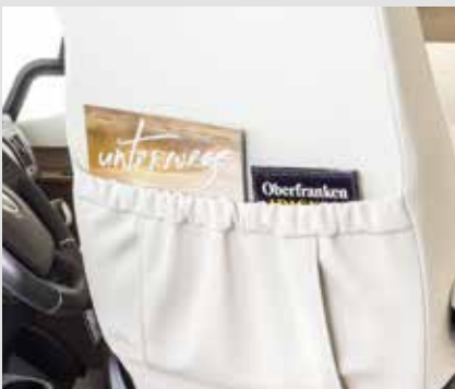
Pratique : poches au dos des sièges cabine (dans tous les intégraux FRANKIA)