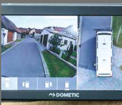
Grand-angle : caméra panoramique 360° avec grand écran