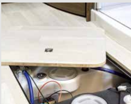
Double-plancher FRANKIA : plan sur toute la surface et entièrement chauffé