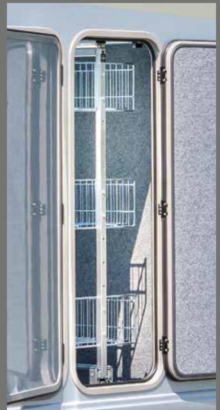
Paniers coulissants sur rail, très pratiques, dans la soute garage