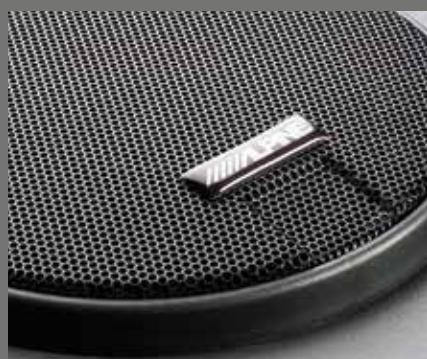
Haut-parleurs Alpine Dolby Surround