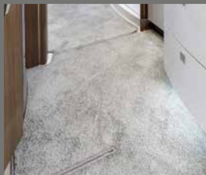
Moquette facile d'entretien dans tout l'habitat