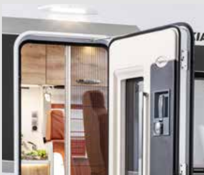
Protection : moustiquaire intégrée dans la porte cellule