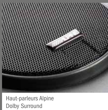
Haut-parleurs Alpine Dolby Surround