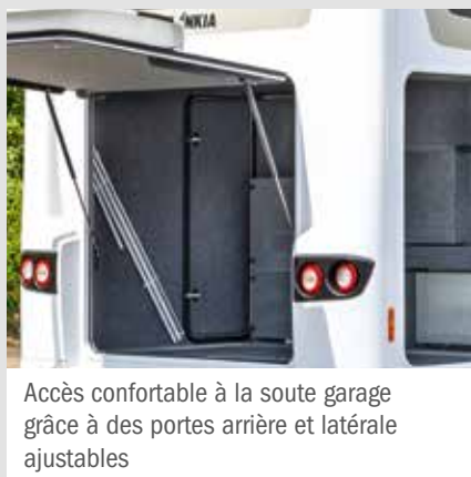
Accès confortable à la soute garage grâce à des portes arrière et latérale ajustables