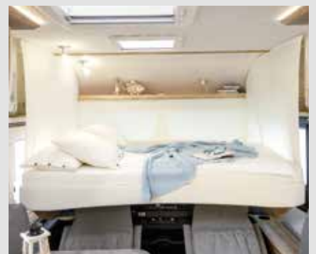
Lit pavillon électrique dans les intégraux