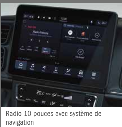
Radio 10 pouces avec système de navigation