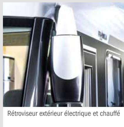
Rétroviseur extérieur électrique et chauffé