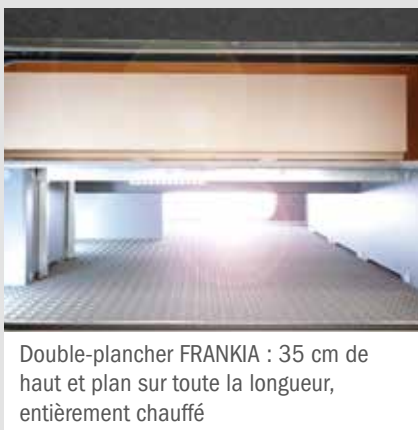
Double-plancher FRANKIA : 35 cm de haut et plan sur toute la longueur, entièrement chauffé