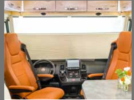
Store pare-brise occultant électrique avec fonctions discrétion et pare-soleil (en standard dans le modèle Luxury)