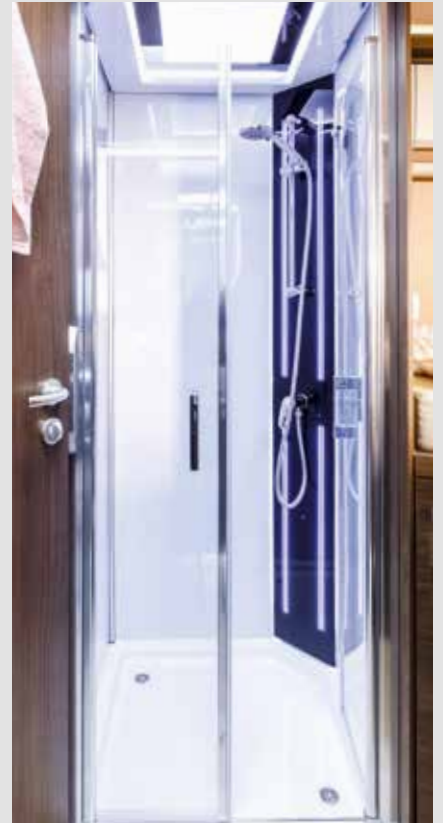
Cabine de douche avec lumière d'ambiance