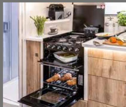
Cuisinière combinée (grill, four à gaz, réchaud 3 feux)