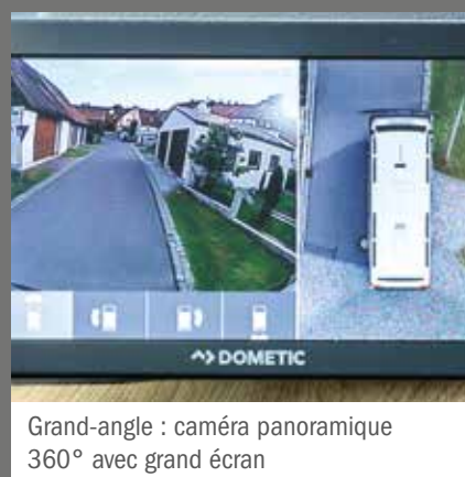
Grand-angle : caméra panoramique 360° avec grand écran