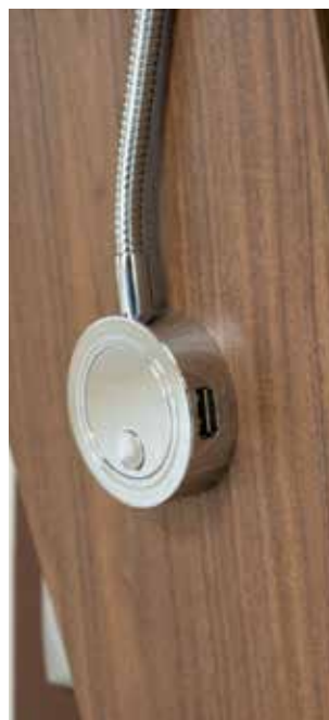
Plusieurs prises USB bien pratiques