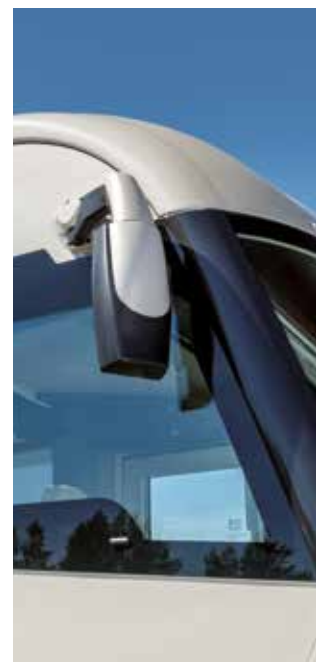
Vitres isolantes dans la cabine