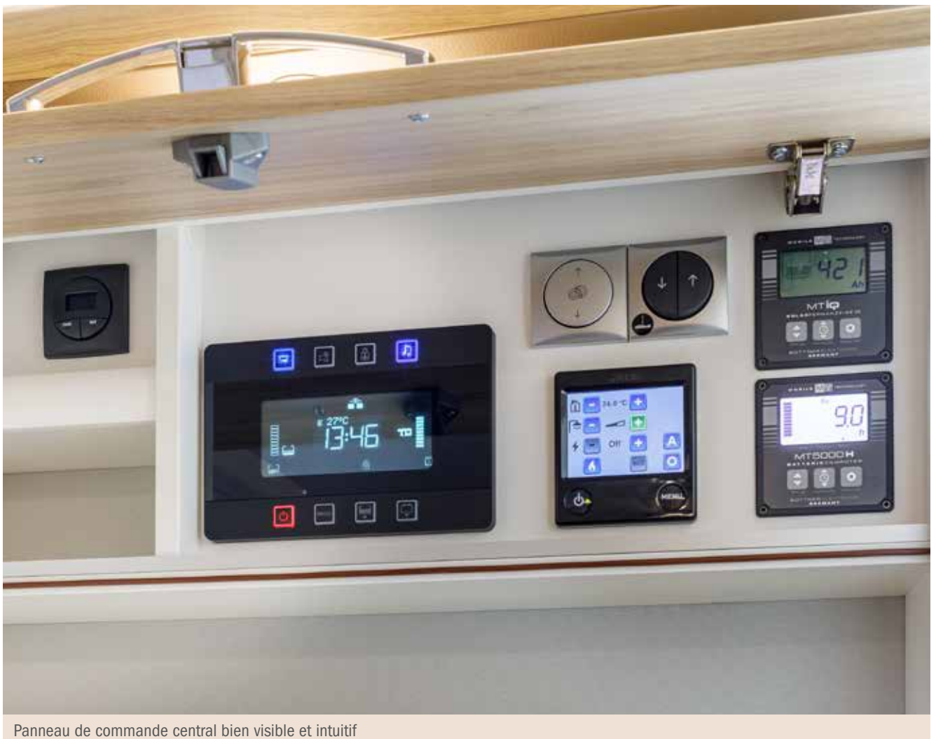
Panneau de commande central bien visible et intuitif