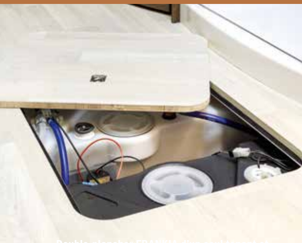
Double plancher FRANKIA d'un seul tenant et plan sur toute la surface, accessible de l'intérieur et de l'extérieur