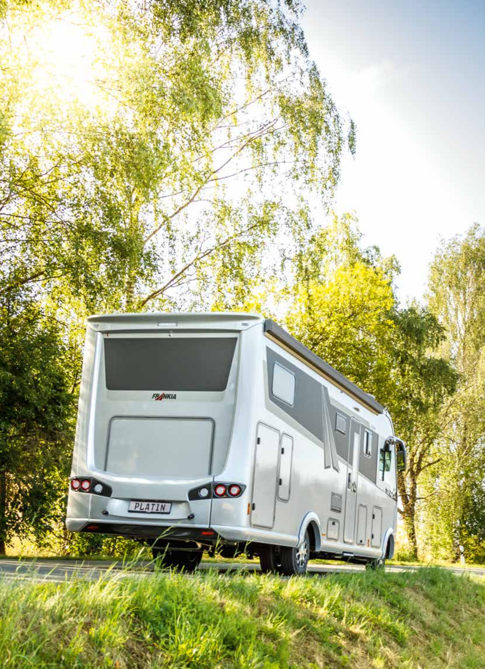
2 FRANKIA I 7900 GD PLATIN dans le design Silver Arrow (exemple de modèle)