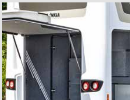
Accès confortable à la soute garage grâce à des portes arrière et latérale ajustables