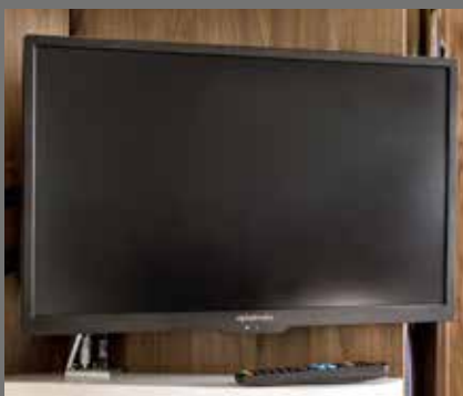
Téléviseur Alphatronics SL, écran plat 24 pouces