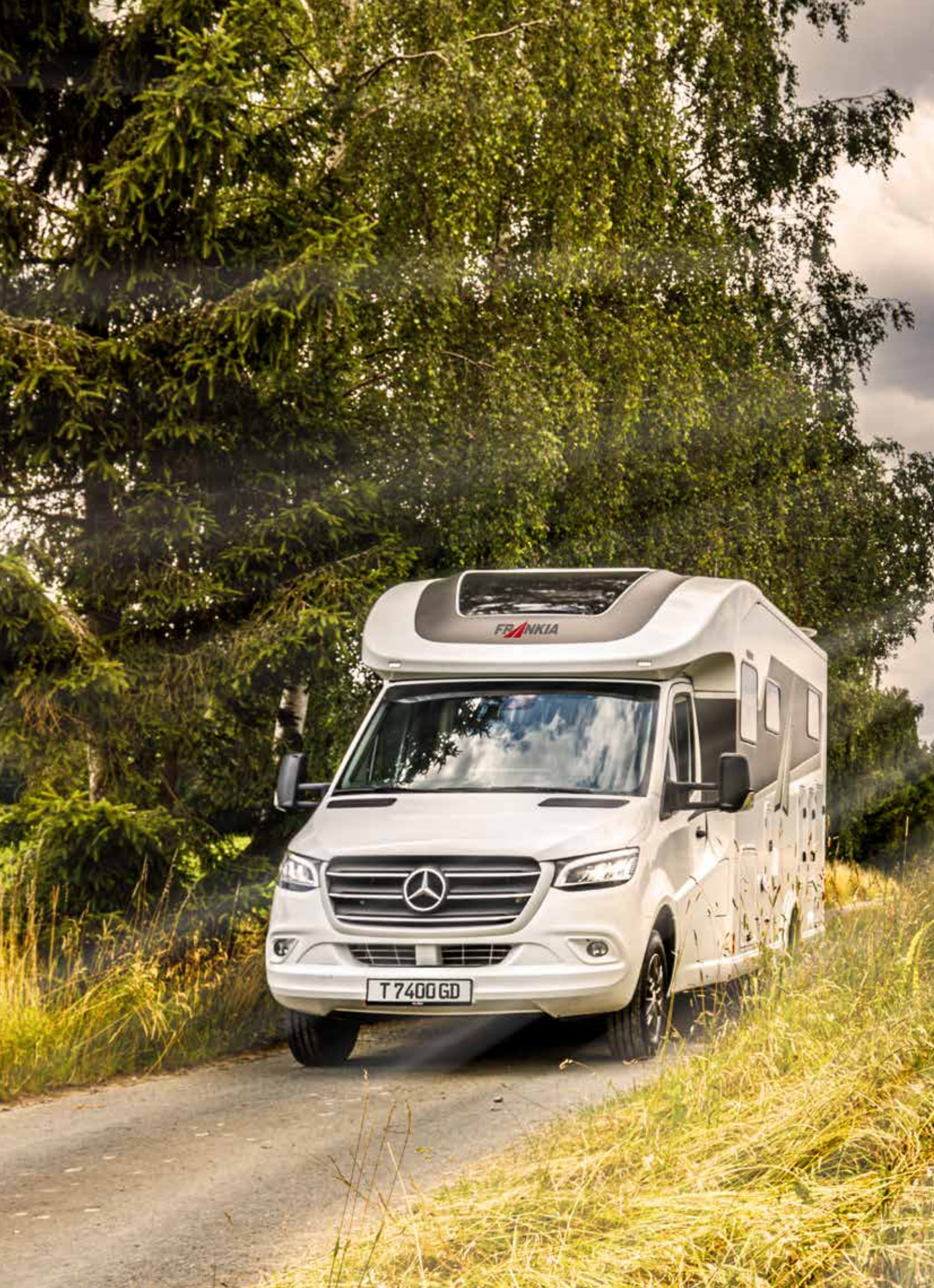
2 FRANKIA T 7400 GD (exemple de modèle)