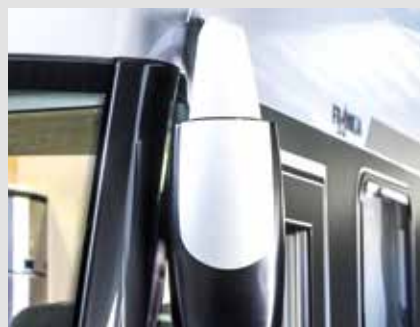
Rétroviseur extérieur électrique et chauffé