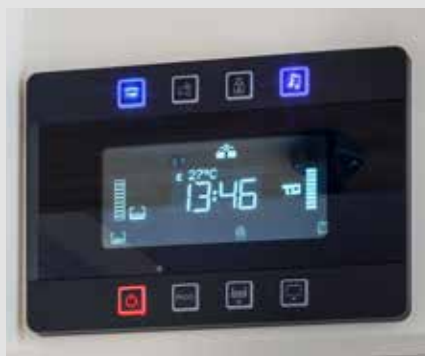
Panneau de commande central bien visible et intuitif