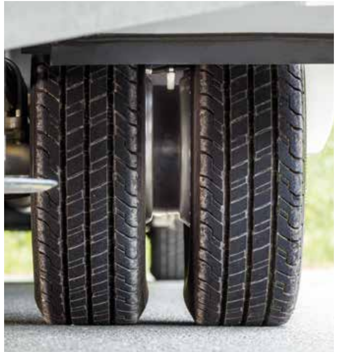
Élargisseur de voie (exemple de modèle)

Store manuel Thule de 5,5 m, boîtier anthracite (FINAL SIX : store électrique Thule de 5,5 m, boîtier anthracite)