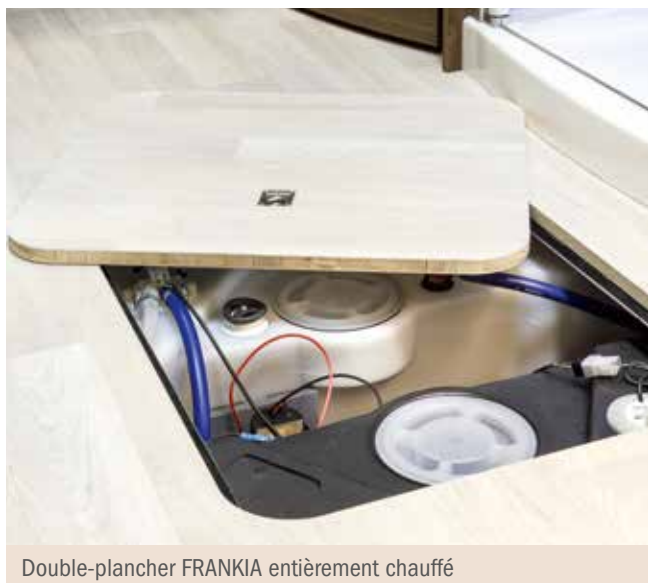
Double-plancher FRANKIA entièrement chauffé