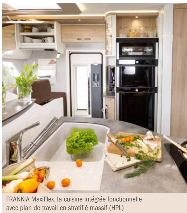
FRANKIA MaxiFlex, la cuisine intégrée fonctionnelle avec plan de travail en stratifié massif (HPL)