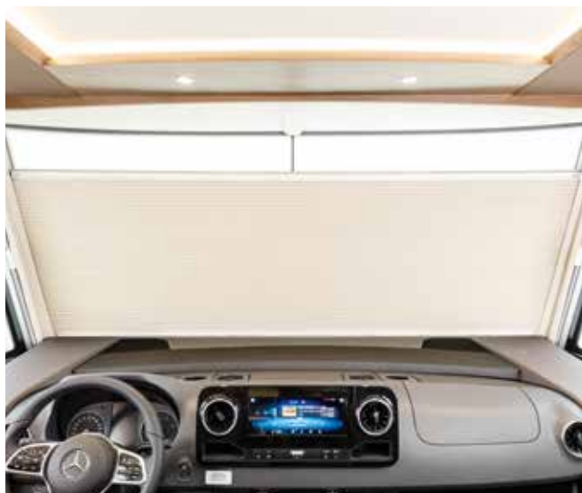
Store pare-brise occultant électrique