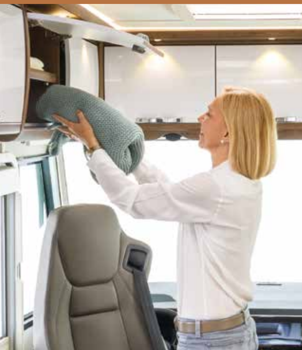
Multiples espaces de rangement dans l'habitacle, toujours faciles d'accès.