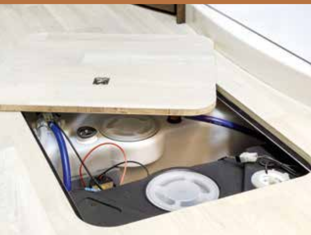
Double-plancher FRANKIA d'un seul tenant et plan sur toute la surface, accessible de l'intérieur et de l'extérieur