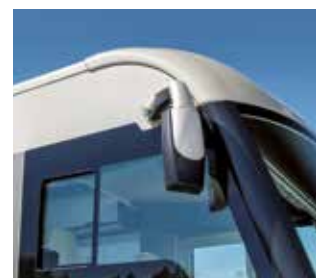
Vitres isolantes dans la cabine