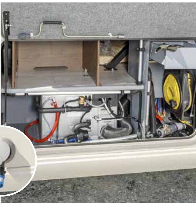
Enrouleur automatique avec câble de 15 m et compartiment de service