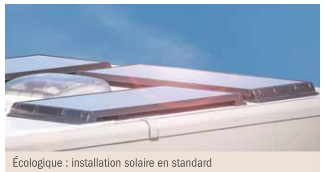
Écologique : installation solaire en standard