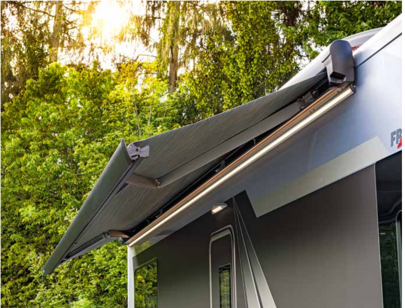
Store avec éclairage LED intégré (exemple de modèle)