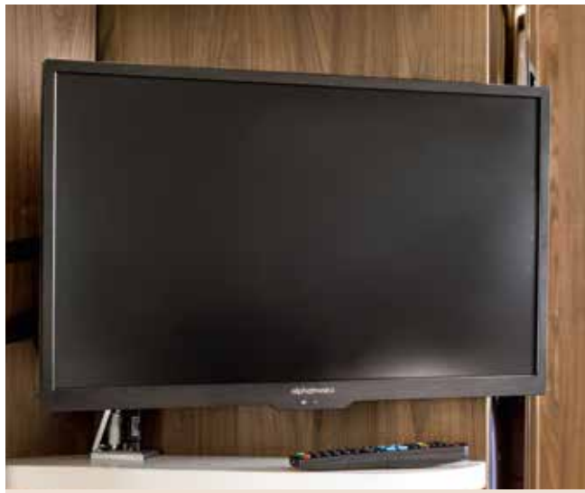
Téléviseur Alpatronics SL avec écran plat 24 pouces