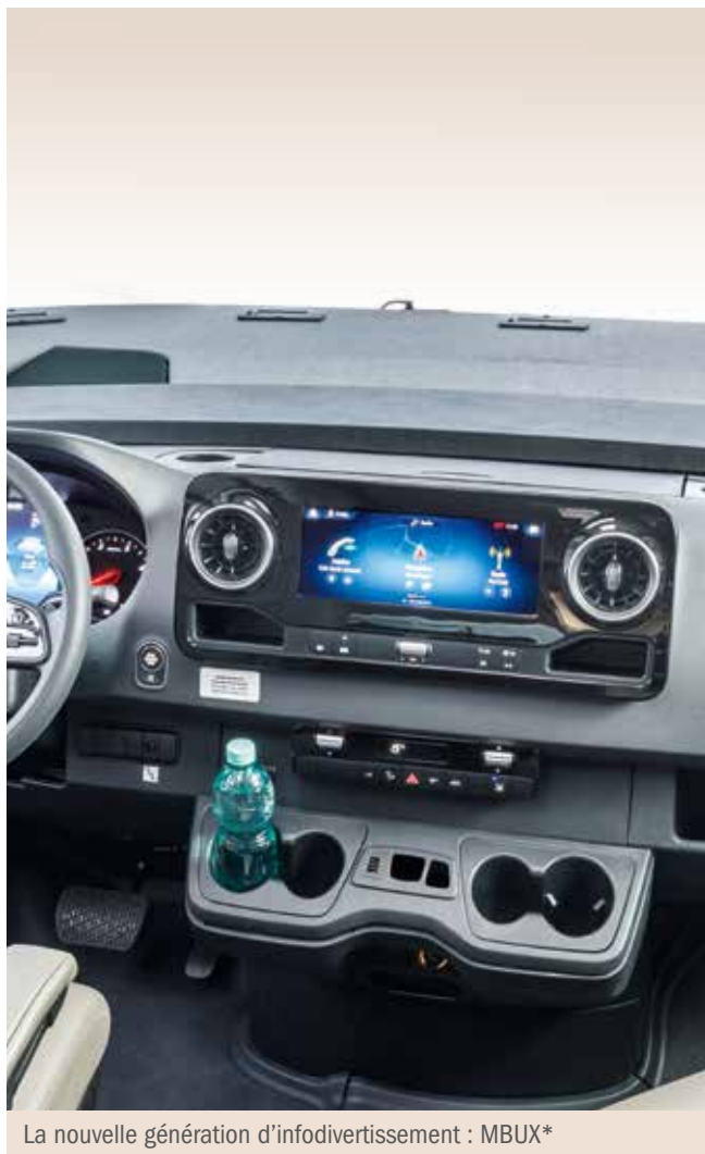
La nouvelle génération d'infodivertissement : MBUX*