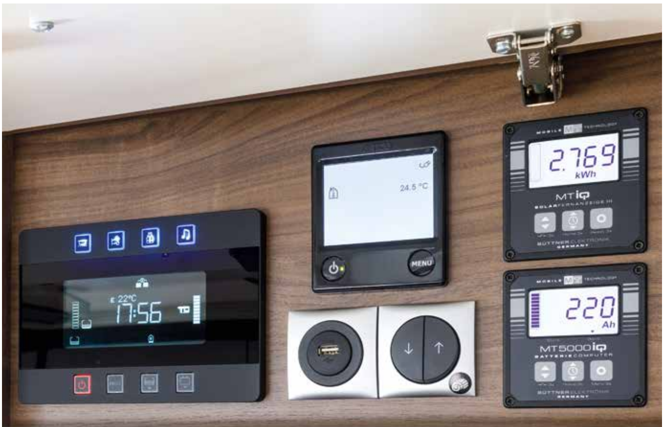
Panneau de commande central bien visible et intuitif