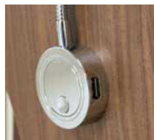
Plusieurs prises USB bien pratiques