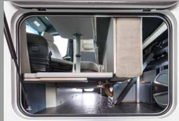
Beaucoup de place dans le double-plancher FRANKIA

Nouvelle solution intelligente : coffre de rangement sous la banquette du salon