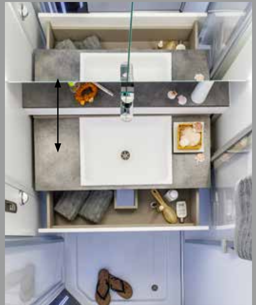
Ouverture par pression : le lavabo se déploie et disparaît facilement