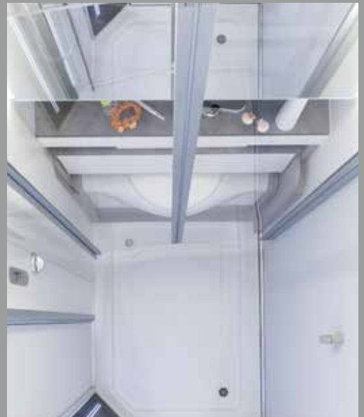
Douche wellness avec bac spacieux