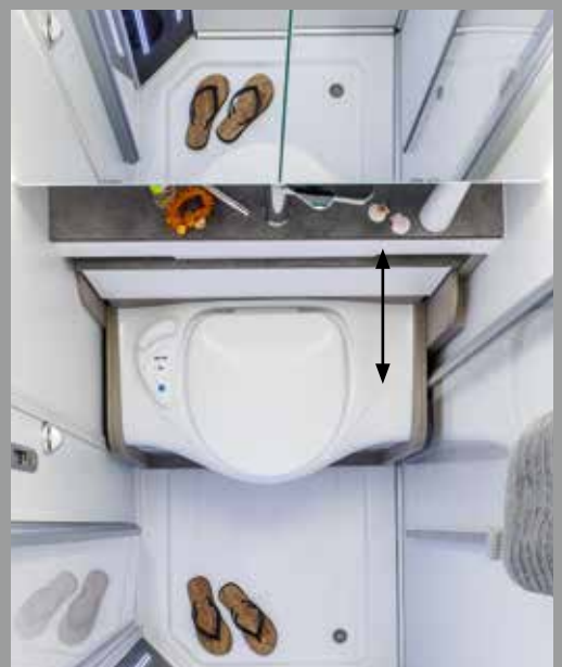
Les WC escamotables se cachent sous le lavabo