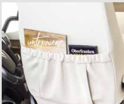
Pratique : poches au dos des sièges cabine (dans tous les intégraux FRANKIA)