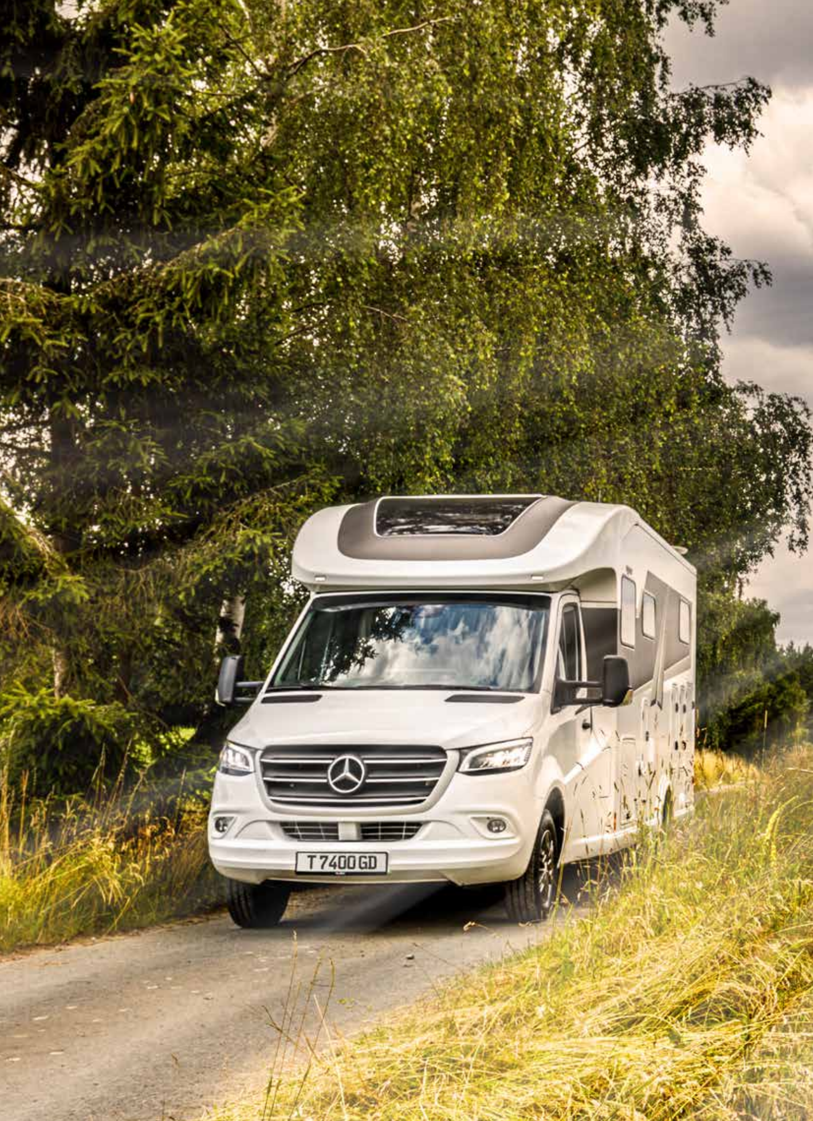
2 FRANKIA T 7400 GD (exemple de modèle)