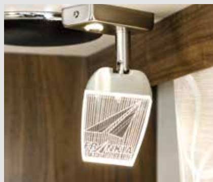
Liseuses dimmables FRANKIA avec fonction de veilleuse