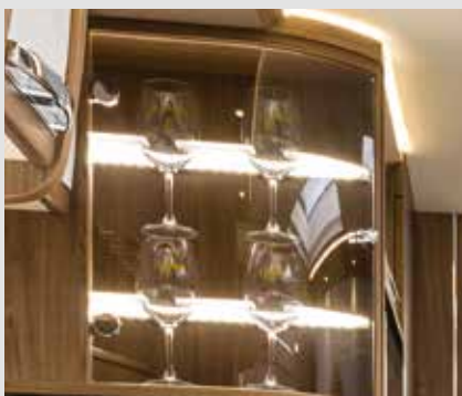
Élégante vitrine pour vos verres à vin FRANKIA