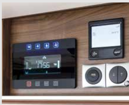
Panneau de commande central bien visible et intuitif