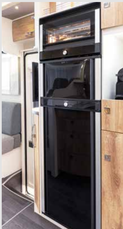
Le réfrigérateur et le congélateur de la TecTower s'ouvrent maintenant des deux côtés