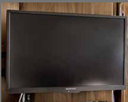
Téléviseur Alphatronics SL, écran plat 24 pouces, tuner DVB-S2/T2/C, lecteur DVD et Bluetooth