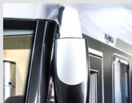
Rétroviseur extérieur électrique et chauffé