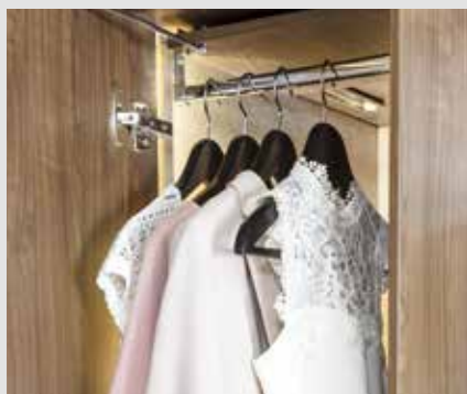
Des penderies spacieuses avec éclairage intérieur