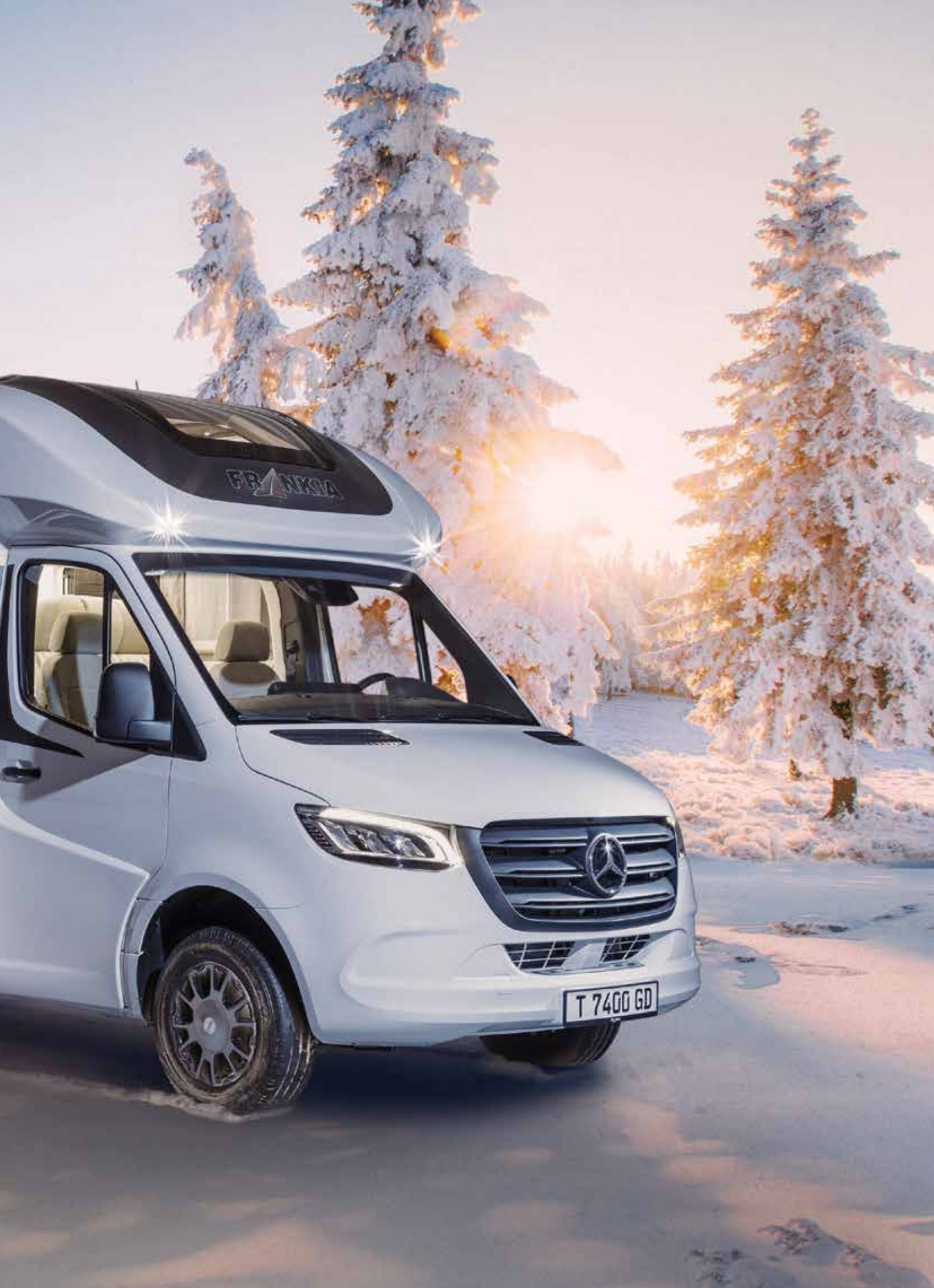
La photo montre les jantes alu du modèle 2021. Celles-ci ne sont pas disponibles sur le modèle 2022 ici représenté.