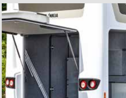
Accès confortable à la soute garage grâce à des portes arrière et latérale ajustables