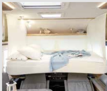
Lit pavillon électrique dans les intégraux