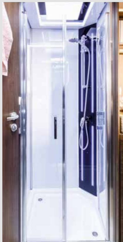
Cabine de douche avec lumière d'ambiance