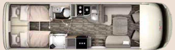
I 8400 GD PLATIN