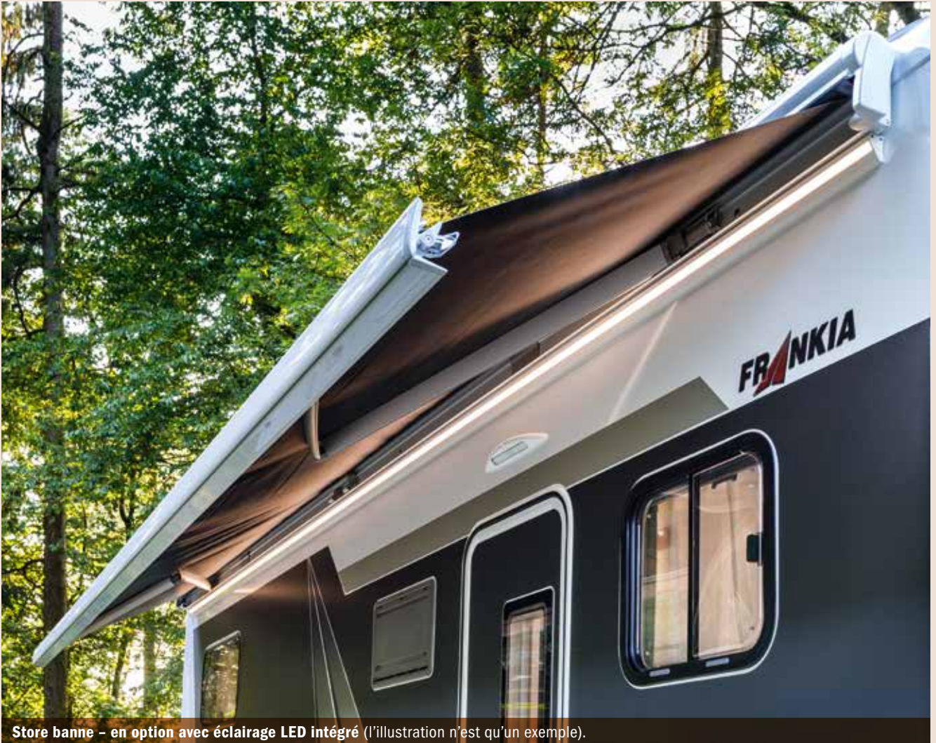
Store banne - en option avec éclairage LED intégré (l'illustration n'est qu'un exemple).