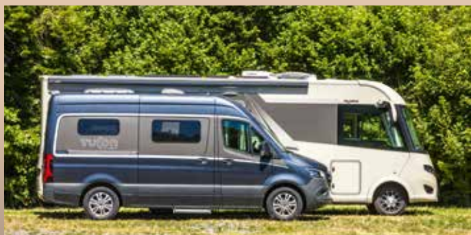
EXCEPTIONNEL : du modèle le plus compact et léger au liner de luxe – FRANKIA sur Mercedes-Benz, c'est un choix de 20 implantations.