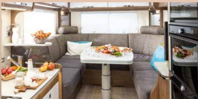
EXCLUSIVITÉ : généreux salons en U FRANKIA sur Mercedes-Benz – désormais aussi dans les liners FRANKIA PLATIN.