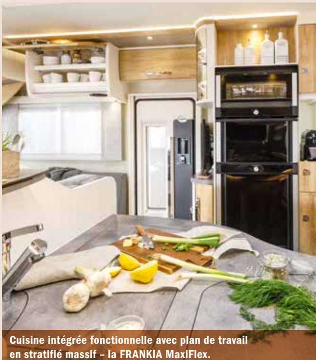
Cuisine intégrée fonctionnelle avec plan de travail en stratifié massif – la FRANKIA MaxiFlex.