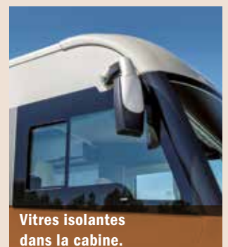
Vitres isolantes dans la cabine.