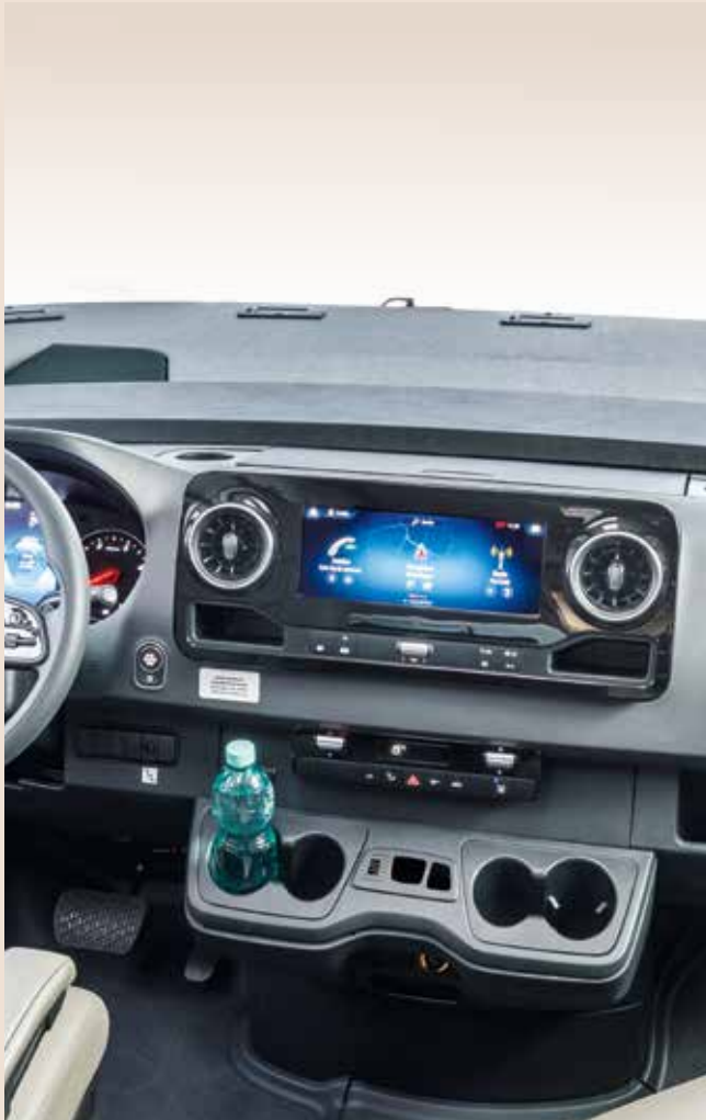
Système multimédia nouvelle génération : MBUX*.