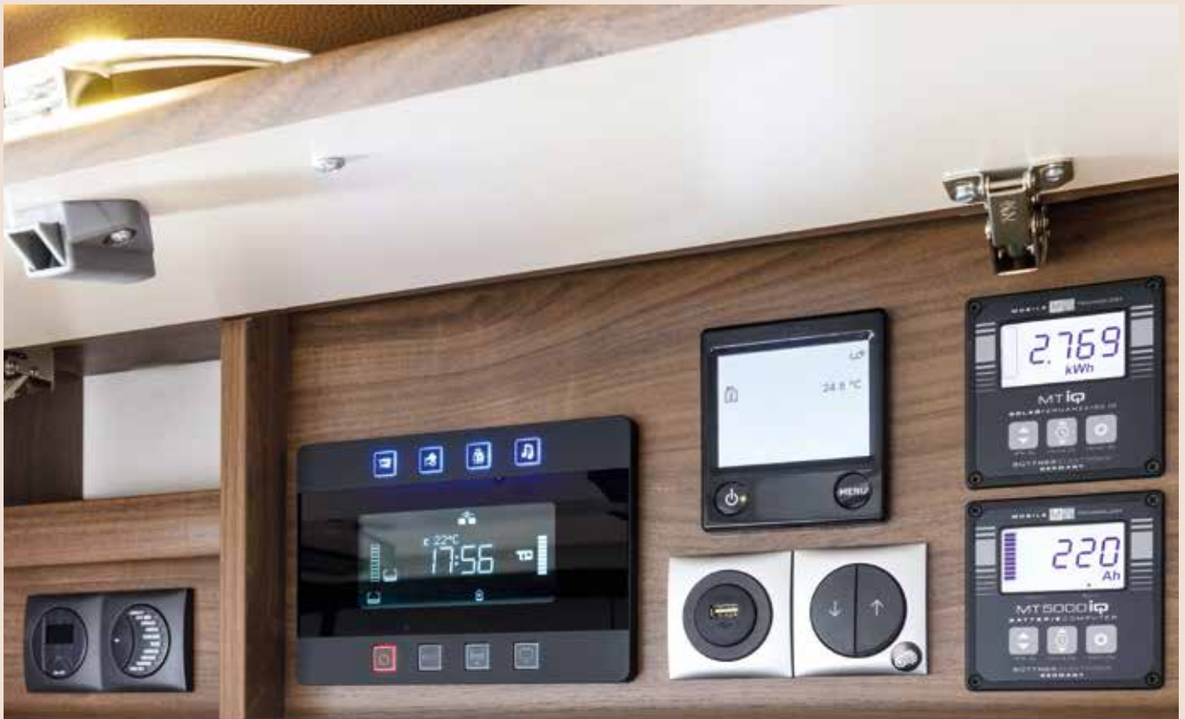
Panneau de commande central bien visible et intuitif.