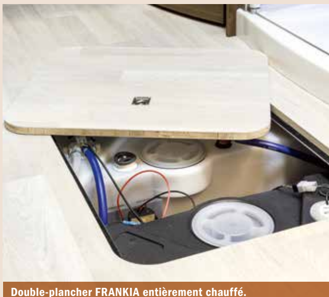
Double-plancher FRANKIA entièrement chauffé.