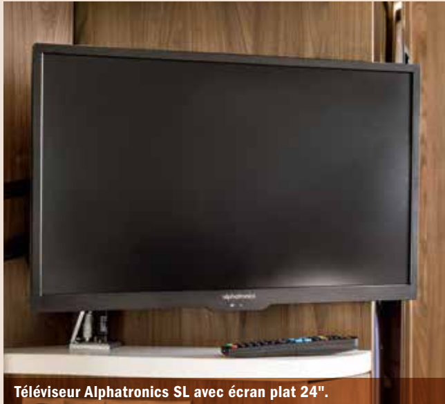
Téléviseur Alphatronics SL avec écran plat 24".