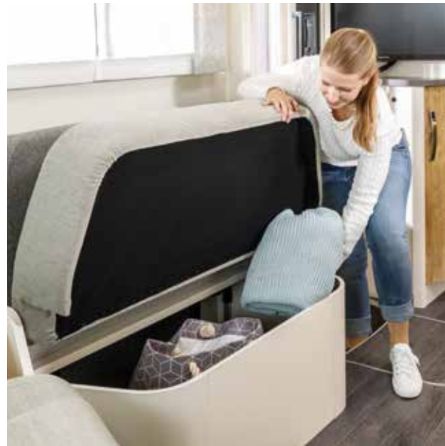
Coffre bien pratique sous la banquette accessible d'un seul geste.