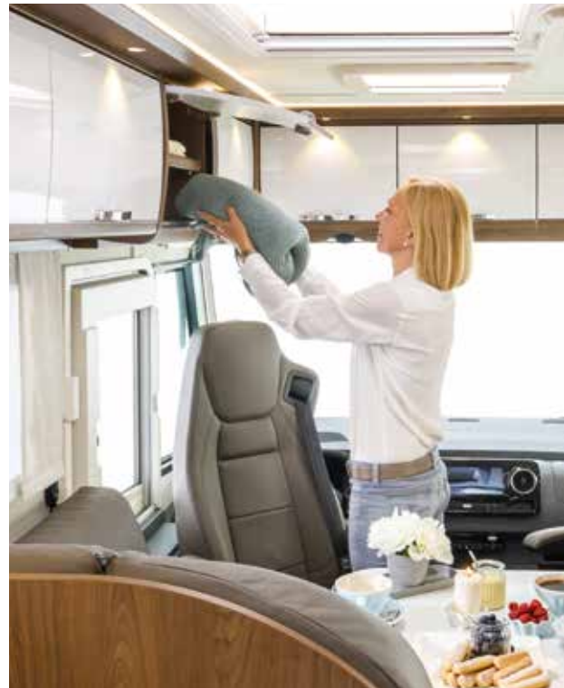
Multiple espaces de rangement dans l'habitacle, toujours faciles d'accès.