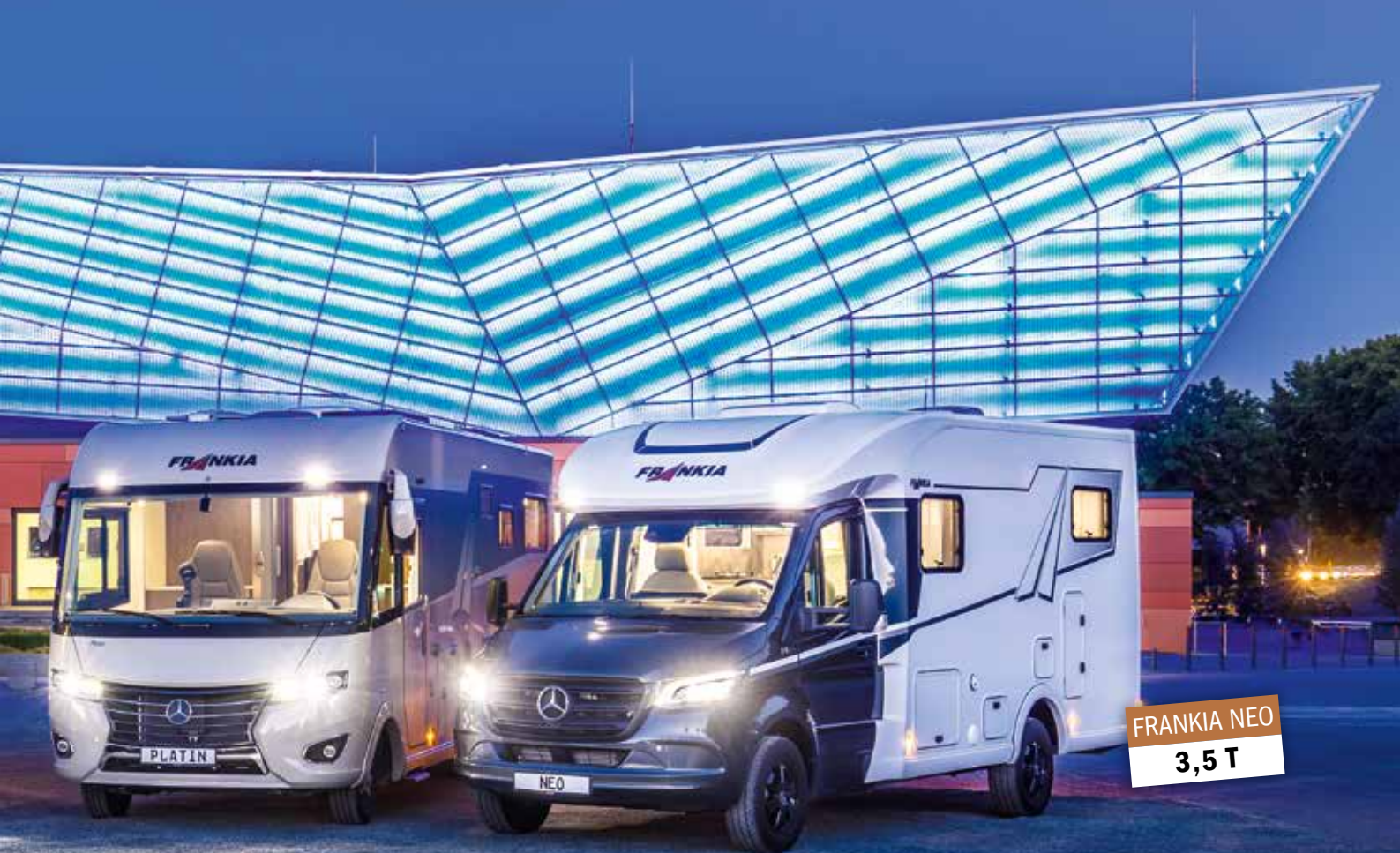
Le microfliner Yucon by FRANKIA, le génie de l'espace M-Line T 7400 GD/QD, le liner de luxe FRANKIA PLATIN et le FRANKIA NEO (de g. à dr.).