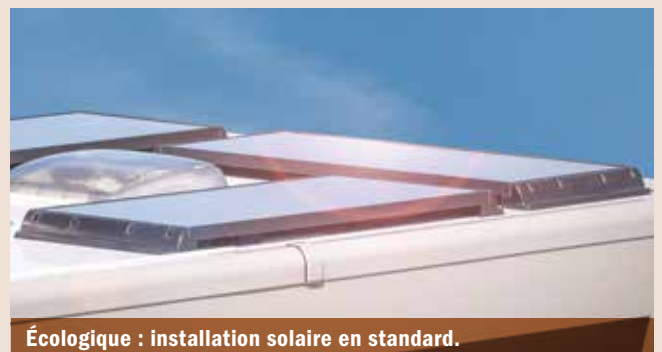
Écologique : installation solaire en standard.