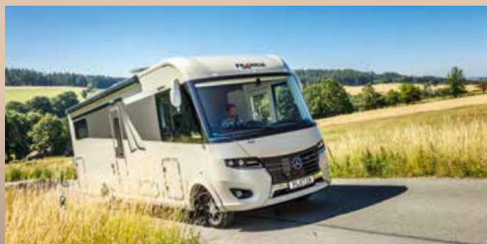
PUISSANT : Propulsion musclée avec jusqu'à 190 ch, boîte automatique 7 vitesses à convertisseur de couple, technologie FSD (en option).