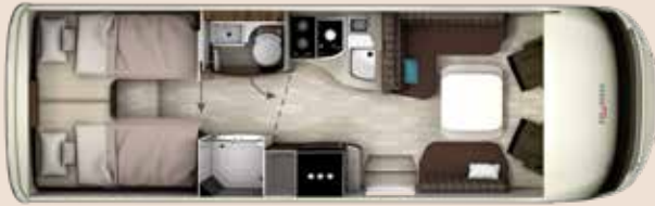
I 7900 GD PLATIN