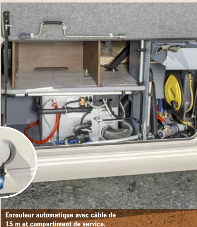
Enrouleur automatique avec câble de 15 m et compartiment de service.