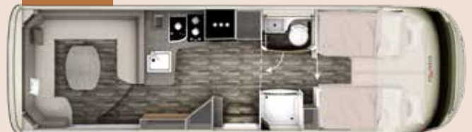
I 8400 PLUS PLATIN