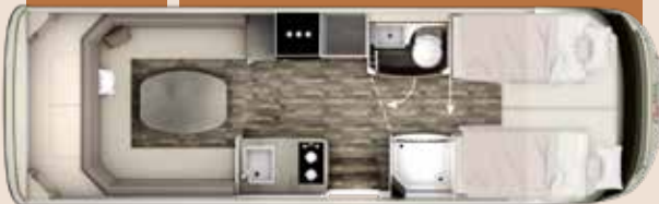
I 7900 PLUS PLATIN

SALON EN U LIT PAVILLON SUPPLÉMENTAIRE À L'ARRIÈRE POSSIBLE