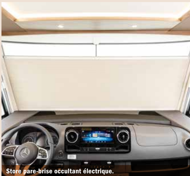
Store pare-brise occultant électrique.