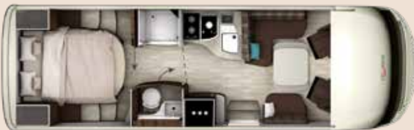
I 7900 QD PLATIN