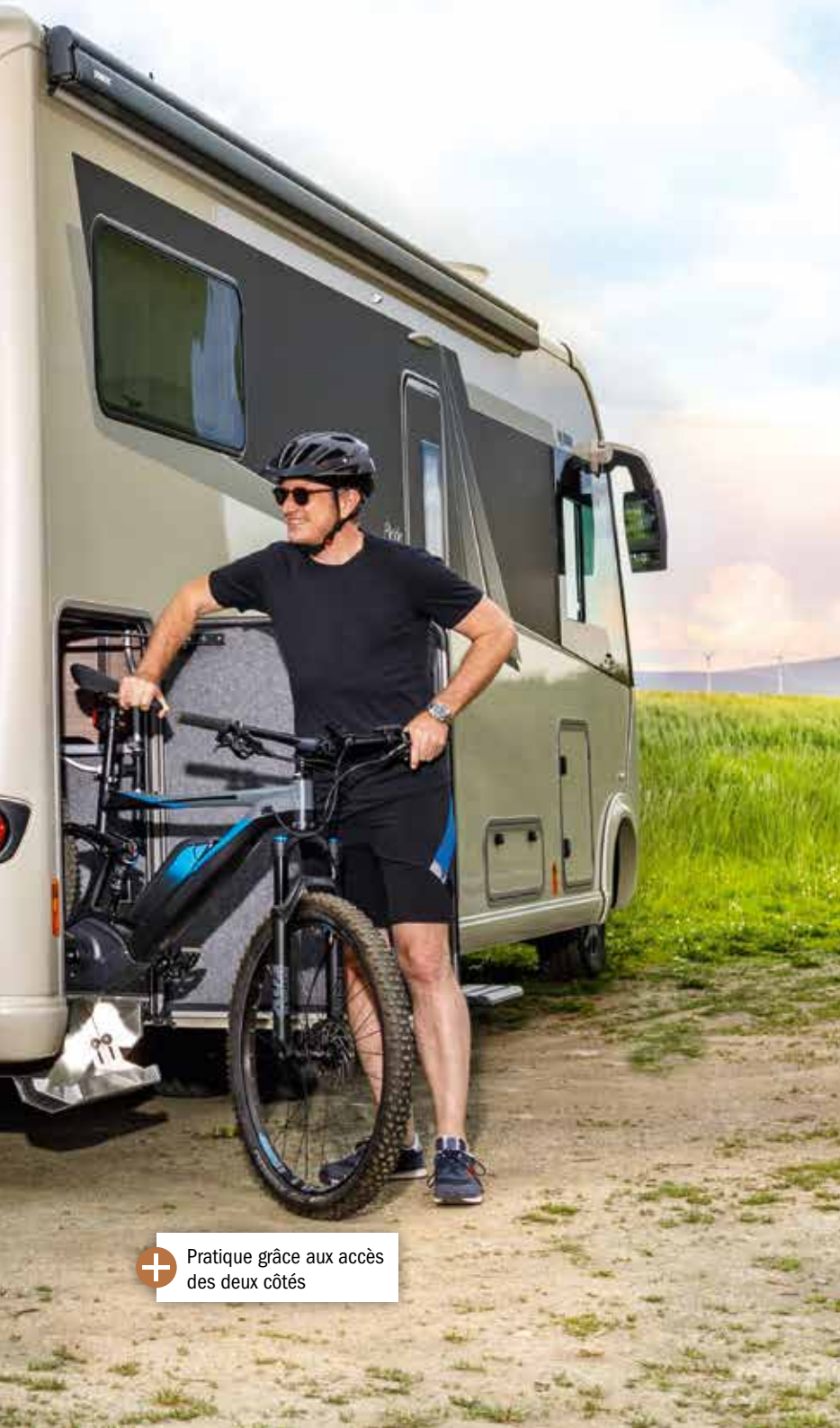
+ Pratique grâce aux accès des deux côtés