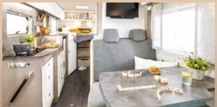
EXCEPTIONNEL : le volume intérieur impressionnant du profilé 3,5 t FRANKIA NEO sur puissant châssis Sprinter.