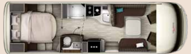
I 8400 QD PLATIN