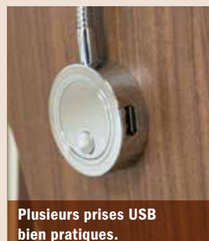
Plusieurs prises USB bien pratiques.