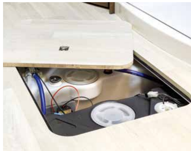
Double-plancher FRANKIA d'un seul tenant et plan sur toute la surface, accessible de l'intérieur et de l'extérieur.