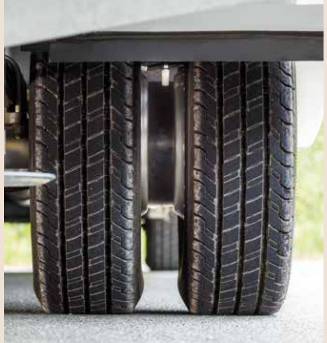
Élargisseur de voie.

Thule Store banne manuel de 5,5 m, boîtier anthracite ou blanc, selon la couleur de la carrosserie