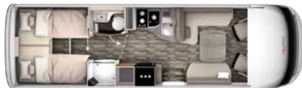
I 840 GD TITAN