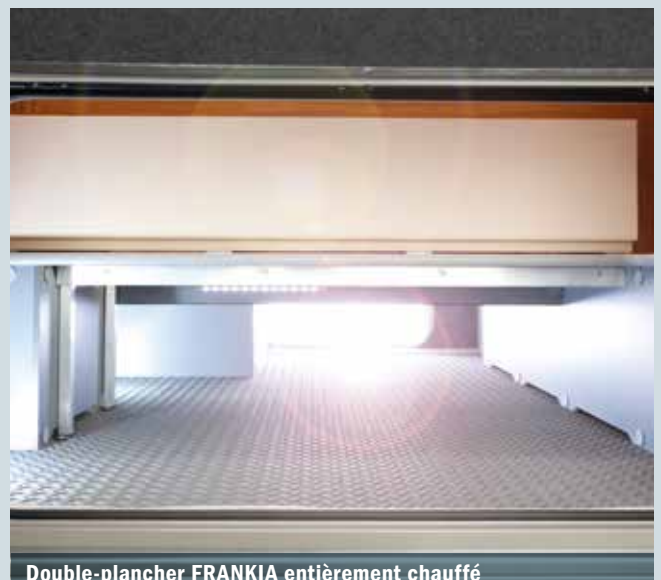
Double-plancher FRANKIA entièrement chauffé