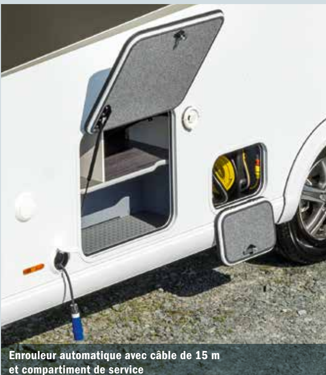
Enrouleur automatique avec câble de 15 m et compartiment de service