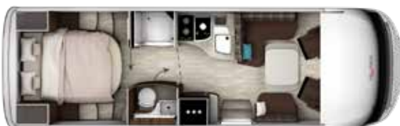
I 790 QD TITAN