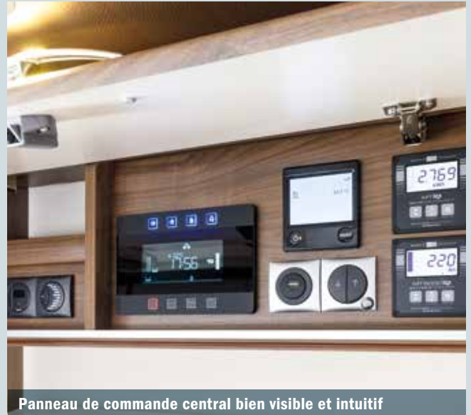
Panneau de commande central bien visible et intuitif

Onduleur MT 1700 Si-N sinusoïdal (Büttner)