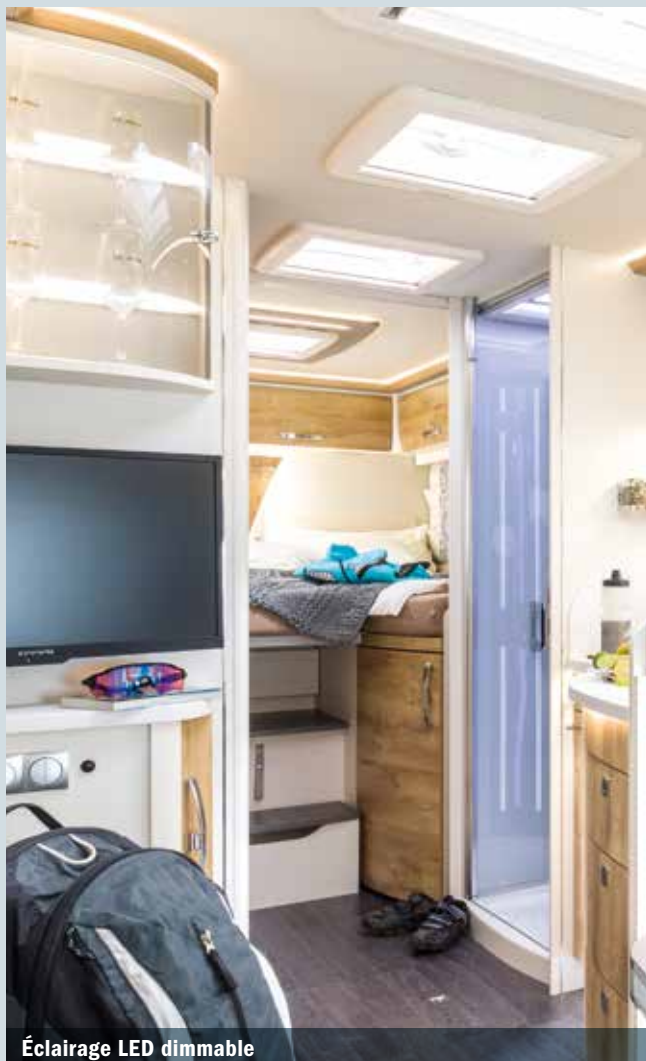
Éclairage LED dimmable