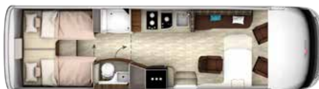
I 890 GD-B TITAN