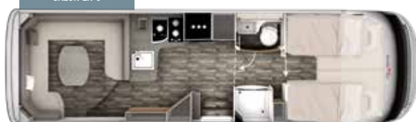
I 840 PLUS TITAN