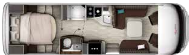
I 840 QD TITAN