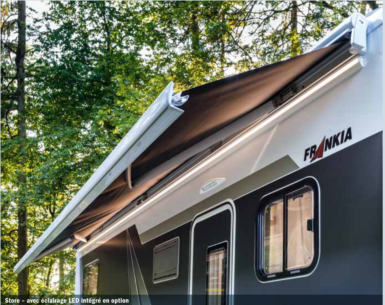
Store - avec éclairage LED intégré en option