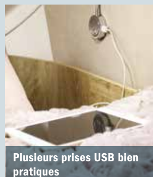
Plusieurs prises USB bien pratiques