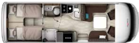
I 790 GD TITAN