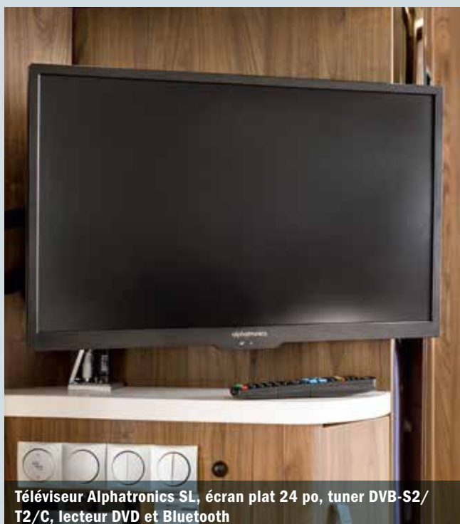
Téléviseur Alphatronics SL, écran plat 24 po, tuner DVB-S2/T2/C, lecteur DVD et Bluetooth