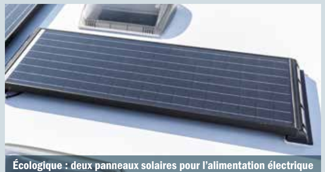
Écologique : deux panneaux solaires pour l'alimentation électrique