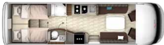
I 890 GD TITAN