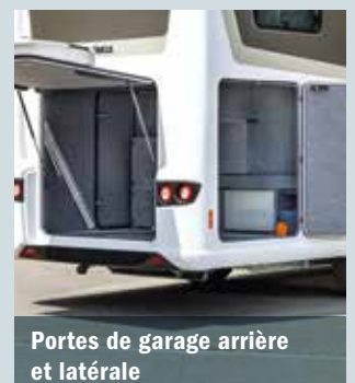
Portes de garage arrière et latérale