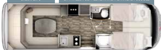
I 790 PLUS TITAN

LIT PAVILLON SUPPLÉMENTAIRE À L'ARRIÈRE POSSIBLE