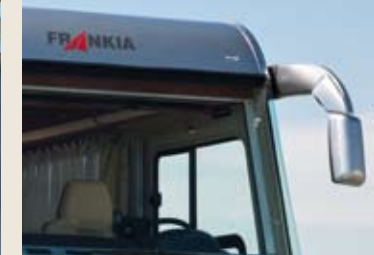
Panorama-Außenspiegel Rétroviseurs panorama Panoramic outside mirrors