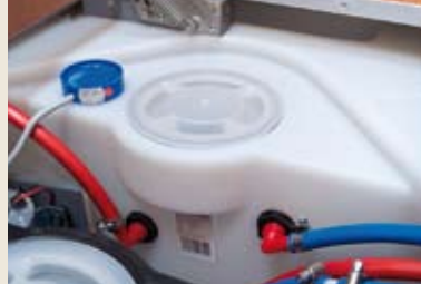
Frischwassertank 300 l Réservoir eau propre 300 l Fresh water tank 300 ltr