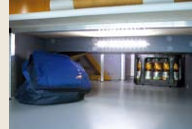
Seitlich große Stauräume durch seitliche Absenkung De grandes soutes grâce aux rabattelements latéraux A lot of storage space due to the side lowering