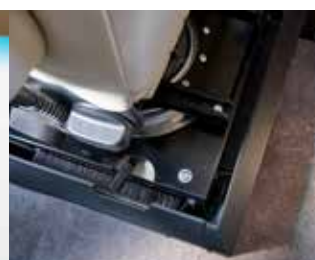
Alde dans le plancher et le siège