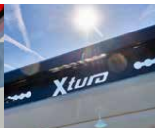
Galerie de toit