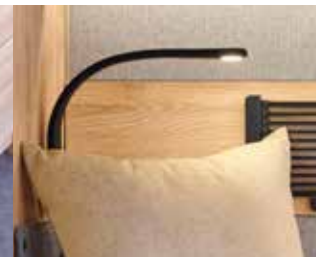
Lampes à col de cygne