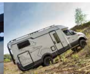
Arête de la carrosserie - angle de pente