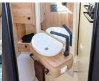
Paroi de douche pivotante