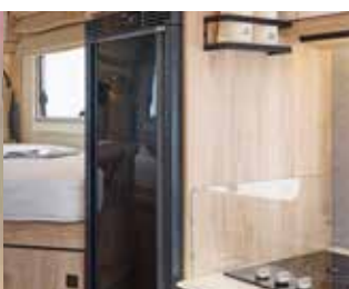
Réfrigérateur à compresseur