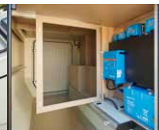
Garage avec centrale de commande électronique

*Certains présentent des équipements spéciaux