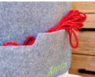
Pochettes en feutre