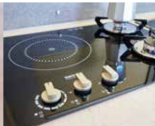
Cuisinière à gaz/induction