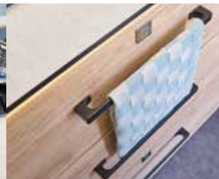
Barre de serviette