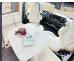
Siège individuel Face to Face