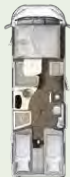
IL 720 EB