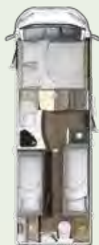
IL 730 EF