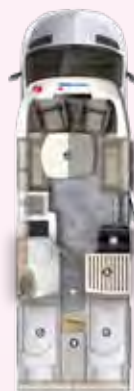
PT 726 EF