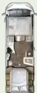
IL 720 QF