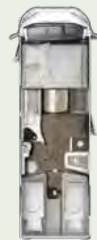
IL 720 EF