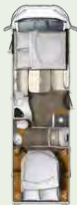
I 760 QF