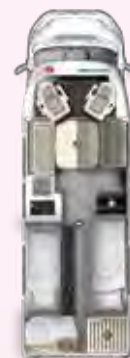
PT 730 EF