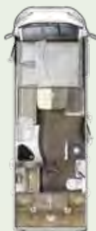
IL 695 LF