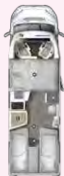
PRS 720 EB