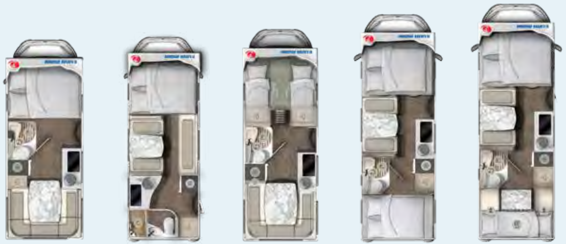
A ONE 570 HS