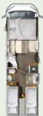
I 760 EF