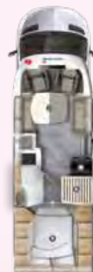
PT 726 QF