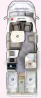
PT 695 EB