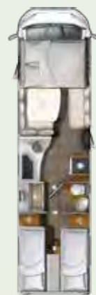
I 890 EB