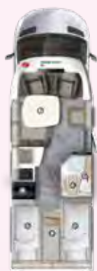
PT 696 EB