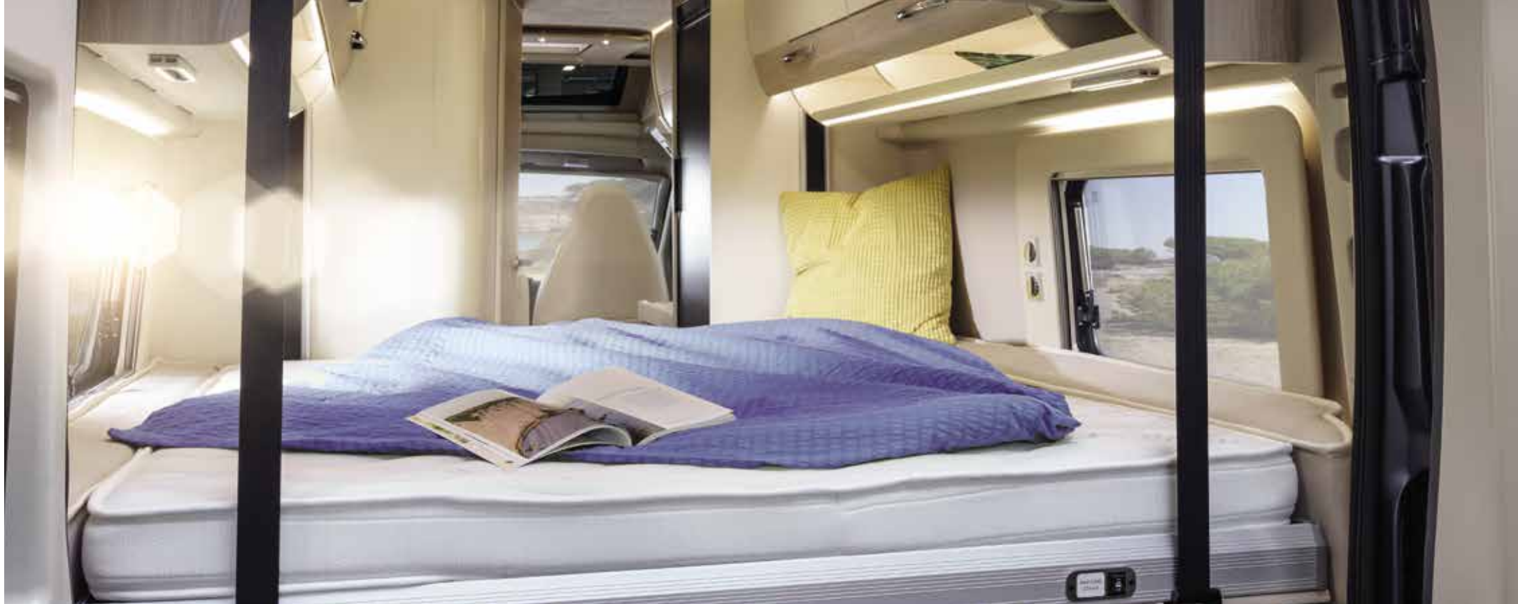
Implantation : V 635 HB †

Si l'on veut le poids-lourd au programme – ou bien plutôt le wagon-lit ? En-dessous du lit montant par simple pression d'un bouton, doté d'une généreuse surface de couchage, s'ouvre un compartiment à bagages de 1 800 x 1 200 x 1 300 mm (LxlxH) – cela convient même pour de nombreuses motos.