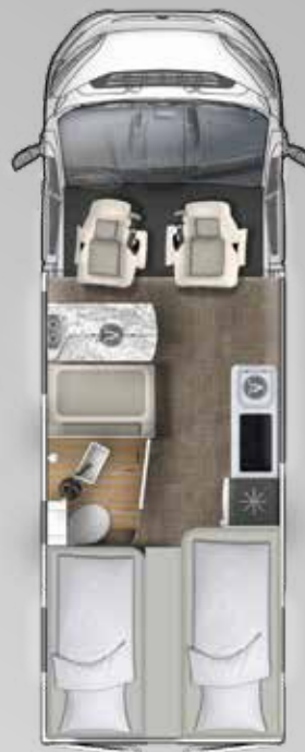
V 635 EB