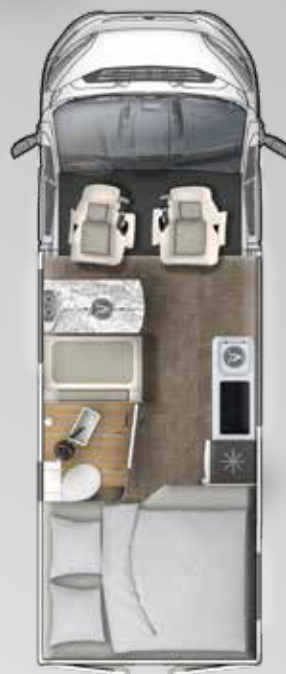
V 595 HB