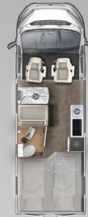
V 635 HB