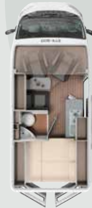
CV 540 DB