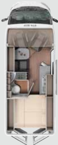
CV 600 DB