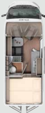
CV 600 BB