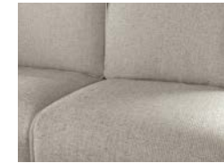
Heron – avec finitions en look cuir (option)