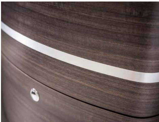
MOBILIER EN CÈDRE DE L'ATLAS AVEC BANDES EN INOX SUR LA FAÇADE

Formidable sensation d'espace. La ligne de mobilier Rotondo en cèdre de l'Atlas avec bandes en inox séduit par son langage volontairement émotionnel. Les surfaces en matériau minéral de grande qualité « Carrara Bianco » dans la cuisine et « Onyx Bianco » dans la salle de bain offrent une optique matte soyeuse. Le sol « Amtico » de style yacht et résistant à l'abrasion procure un excellent confort de marche et ses joints argentés reflètent les bandes en inox du mobilier.