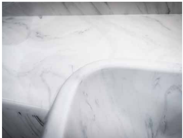
MATÉRIAU MINÉRAL « ONYX BIANCO » DANS LA SALLE DE BAIN (CENTURION ACTROS)