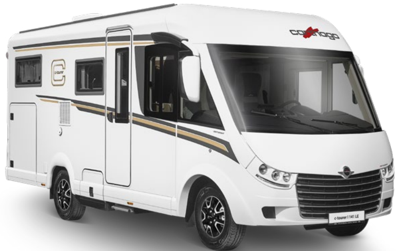
Modèle : c-tourer I 141 LE*

Les modèles c-tourer Lightweight se démarquent par une longueur de véhicule courte, jusqu'à 7 m, une maniabilité parfaite et un poids propre étonnamment faible. Grâce à la technologie de construction légère de Carthago, ils conviennent parfaitement à une immatriculation dans la catégorie des véhicules de 3,5 t