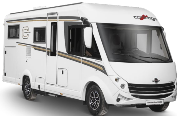
Modèle : c-compactline I 138 DB*

Le camping-car le plus léger dans la catégorie Premium des intégraux de 3,5 t. Il est indiqué pour un usage urbain grâce à une largeur extérieure plus étroite de 15 cm et des longueurs de véhicule compactes