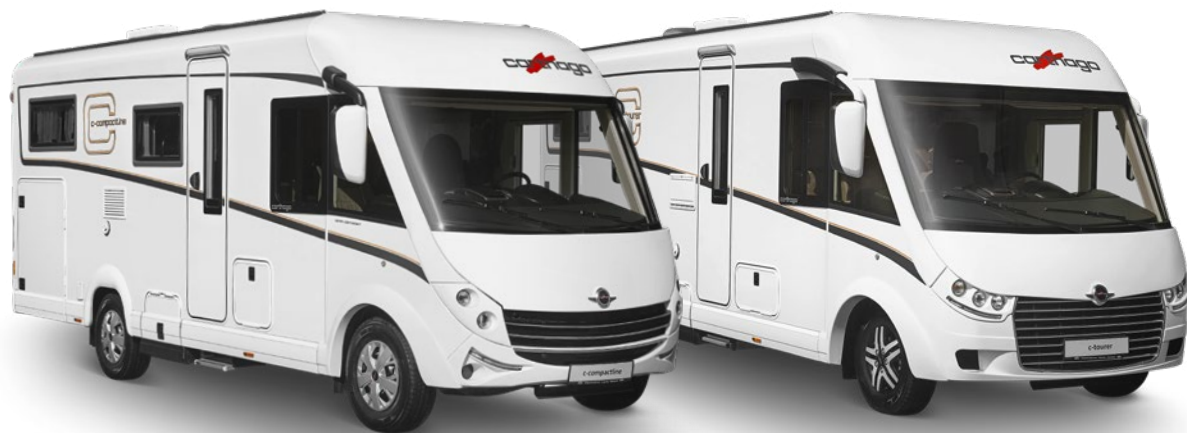
c-compactline Super-Lightweight c-tourer Lightweight